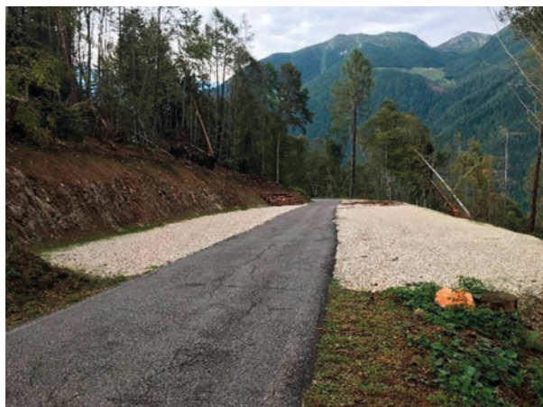
Nuovo piazzale loc. "Marana"