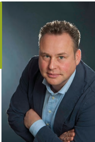
FABRIZIO TRENTIN SINDACO DI TELVE