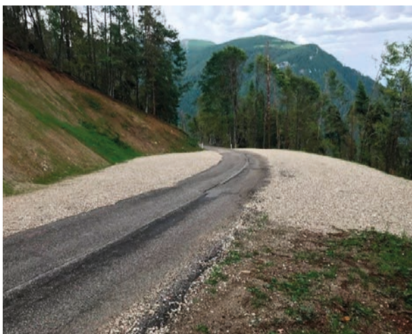
Allargamento piazzale loc. "Canai Musiera"