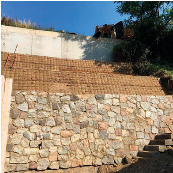
Ziropa - Manghen