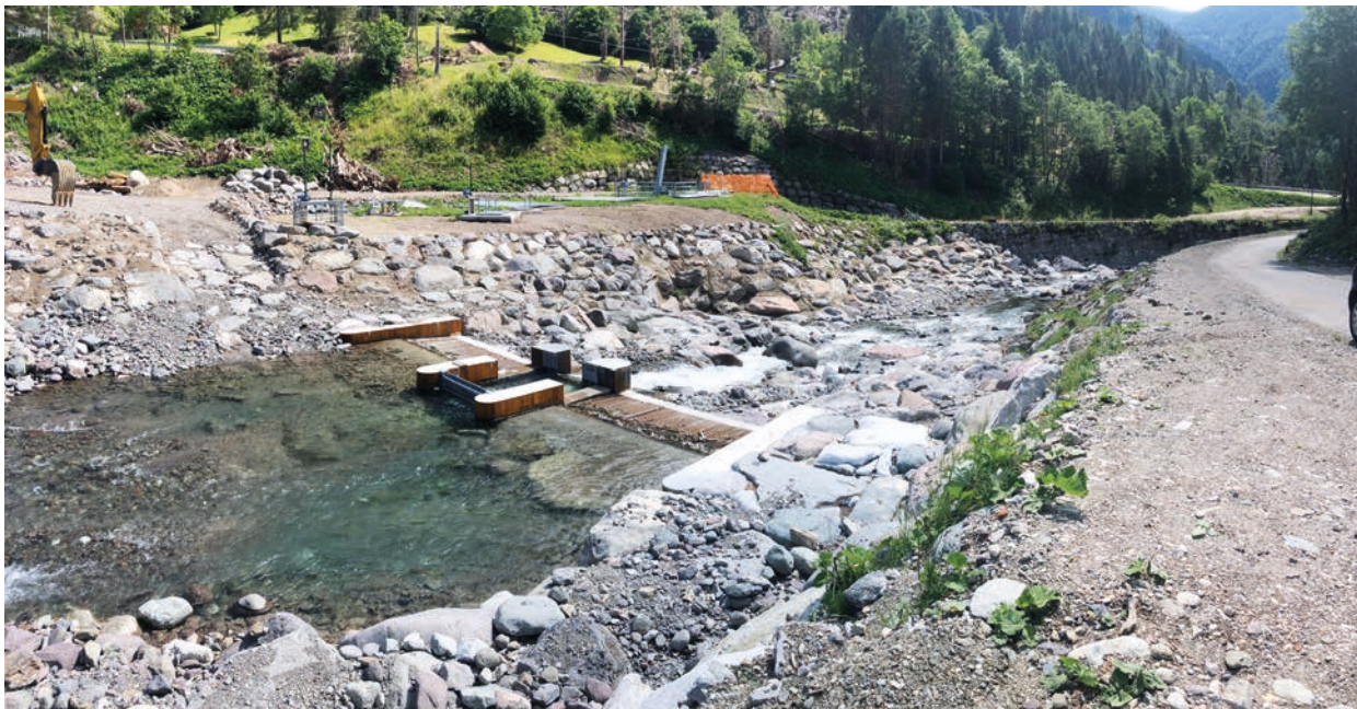
Lavori a sud dell'opera di presa

sono state affidate alla ditta Troyer S.p.A. di Vipiteno. I lavori di ripristino sono in corso e saranno completati entro settembre. Le opere in alveo sono state concordate con il Servizio Bacini montani della Provincia autonoma di Trento che proprio in queste settimane sta lavorando al ripristino degli argini a monte della nostra opera di presa garantendo per il futuro maggiore protezione da eventuali esondazioni.