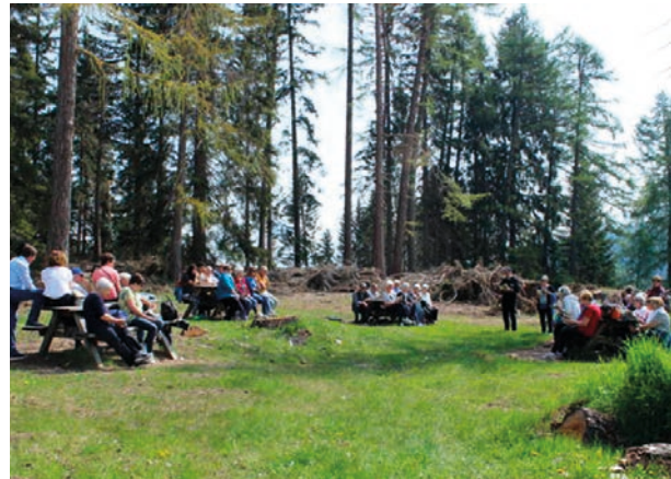
I pensionati in pellegrinaggio

Ultimo appuntamento veramente importante: il giorno 8 giugno dopo la S. Messa delle 20.00 la lettura e l'approvazione da parte dei soci del nuovo statuto che, appena approvato dalla Provincia e registrato all'Ufficio delle Entrate sarà riposto in