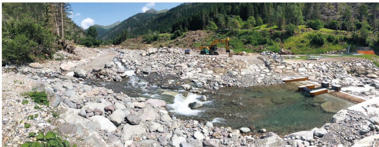
Lavori a nord dell'opera di presa