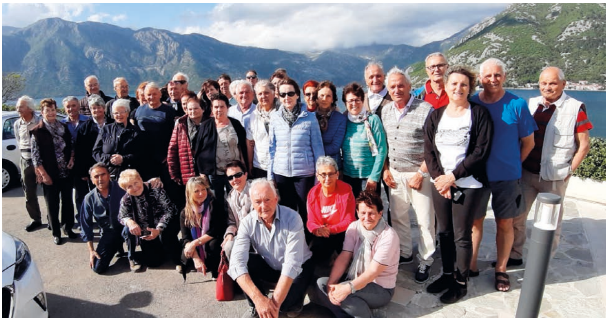
Montenegro - Fiordo Bocche di Cattaro - aprile 2019