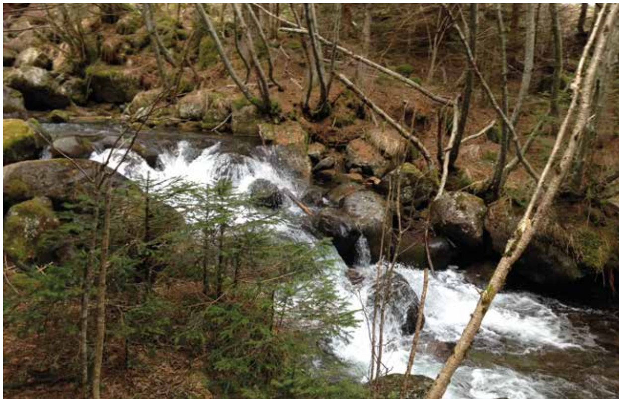
Un tratto del torrente Masolo

Nei prossimi mesi il Consiglio Comunale discuterà e delibererà in merito al futuro di questo progetto.