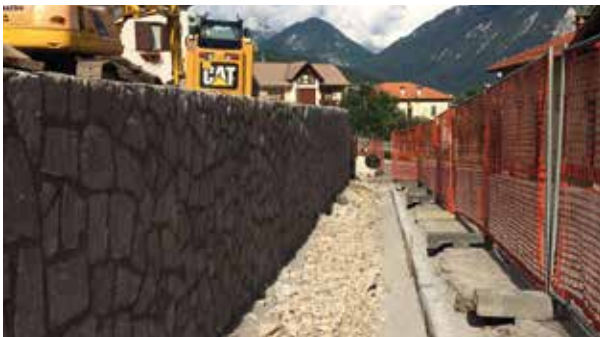
Marciapiede di via Canonica