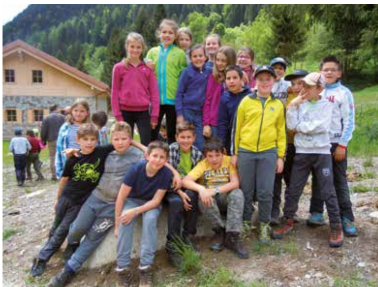
Per loro ... è stata l'ultima volta!

Ovviamente non è potuta mancare la messa a dimora di alcune piante con l'intervento degli uomini del corpo forestale che ci hanno spiegato che anche gli alberi si ammalano e devono venir tagliati: è stato emozionantissimo assistere alle fasi di abbattimento e alla caduta di uno di essi! E poi ... quello che anche gli adulti ricordano sicuramente della Festa degli alberi: il momento del pasto! Al sacchetto della merenda di una volta, si è aggiunto un delizioso pranzo , preparato dagli alpini e dai vigili del fuoco, a base di pastasciutta, polenta, wurstel, verdura e fragole. Ringraziamo tutti quelli che erano presenti alla festa e hanno collaborato alla sua riuscita.