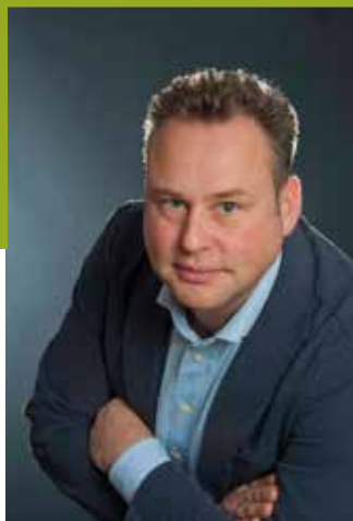
FABRIZIO TRENTIN SINDACO DI TELVE