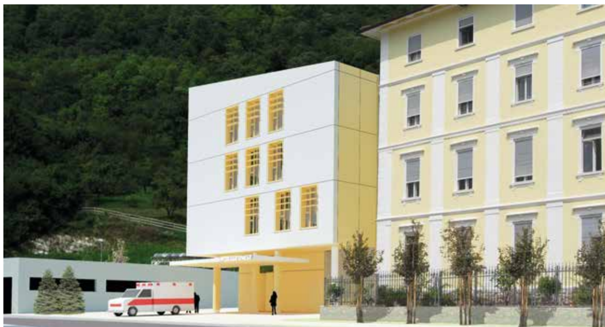
Una vista 3D del futuro ospedale