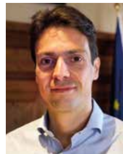
Luca Zeni Assessore alla salute e politiche sociali