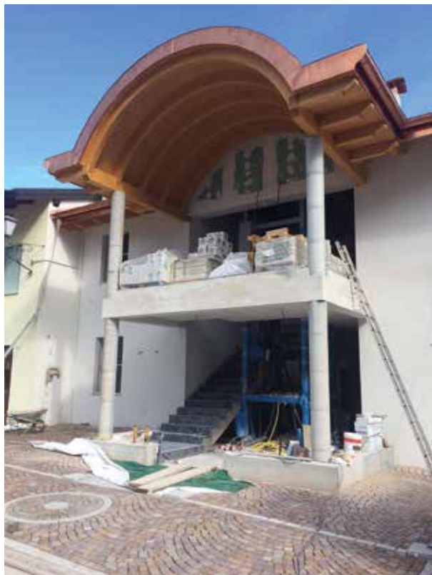
Ambulatori medici in costruzione