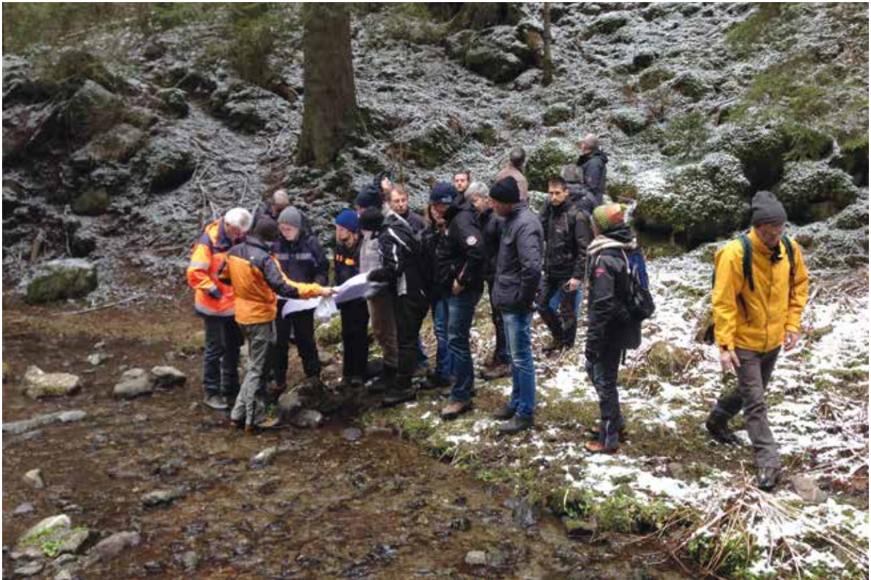
Sopralluogo presso il torrente Masolo del 28 aprile 2016

nibile e la compensazione ambientale presentato dal Comune di Telve autorizzando l'avvio del procedimento di valutazione dell'impatto ambientale superando di fatto il vincolo dei 10 km quadrati di bacino imbrifero essendo questo progetto basato su un bacino imbrifero di 8,1 km quadrati.