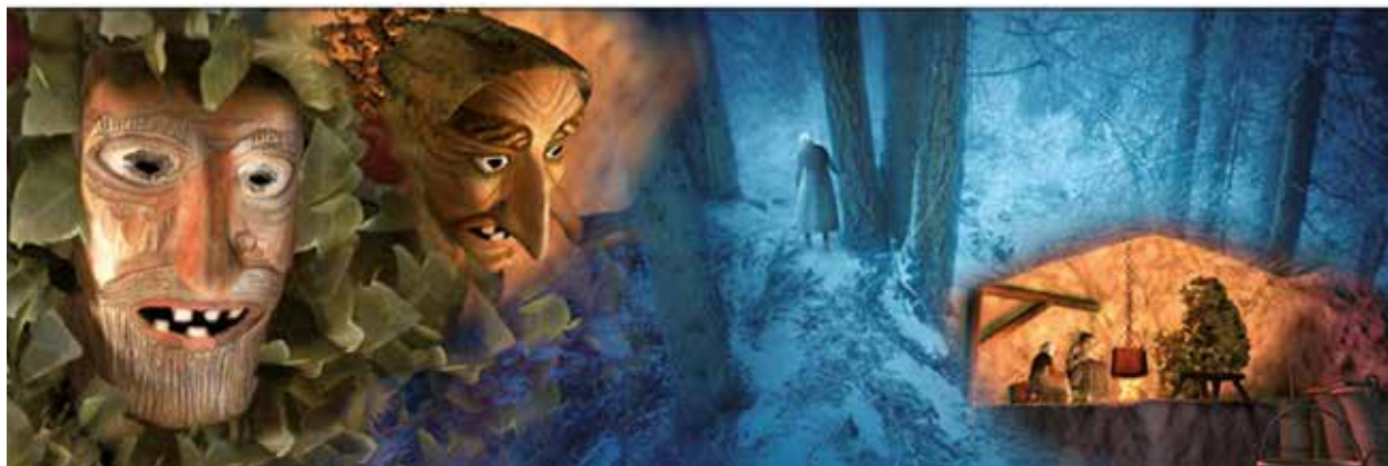
Illustrazione tratta dal libro con DVD-Video: "Leggende dell'UOMO SELVATICO" di Andrea Foches, edito da Museo degli Usi e Costumi della Gente Trentina e Priuli & Verlucca Editori, 2007

L'accoglienza l'è una de le opere de misericordia e se no volè badarme a mi scoltè el Papa che el lo dir ogni dì!