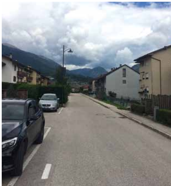
Illuminazione a LED in via Hoffer