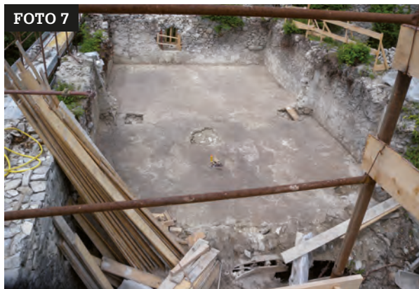
Veduta del pavimento in battuto rinvenuto dopo la rimozione del materiale di crollo presente sull'estradosso della volta.. Arch. G. Gentilini.