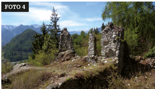
Foto 1-4: vedute del Palazzo Nuovo prima dell'inizio dei lavori. Arch. G. Gentilini.