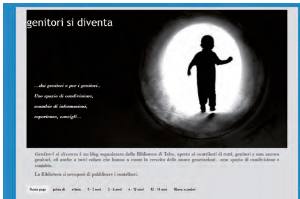
"genitori si diventa" ( http://imperfettigenitori.blogspot.it/ )

Il primo, openspace , è dedicato al mondo giovanile; vuole essere uno spazio di condivisione fra i giovani, un luogo virtuale dove mettere in comune le proprie esperienze, che siano di viaggio, di studio o di lavoro. Uno spazio dove proporre o commentare la propria musica preferita, scrivere una poesia o recensire un libro; chiedere aiuto od informazioni su qualsiasi argomento.