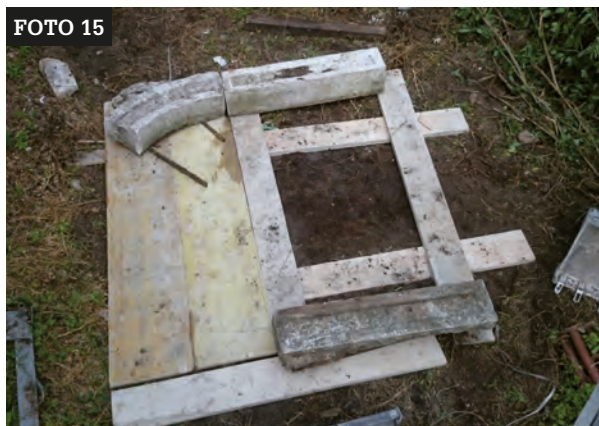
Elementi del portale rinvenuti durante i lavori. Arch. G. Gentilini.