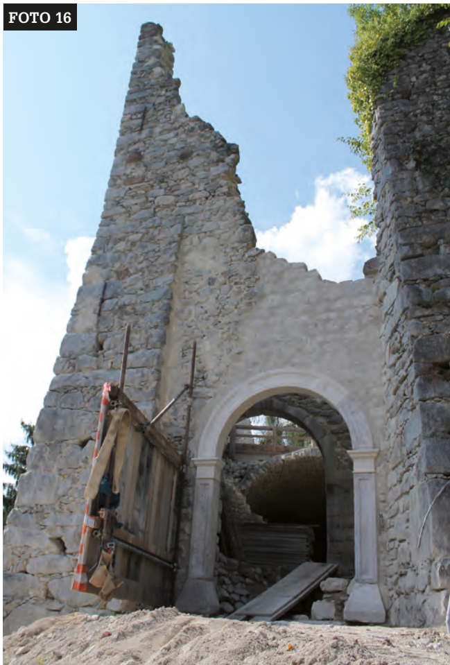
Il prospetto est al termine dei lavori, con il portale ricostruito e ricollocato. Arch. G. Gentilini.