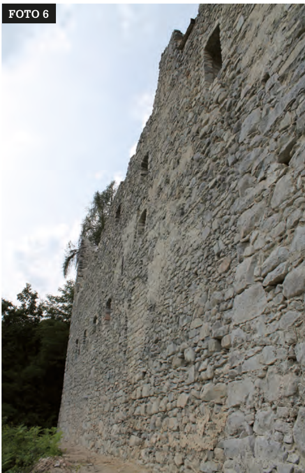
Foto 5-6: vedute interna ed esterna del prospetto meridionale del Palazzo Nuovo al termine dei lavori. Arch. G. Gentilini.

lavori sono stati affidati all'impresa COSTRUZIONI BATTISTI s.r.l. di Borgo Valsugana che si è avvalsa dell'impresa subaffidataria GIANNI GIANESINI & F.lli s.n.c. per le operazioni di scavo e movimento terra e del dott. Italo Bettinardi titolare dell'impresa ARCHEO.RES s.n.c. per l'assistenza archeologica.