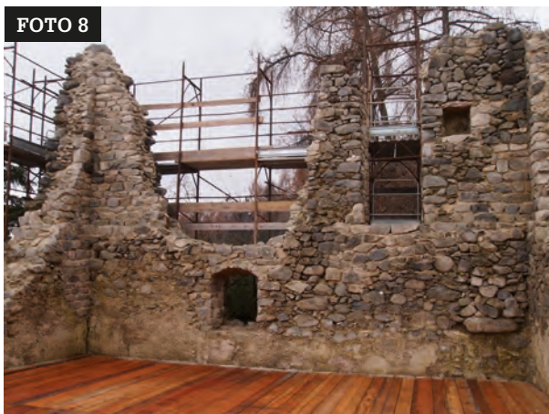
FOTO 8 Veduta degli ambienti sopra l'estradosso della volta al termine dei lavori. Arch. G. Gentilini.