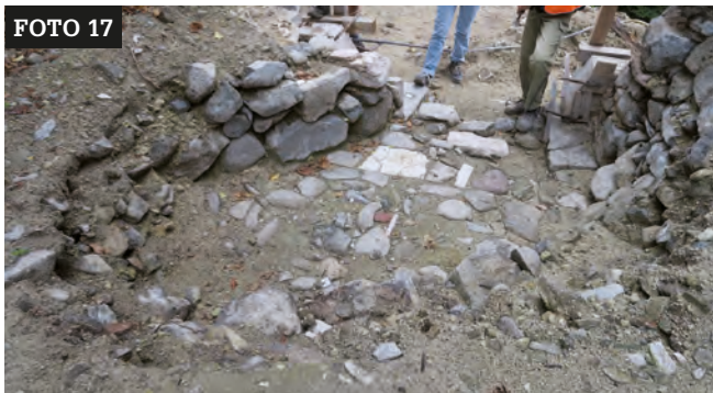
Muratura e pavimentazione rinvenute durante le operazioni di scavo nell'area del portale. Arch. G. Gentilini.

per poter completare la realizzazione e ricollocazione del portale; i nuovi elementi sono stati realizzati secondo le ricostruzioni fatte con le fotografie storiche eseguite dalla Direzione Lavori ma semplificando le finiture (foto 16). Durante la rimozione del materiale presente davanti al portale sono state messe in luce la parte inferiore delle spalle dell'arcata interna con porzione della soglia ma anche una muratura che si addossa alla spalla di destra e che riduce di quasi un terzo il passaggio del portale (foto 17). Si è reso quindi necessario proseguire nello scavo con l'assistenza archeologica per indagare meglio la situazione. L'esecuzione di un sondaggio stratigrafico ha evidenziato come la muratura sia chiaramente posteriore alla spalla del portale cinquecentesco, è legata a malta e potrebbe essere la base della muratura che si vede nella fotografia del 1915-1916 con il soldato austriaco (foto 18). Durante un sopralluogo con la Soprintendenza si è convenuto che la situazione rinvenuta necessiti di un approfondimento archeologico che verrà rimandato a prossimo intervento. I lavori si sono conclusi con il montaggio del portale lapideo cinquecentesco e il rifacimento della muratura soprastante.