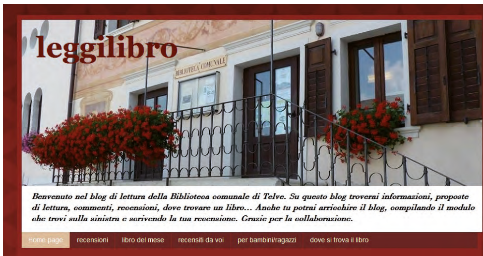
"leggilibro" ( http://leggilibrobibliotelve.blogspot.it/ )

Il terzo, leggilibro , è invece dedicato ai nostri lettori. A loro chiediamo di partecipare, inviandoci le proprie recensioni, aggiungendo non tanto un giudizio sul libro che hanno letto, ma se è piaciuto o meno. Per fare questo abbiamo aggiunto un semplice modulo da compilare. Attraverso un apposito link sarà inoltre possibile sapere in che biblioteca trovare un libro ed anche prenotarlo. Se invece lo si vorrà acquistare, utilizzando un altro modulo, la Libreria Il Ponte di Borgo lo fornirà a prezzo scontato. Contiamo sulla vostra visione e partecipazione a tutti i blog, secondo il vostro interesse.