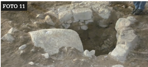
Contrappeso in pietra e struttura del pozzo presenti nel grande ambiente voltato. Arch. G. Gentilini.