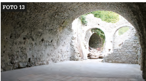
Foto 12-13: vedute del grande ambiente voltato al termine dei lavori. Arch. G. Gentilini.