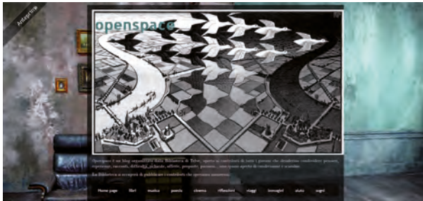
"openspace" ( http://openspaceyoung.blogspot.it/ )