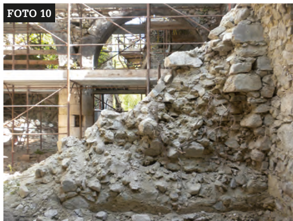
FOTO 10 Muratura di divisione tra ambienti voltato e antistante come si presentava dopo la rimozione del materiale di crollo. Arch. G. Gentilini.