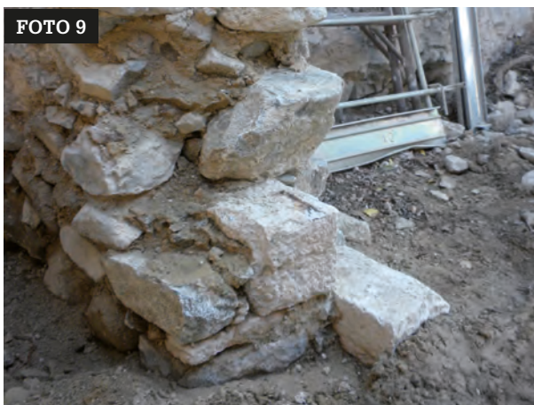
FOTO 9 Soglia in pietra rinvenuta dopo la rimozione del materiale di crollo all'interno del grande ambiente voltato. Arch. G. Gentilini.

dato, si era esclusa la possibilità di un suo rinvenimento. È stato quindi eseguito un sopralluogo con i funzionari della Soprintendenza per i Beni culturali - Ufficio beni architettonici arch. Cecilia Betti e Ufficio beni archeologici dott.ssa Nicoletta Pisu in occasione del quale è stato concordato di eseguire uno scavo stratigrafico di alcuni settori della pavimentazione per verificare la situazione dell'estradosso della volta e valutare la posa dei tiranti in acciaio previsti in progetto per realizzare la cerchiatura della volta. La situazione rinvenuta ha permesso di proseguire con la posa delle barre come previsto nel progetto. Al termine delle