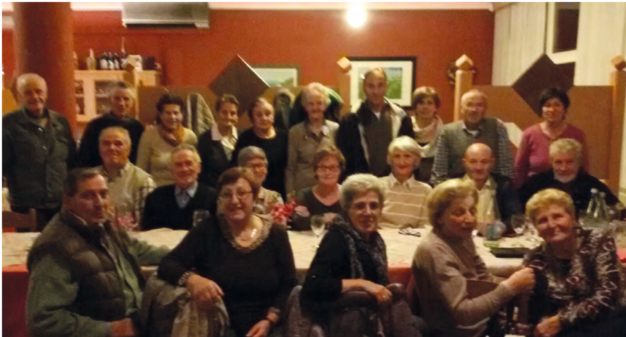
Gruppo di aiutanti della Festa dell'Amicizia Baessa 2015