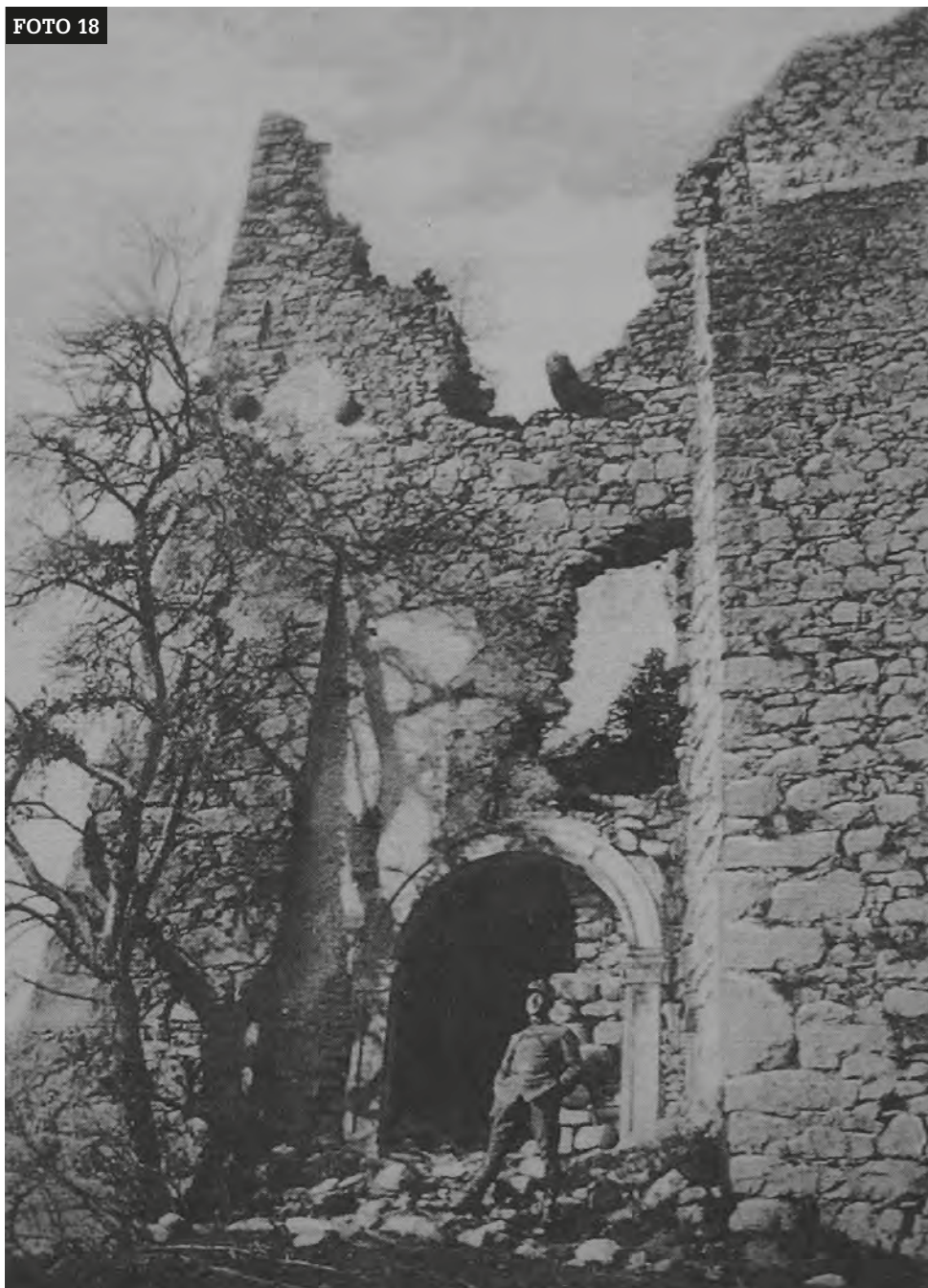
Rovine di Castellalto presso Telve in Valsugana (1915-1916).