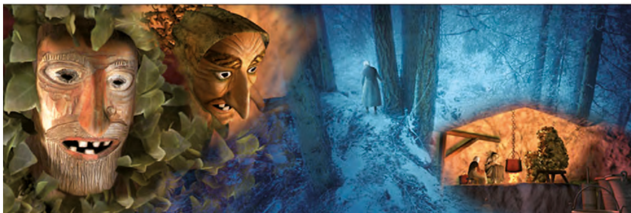
Illustrazione tratta dal libro con DVD-Video: "Leggende dell'UOMO SELVATICO" di Andrea Foches, edito da Museo degli Usi e Costumi della Gente Trentina e Priuli & Verlucca Editori, 2007

Son el salvanelo folletto monello mi auguro che Telve diventi ancora più pulito più diligente, più bello!