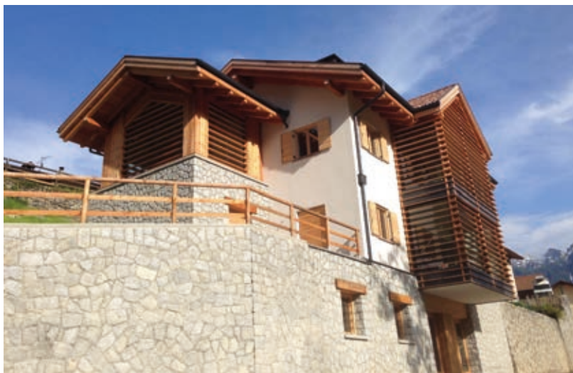
Sede del nuovo servizio di conciliazione

Per qualsiasi informazione, curiosità o dubbio potete rivolgervi agli uffici comunali al numero 0461 766054.