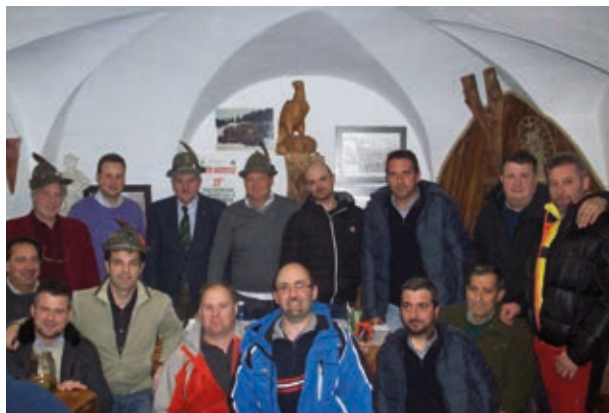
Nuovo direttivo alpini 2014