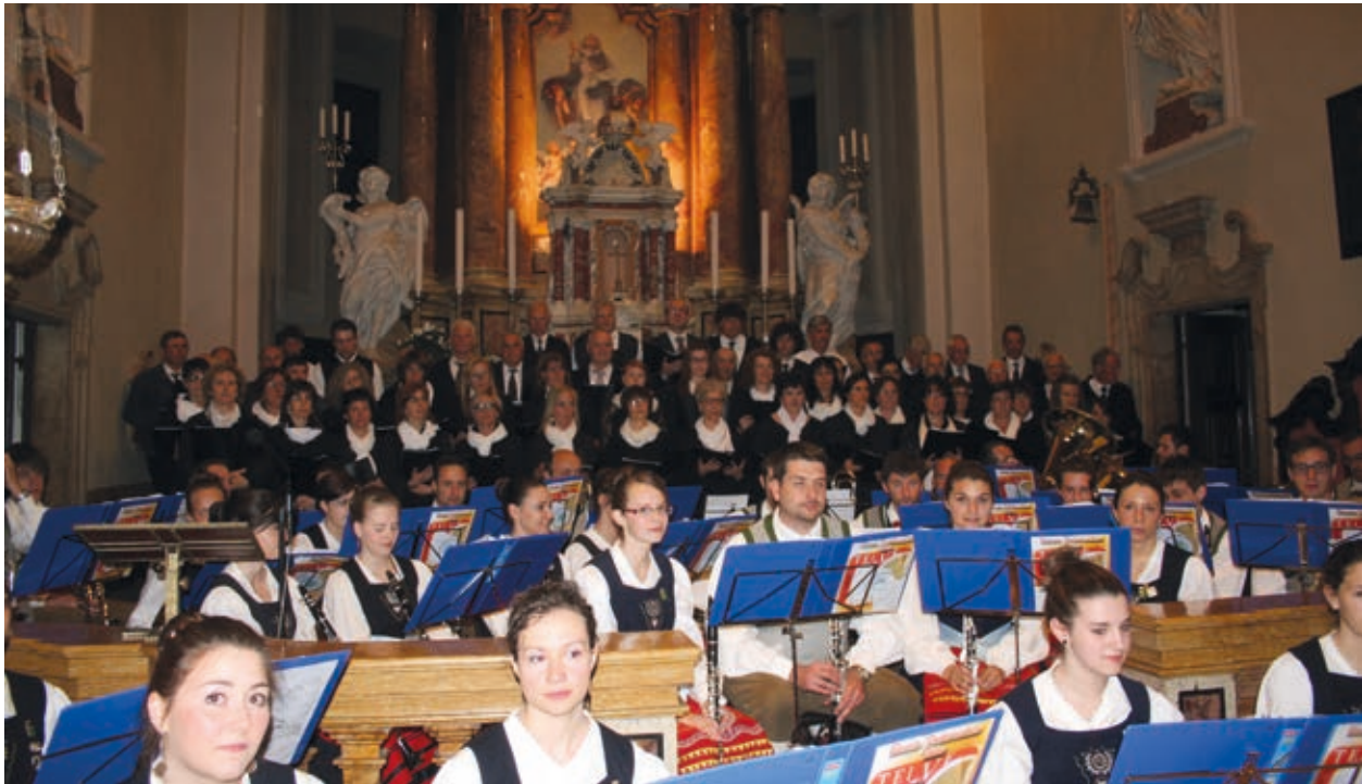
La Banda di Telve e il coro S. Evangelisti