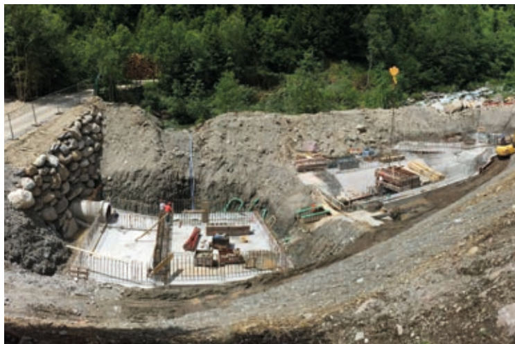
Zona presa Spinelle – opere realizzazione vasca di carico

I lavori procedono secondo programma e si prevede di completare le opere edili entro la fine del 2014 per poi passare alla messa in opera delle parti elettromeccaniche.