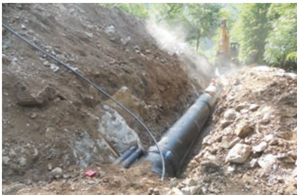
Affioramenti di roccia interferenti con il tracciato e demolizione tramite martellone idraulico

va posa della condotta. È stato possibile ovviare a tale onerosa fase operativa ricorrendo alla presenza di un tombotto sotterraneo originariamente utilizzato come valvola di sfogo per eventuali fenomeni di esondazione, ma ora inutilizzato. Tramite la regolarizzazione della forma, la preparazione del sottofondo di appoggio e l'utilizzo di due condotte in acciaio saldate, è stato possibile raggiungere la sottostante tubazione in ghisa sferoidale e quindi completare il tratto mancante. Attualmente la posa dei tubi è interrotta appena a monte della strada, in attesa del completamento dell'opera di sostegno provvisoria (paratia tirantata) a sostegno del fronte adiacente l'opera di presa: il materiale proveniente dagli scavi di quest'opera permetterà poi il finale rinterro della condotta, una volta raggiunta la "camera valvole".