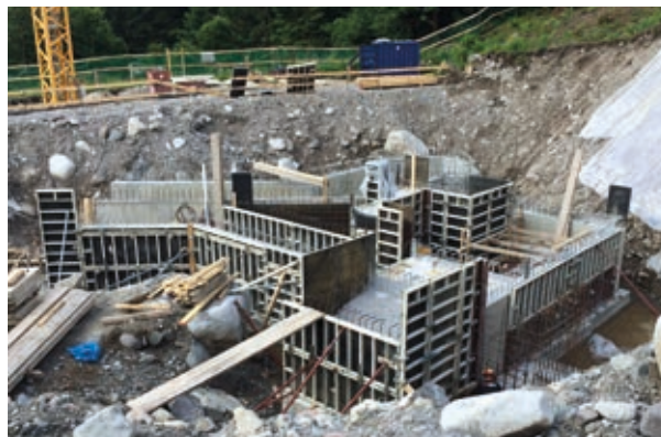
Edificio zona Centrale - realizzazione opere di elevazione parte interrata, scarichi di fondo

Successivamente le lavorazioni sono proseguite con la posa delle tubazioni dal "Ponte Salton" a scendere. Il materiale di scavo si è presentato fin da subito idoneo sia allo scavo che al ritombamento degli stessi, in quanto di matrice ghiaiosa. Si è concordato con SET Distribuzione la messa in opera di un suo cavidotto per l'intero tracciato.