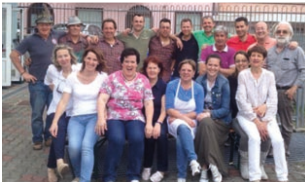
Volontari e non che hanno reso possibile l'inaugurazione