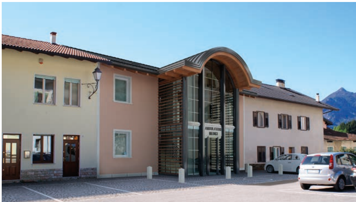
Rendering dei nuovi ambulatori medici