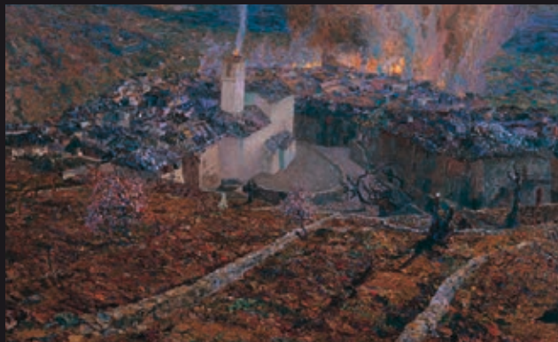
Angiolo-D'Andrea-INCENDIO-A-TELVE - Fondazione Bracco