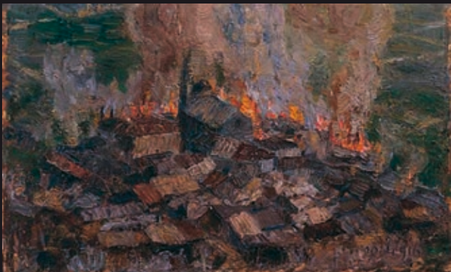
Angiolo d'Andrea TELVE IN FIAMME - Fondazione Bracco