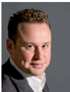
FABRIZIO TRENTIN SINDACO