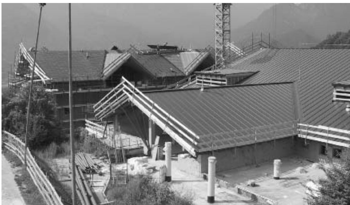
Lavori in corso alla scuola media

La restante parte di proprietà sarà utilizzata dal Comune di Telve che permette l'utilizzo delle parti comuni (cella mortuaria, ossario, cappella). Gli oneri per la bonifica del terreno ed i successivi costi di manutenzione sono a carico del Comune di Telve. Sulla base di tali accordi è stato approntato il progetto esecutivo: si prevede l'avvio dei lavori a fine anno.