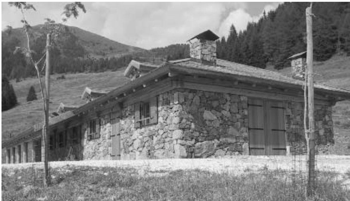
Barco di malga Cere

tuto Comprensivo. L'impresa Pasquazzo appaltatrice dei lavori è stata autorizzata a subappaltare le opere da elettricista alla ditta Tomaselli di Villa Agnedo, le opere di impianto idraulico alla ditta termoidraulica Parotto di Strigno, le opere di carpenteria metallica alla ditta Holzbau di Bressanone, l'esecuzione di intonaci alla ditta Euro costruzioni di Lomaso. Alla ditta Daldoss Electronic sono stati affidati i lavori di fornitura e posa di piattaforma elevatrice "LEVEL", da collocare nel nuovo tunnel di collegamento tra scuola media ed elementare.