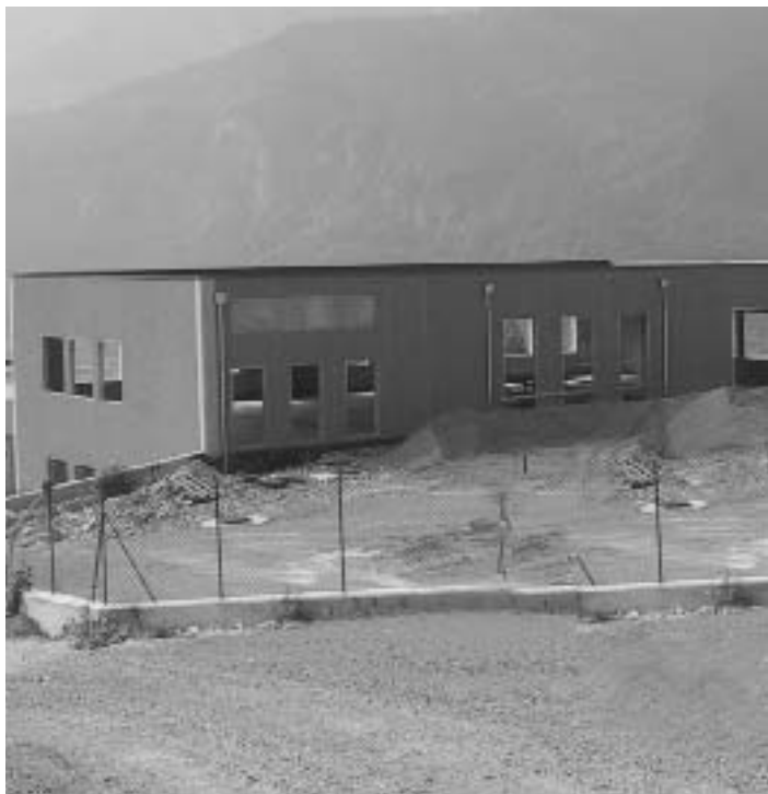
Magazzino comunale in località Nale