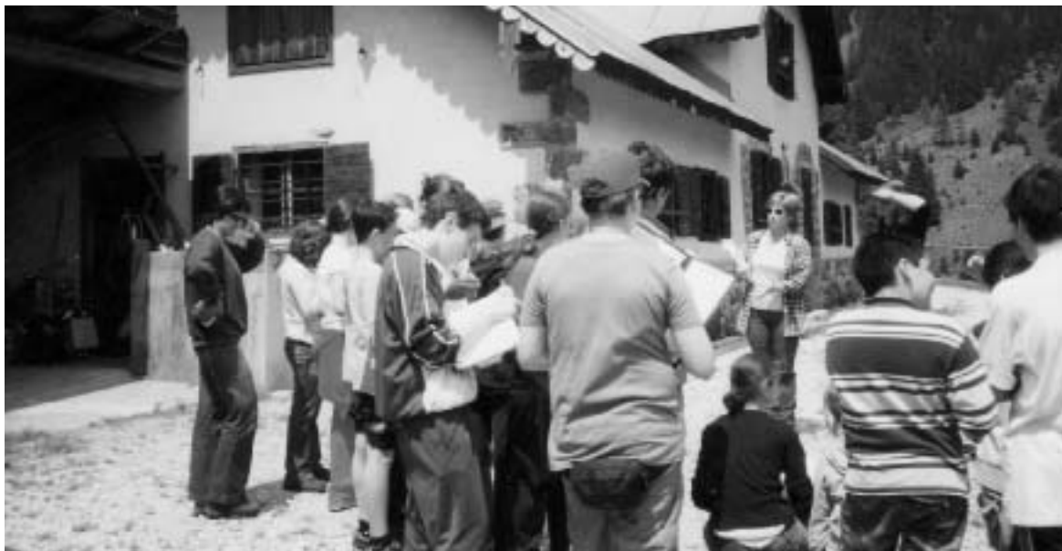
Un momento di attività didattica a Valsolero

latte appena munto; esperienza questa unica per molti dei partecipanti che hanno potuto gustare il sapore del latte crudo e rendersi conto direttamente del rapporto tra cibo ed animale.