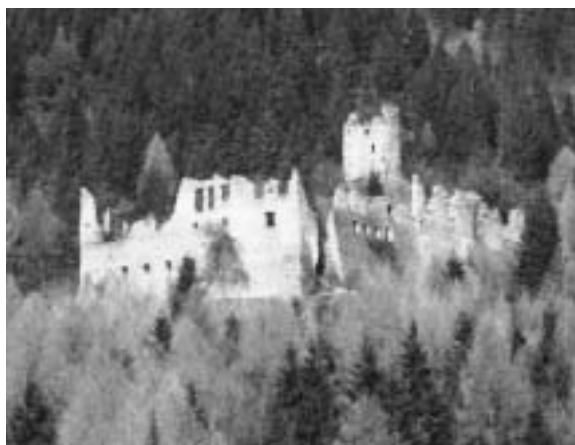
Castellalto fotografato negli anni '90

Con la sottoscrizione dell'atto costitutivo è nata ufficialmente il 7 aprile scorso l'Associazione verso l'ecomuseo del Lagorai - nell'antica giurisdizione di Castellalto".