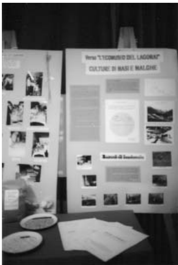
Particolare della mostra dedicata al Lagorai presso la scuola media di Arco

Il pomeriggio ha visto il ritorno in valle della comitiva, con visita al terzo tipo di insediamento: il "maso sparso" che circonda il paese, caratterizzato dall'orto e dal piccolo frutteto. Nel caso specifico è stato scelto il maso di proprietà di Luigi Fedele, dove gli studenti hanno potuto assistere alla mungitura delle vacche e assaggiare il