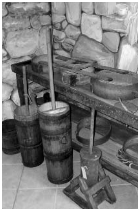
Strumenti per la lavorazione del latte