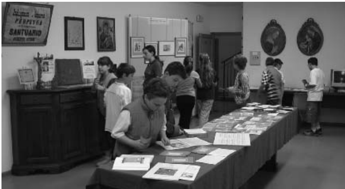
La classe prima A della scuola media visita la mostra a Carzano

sacri quali ostensori, calici, gonfaloni; da messali e registri di duecento anni fa a "santini" ormai dimenticati dai più, per finire con dipinti ed ex voto.