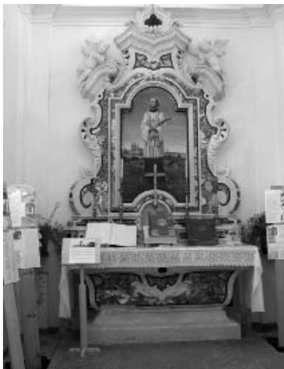
Particolare dell'interno della chiesa di San Giovanni Nepomuceno con l'altare marmoreo e la pala dedicata al santo

Il percorso illustrativo sulle testimonianze sacre presenti nella valle del Vanoi, messo a disposizione dall'ecomuseo del Vanoi, ha suscitato un grande interesse da parte della cittadinanza di Carzano, Telve, Telve di Sopra e Torcegno. Ancora maggiore è stato il coin-