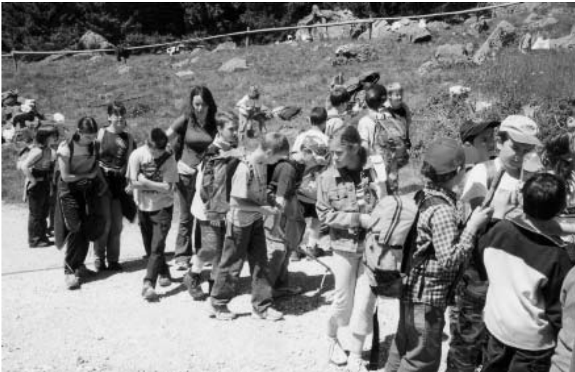
Bambini e insegnanti in cammino verso malga Valtrighetta