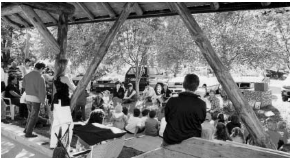
"Andar per fiabe" e Laboratori di pittura in Calamonte e Musiera.