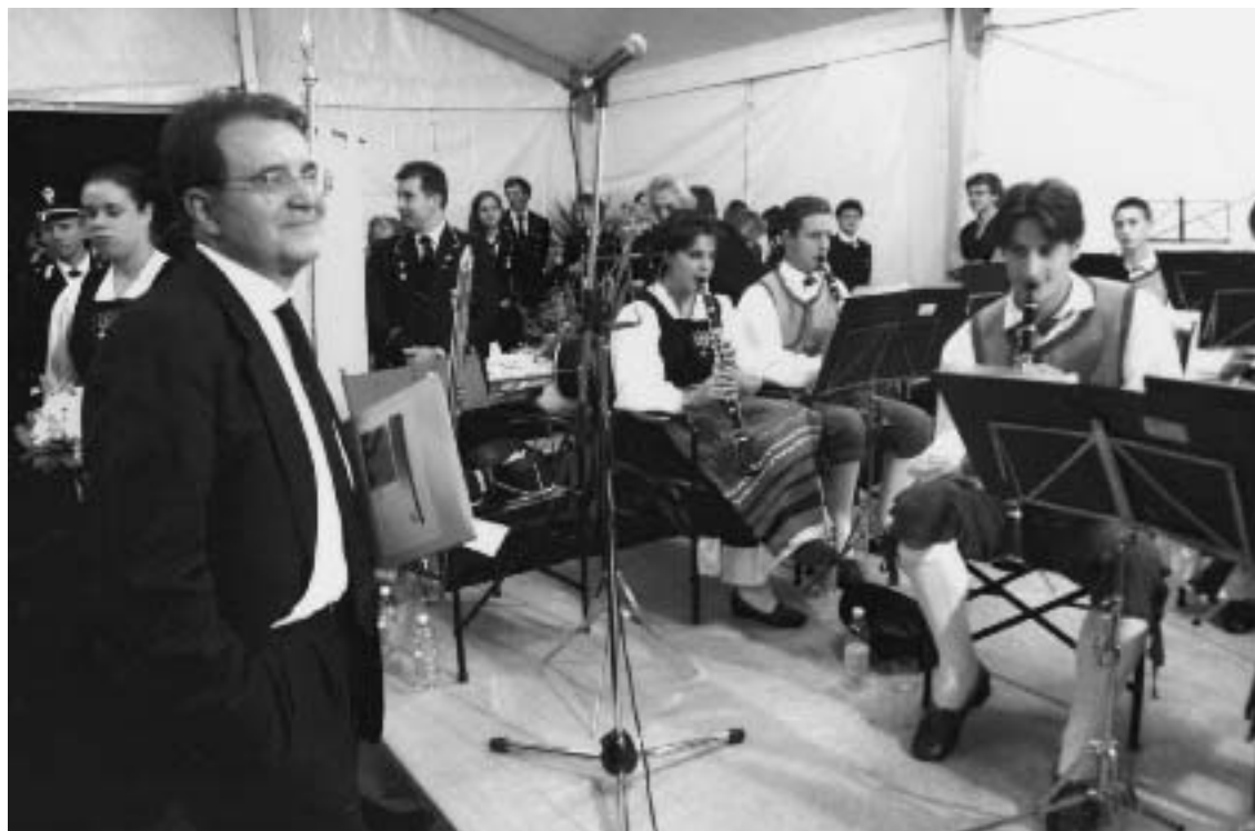
Foto a destra: il Presidente della Commissione Europea Romano Prodi ascolta il concerto della Banda di Telve.

allievi quest'anno sono 46, divisi in 5 classi strumentali e seguiti da 4 insegnanti. Il notevole riscontro di adesioni alla nostra scuola, ci fa ben sperare per il futuro e ci sollecita a perseverare nell'azione formativa, nella convinzione che la cultura musicale favorisce e amplia la maturazione globale dei nostri ragazzi.