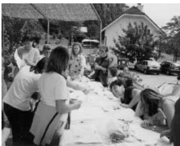
"Giochi de 'sti ani" alla Baessa.