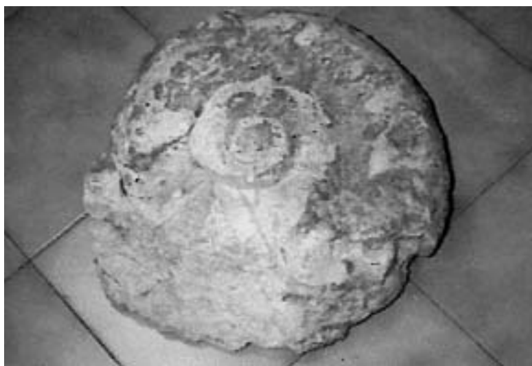
Ammonite proveniente dai Masi di Telve.

Recentemente è giunta al Gruppo Mineralogico una lettera di alcuni studenti dell'Istituto Comprensivo di Telve, con la quale essi domandano come si fa a riconoscere l'età di un fossile e come si risale all'età del terreno in cui vi sono presenti dei fossili.