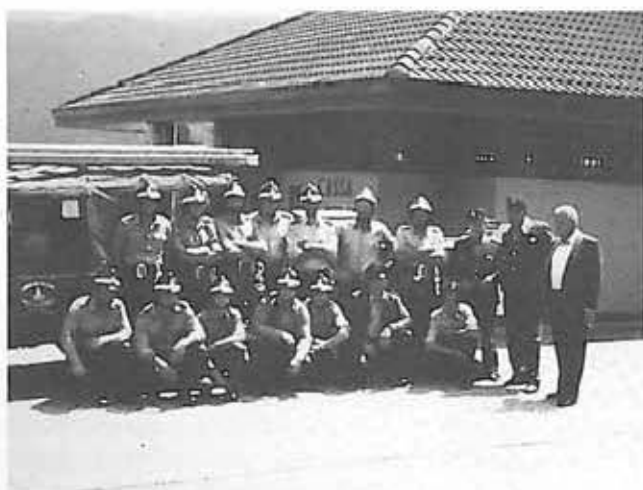
Pompieri pronti alla manovra