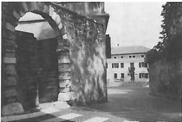
Scorcio sul Municipio

Dal 13 dicembre '83 a tutto giugno '84 il Consiglio Comunale di Telve si è riunito 5 volte: il 29.12, il 27.01, il 17.02, il 17.04 ed il 15.06 per un totale di 82 punti all'o.d.g. (di cui uno a carattere di urgenza); 17 sono state invece le riunioni di Giunta che hanno prodotto 98 deliberazioni.