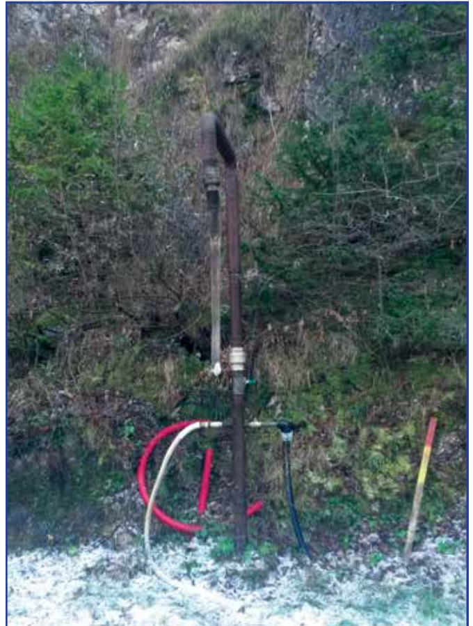
Preso d'acqua per caricabotte, ormai obsoleto, da sostituire come parte della tubazione.

In attesa di un proficuo anno 2016, per poter procedere con i programmi stabiliti, si formulano i migliori auguri per un Buon Natale a tutte le famiglie.