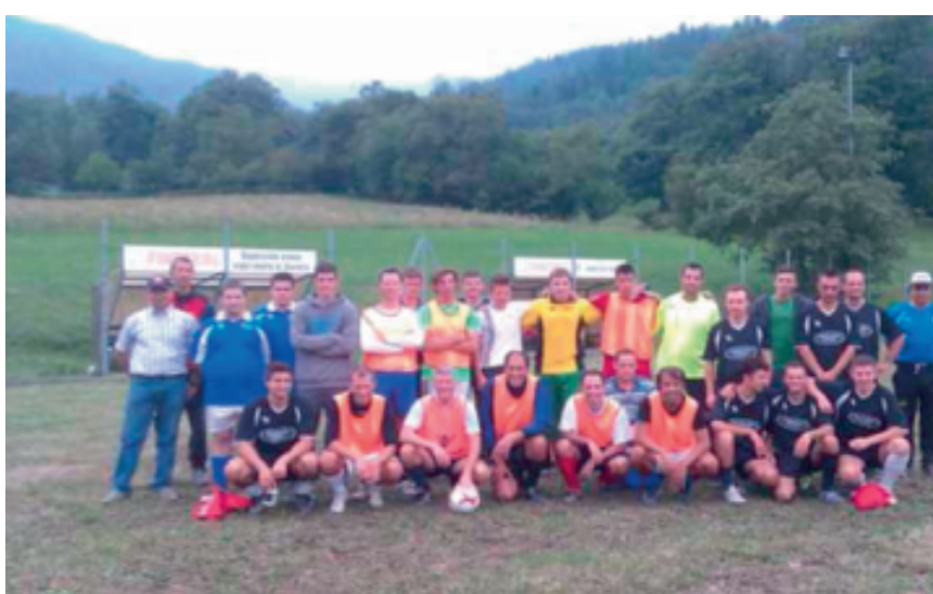
15 settembre: 2° Memorial Manuel Trentin

le squadre di Pompieri, Alpini, Fanti e dell'Associazione Sportiva Genzianella (quest'anno vincitrice). Contiamo di poter ripetere l'evento anche per gli anni futuri, vista la numerosa partecipazione.