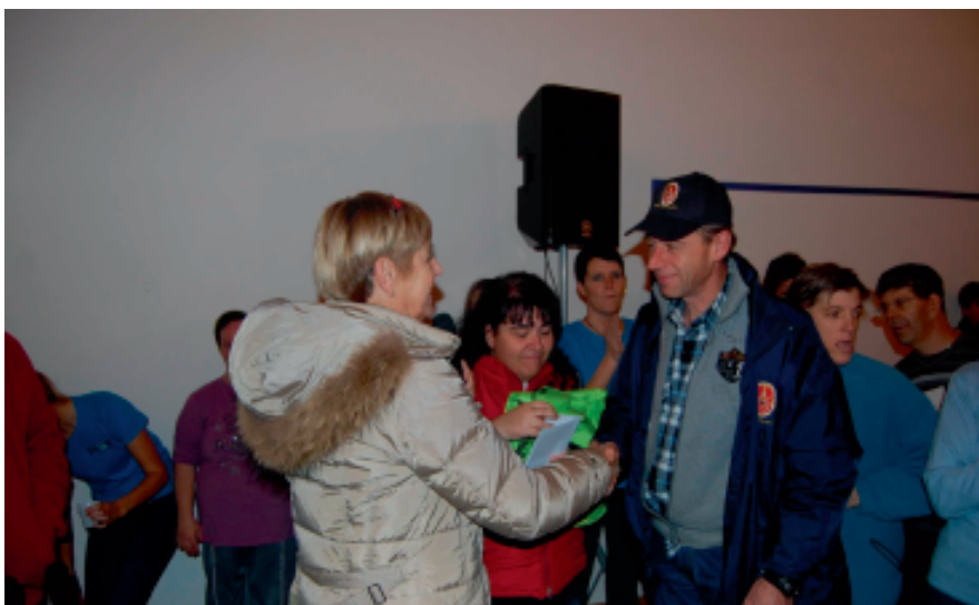
16 novembre: Gruppo GAIA Villa Agnedo