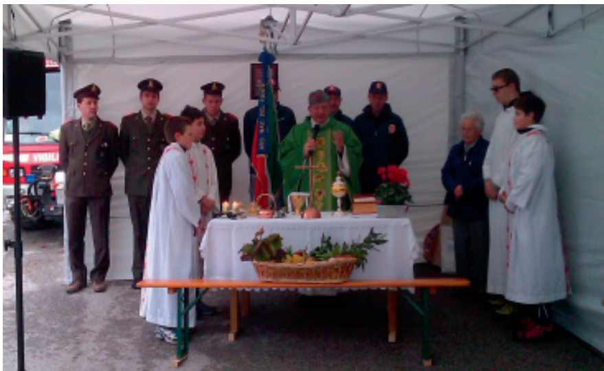
10 novembre: Messa di San Martino alle Fratte

L'Associazione augura a tutti buone feste.