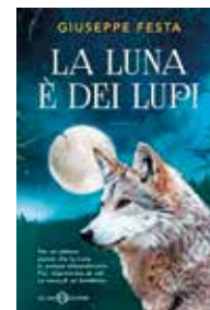
La luna è dei lupi di Giuseppe Festa Salani, 2016

La parola d'ordine è inoltre "nessuno escluso": non solo i libri di carta ma anche audiobook, testi stampati con font appropriati, appositamente predisposti per le disabilità visive e la dislessia.