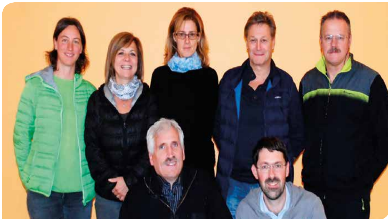
I componenti del nuovo Direttivo dell'Unione Sportiva Marter

della promozione sportiva per i più giovani. Certamente si tratta di impegni considerevoli, servono tempo e dedizione unitamente a continui aggiornamenti secondo le normative vigenti, sia per metodologie sportive, che per la salvaguardia della salute di tutti. Un esempio: da quest'anno è obbligatorio che ogni società deva assicurare, in occasione di allenamenti e gare, la presenza di una persona in possesso di abilitazione all'uso del defibrillatore presente per legge in tutti gli impianti sportivi. Per questo anche l'Us Marter, ha fatto sì che dirigenti e collaboratori siano abilitati ad intervenire in caso di emergenza. Ecco che bisogna essere pronti e disponibili ad interagire con nuove norme e tecnologie. E pronti ad offrire, come sempre, collaborazione e aiuto a chiunque ed in qualsiasi circostanza. Siamo in pochi, ma non manca la volontà, non manca l'entusiasmo. Siamo fiduciosi di riuscire a far bene come si è sempre cercato di fare.