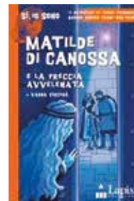
Matilde di Canossa e la freccia avvelenata di Vanna Cercenà Lapis, 2015