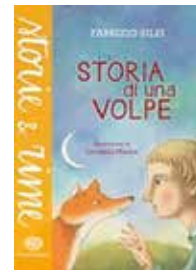
Storia di una volpe, di Fabrizio Silei Einaudi, 2016