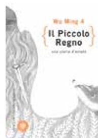
Il piccolo regno, di Wu Ming 4 Bompiani, 2016