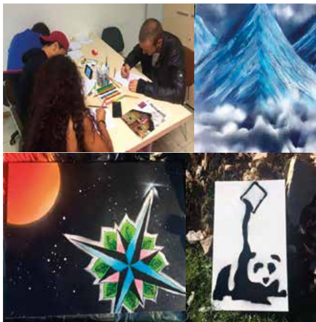
Attività espressive presso lo spazio giovani e alcune opere realizzate dai ragazzi