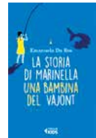
Storia di Marinella. Una bambina del Vajont, di Emanuela Da Ros Feltrinelli Kids, 2015