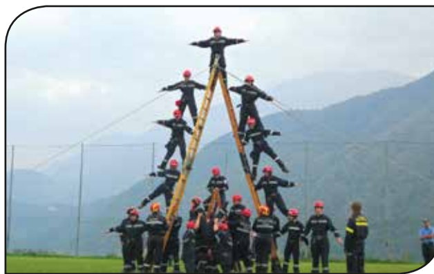
Fasi di una manovra del Gruppo Allievi Bassa Valsugana e Tesino

Finalmente nel nuovo anno, vedremo realizzato il sogno di tutti noi e di chi ci ha preceduti in questo Corpo: il nuovo Magazzino. Da oltre venti anni infatti si aspettava questo momento, ed in più riprese se n'era discusso, ma senza giungere mai ad una svolta. Ora invece inizierà l'iter esecutivo che porterà all'appalto ed alla realizzazione della nuova caserma. Da questo punto di vista è doveroso il ringraziamento all'Amministrazione Comunale, che ha saputo portare a termine con grande sforzo i progetti presentati negli scorsi anni.