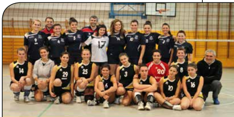
Foto di gruppo in occasione di premiazione della squadra di casa vincitrice del torneo 10ª Coppa Comune di Roncegno Terme

La partecipazione a queste diverse competizioni dà l'opportunità a circa 2 mila atleti, distribuiti fra le varie società del territorio provinciale, di socializzare tra loro e mettersi a confronto sia in campo sportivo sia in campo culturale. Nel passato i risultati conseguiti sono stati a volte soddisfacenti, a volte un po' meno. Comunque la speranza è di un continuo miglioramento. Non si può negare che le difficoltà siano molte ed in continuo aumento sotto ogni a-