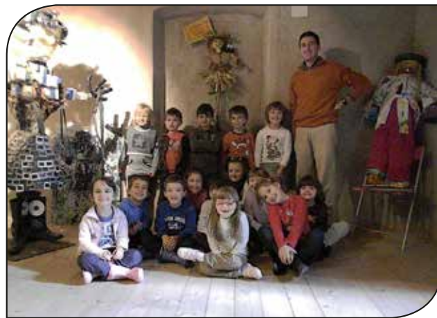
Gruppo dei bambini di 4 anni al Mulino Angeli

I bimbi grandi hanno contribuito ad arricchire la casa degli spaventapasseri donando il loro amico "OCCHIFURBI" un originale spaventapasseri realizzato con una pianta di mais, le bratee, i tutoli ecc. Il contesto era davvero invitante, fra macine antiche e simpatici spaventapasseri i