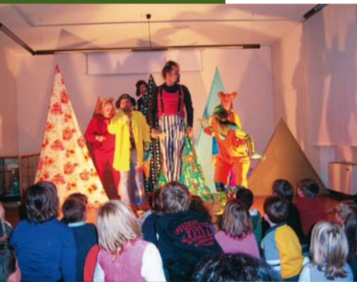
Tarantàs: Natale 2008

Tra i dati più significativi per il 2008 si registra la crescita delle acquisizioni di materiale librario, inteso come libri compresi nel patrimonio della biblioteca per acquisto e resi disponibile dopo il trattamento di catalogazione, etichetta-