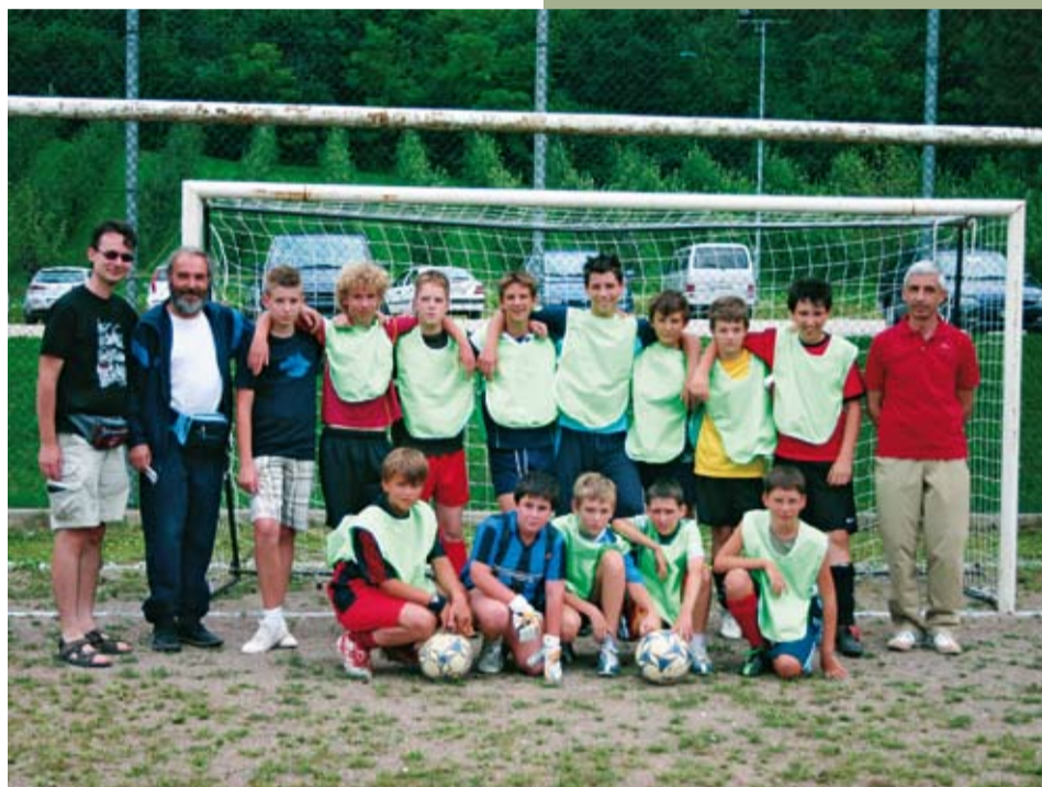
La squadra junior dell'oratorio sul campo di Caldonazzo

si tutti gli oratori di valle. Un'occasione di ritrovo, di fare rete e costruire una comunità che vada oltre gli steccati paesani per condividere valori e prospettive comuni. Le sfide nelle varie discipline saranno opportunamente pubblicizzate, in modo da dare opportunità, a chi fosse interessato, di seguire le partite partecipando con il proprio tifo a sostegno delle squadre del nostro oratorio.