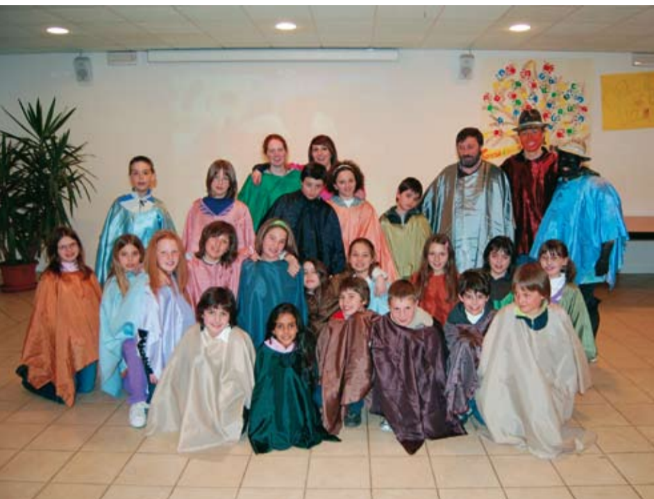
Il gruppo dei piccoli ad Oratoriano

all'oratorio sotto la guida di un folto gruppo di animatori. Gruppi di teatro, viaggio nel tempo e nello spazio, storie da raccontare, riflessioni di vivere, questi gli argomenti delle serate, che iniziano subito dopo messa per concludersi ad ora non troppo tarda, vista la giovane età dei partecipanti (dalla 4° elementare alla 3° media). Il prossimo incontro, da vivere nell'arco di 2 giorni, si svolgerà tra sabato 18 e domenica 19 aprile, con permanenza notturna presso le sale dell'oratorio (indispensabili materassini e sacco a pelo!). In maggio (sabato 16 o domenica 17) è previsto un incontro congiunto con i ragazzi dell'oratorio di Strigno, per trascorrere in amicizia una giornata all'aria aperta fra giochi e attività di animazione.