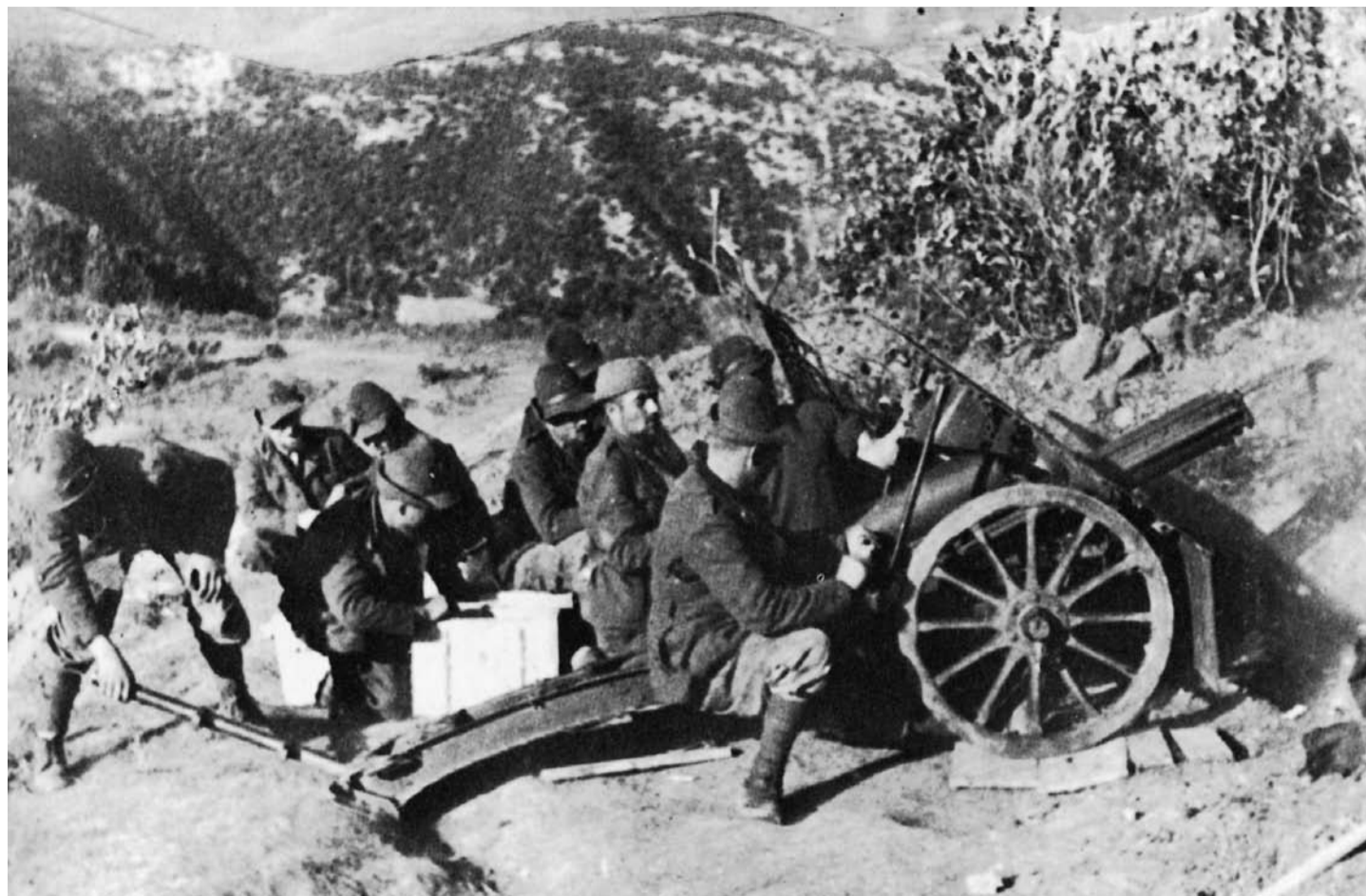
Il cannone 75-13 utilizzato dall'artiglieria alpina in Montenegro

i forestali di Velike Lasce sembravano trovarsi in un'oasi felice.