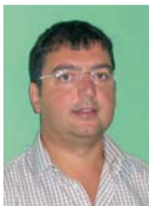
Vincenzo M. Sglavo, sindaco di Roncegno Terme

rifiuti non inquinanti (edili e industriali) per una durata di 18 anni (fino al 31.12.2006) per circa 40 metri fino al raggiungimento della quota di 470 metri slm.