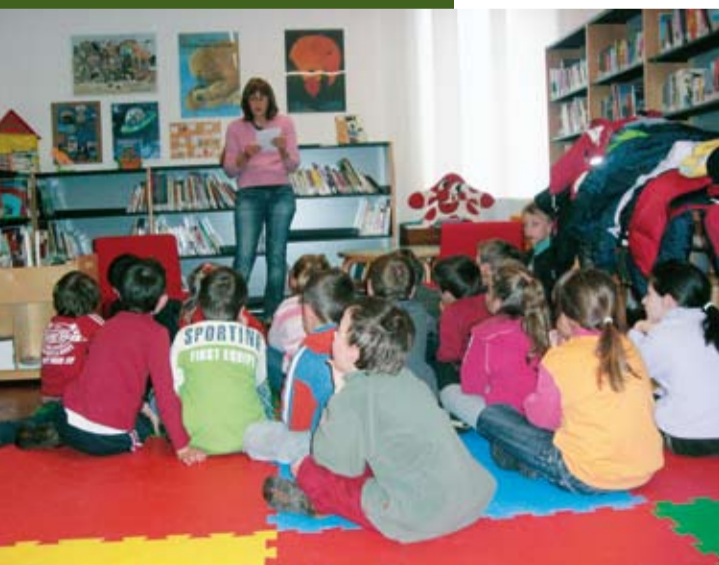
Letture in biblioteca