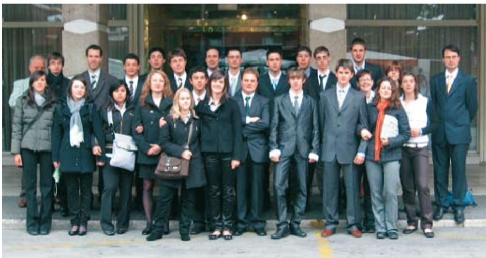
I partecipanti alla trasferta di Roma nell'ambito del progetto "Viaggio nelle Istituzioni"