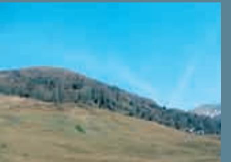
In alto, pascoli sul monte Fravort. Storicamente e paesaggisticamente importanti, da mantenere e migliorare.

La proprietà è divisa in 4 classi economiche a seconda che i territori siano occupati da fustaie, boschi cedui, boschi a funzione produttiva e protettiva. Nella tabella a fianco vengono riportate le superfici per classe economica, la superficie totale, il volume delle piante oltre i 17,5 cm di diametro,