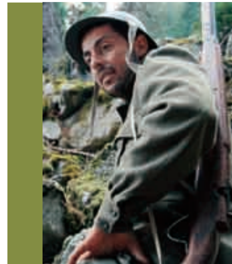
Grande soddisfazione per i giovani protagonisti de "La guerra di Piero"