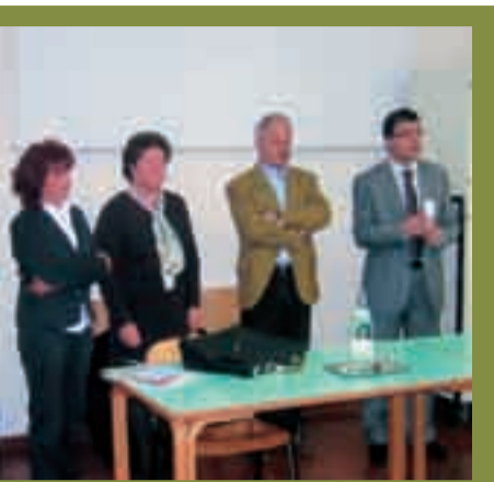
La presentazione dei corsi UTETD

sionario di Roncegno Terme, che si è fatto promotore dell'iniziativa, a gennaio è iniziato, presso l'Oratorio Parrocchiale, il corso di ricamo con la tecnica ad ago che prende il nome da un fiordo norvegese, Hardanger , dove si trova un museo dedicato a questo tipo di ricamo.