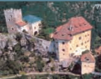
Vedute di Castel Juval e di Castel Coira

Tra le attività utili al nostro benessere psico-fisico è giusto citare anche il corso di ginnastica per anziani che si svolge da novembre 2007 presso la palestra delle scuole elementari per