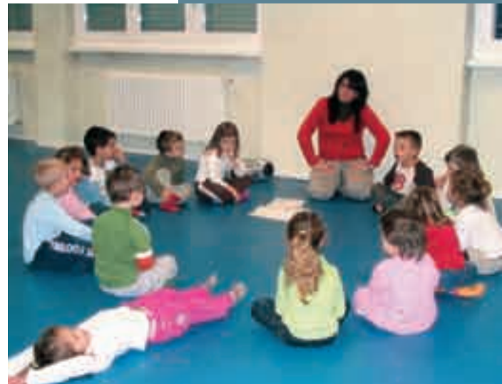
Corsi di ginnastica e teatro per i più piccoli.