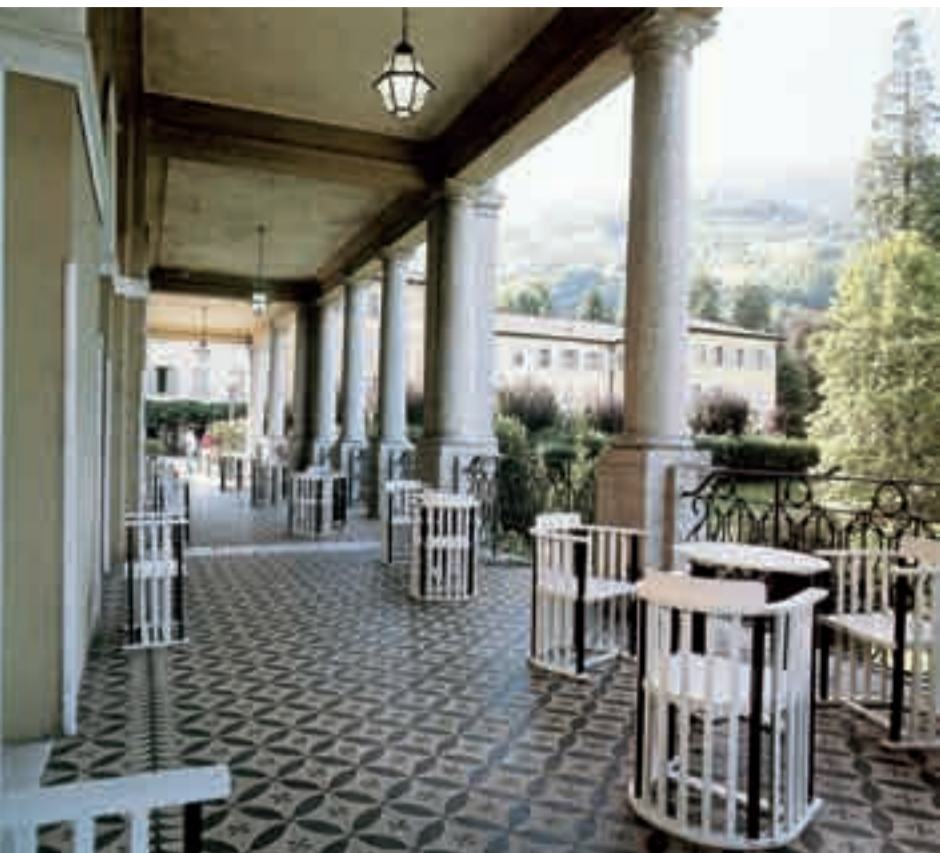
La terrazza del Palace Hotel.

resoconto contabile per quanto riguarda le spese ed i servi usufruiti dagli ospiti. A Roncegno invece trovai ancora il main courant , il giornale contabile dei clienti, dove andavano annotate consumazioni, bevande, spese di facchinaggio. Tutto a mano e a fine giornata i conti dovevano tornare fino all'ultima lira: la somma delle cifre annotate a penna nelle righe doveva corrispondere alla somma delle cifre se-