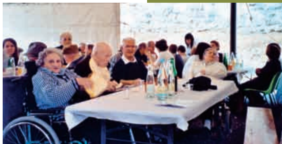
Momento di festa, con i volontari, alla Casa di riposo.

Come tutti i fine d'anno in occasione delle festività natalizie abbiamo ricevu-