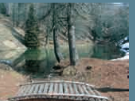
Il laghetto delle Prese. Utile una valorizzazione dell'area di grande interesse turistico-ricreativo.