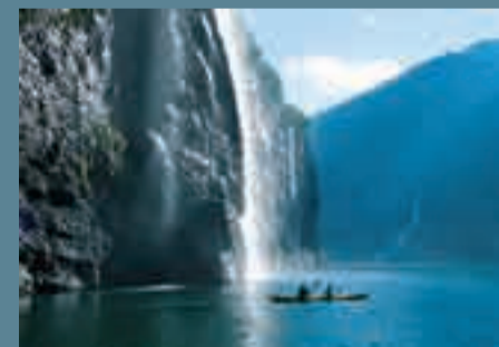
Suggestioni dalle "Terre del Nord" nelle immagini di Adriana e Marco Ondertoller.