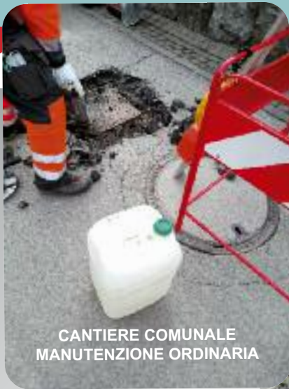
CANTIERE COMUNALE MANUTENZIONE ORDINARIA