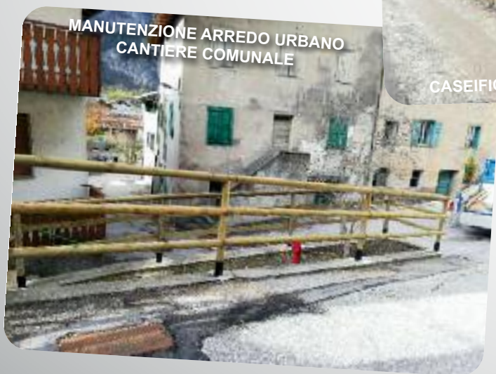
MANUTENZIONE ARREDO URBANO CANTIERE COMUNALE