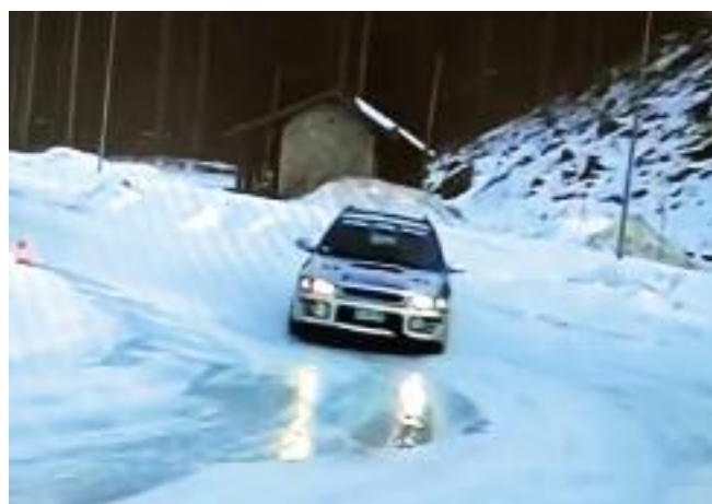
Accademy 4x4 con Gaia per il Dis-ABILITY RAID