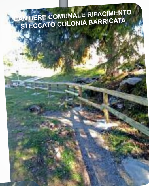
CANTIERE COMUNALE RIFACIMENTO STECCATO COLONIA BARRICATA