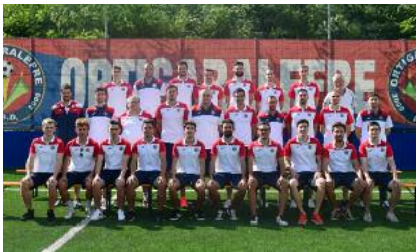
Prima Squadra Campionato di Prima Categoria 2022-2023