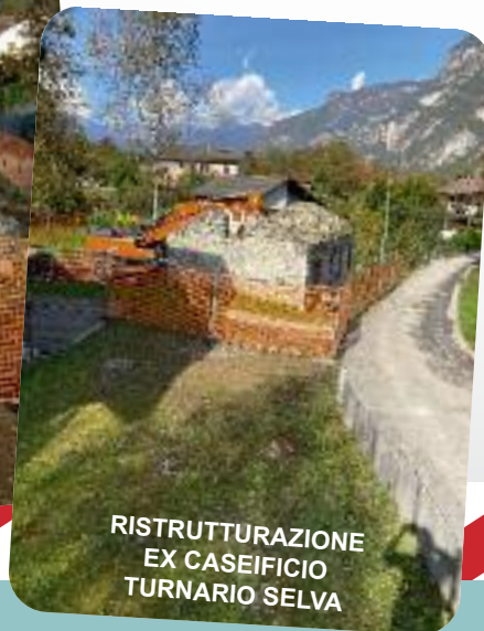
RISTRUTTURAZIONE EX CASEIFICIO TURNARIO SELVA