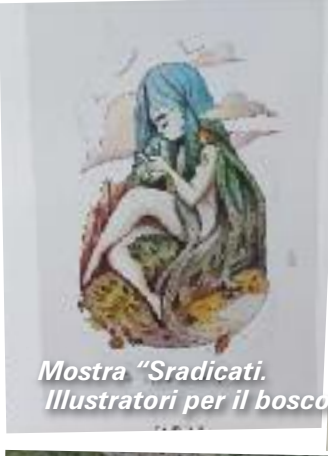
Mostra "Sradicati. Illustratori per il bosco"