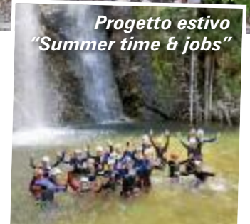
Progetto estivo "Summer time & jobs"