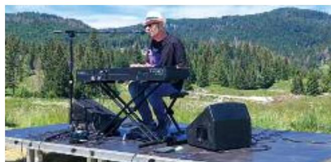
Manifestazione "Lagorai d'Incanto 2022" con Francesco Baccini