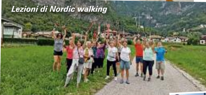
Lezioni di Nordic walking