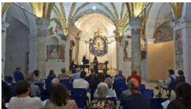
Concerto "Tra sacro e profano"

Un progetto che è stato per noi importante è "Cisto? Affare fatica", finanziato dal Piano Giovani di Zona della Valsugana e Tesino e realizzato da Cooperativa Progetto 92 e Comune di Grigno. Un gruppo di 21 ragazzi del nostro paese si è dedicato alla cura del bene comune nel mese di agosto,