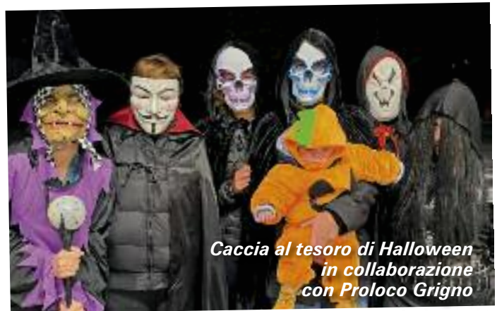
Caccia al tesoro di Halloween in collaborazione con Proloco Grigno