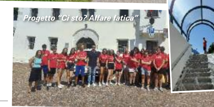
Progetto "Ci sto? Affare fatica"