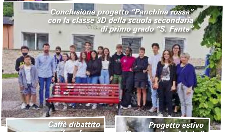
Conclusione progetto "Panchina rossa" con la classe 3D della scuola secondaria di primo grado "S. Fante"