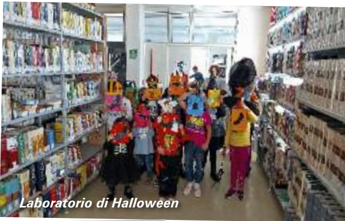
Laboratorio di Halloween