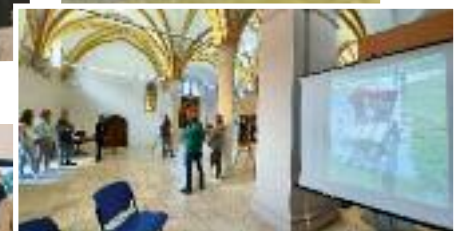
Mostra fotografica relativa al progetto "Ci sto? Affare fatica" in collaborazione con Piano Giovani di Zona, Comunità Valsugana e Tesino e Cooperativa Progetto 92