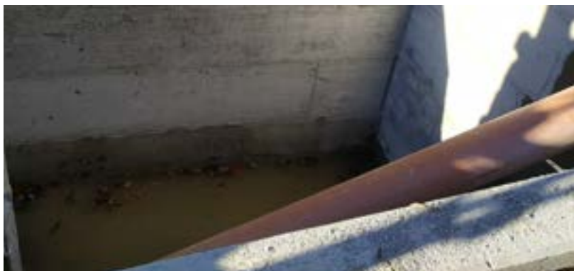
Vasca disabbiatrice ai Salti

comuni coinvolti) che riguarda la pulizia delle strade forestali e relative canalette delle zone di montagna. La terza parte del progetto prevede il supporto di una nostra censita per i servizi di custodia, vigilanza e pulizia degli spazi ed edifici di proprietà comunale e la collaborazione con la biblioteca. Come di consueto, il Comune ha acquistato i fiori per l'abbellimento del paese, che sono stati dislocati lungo le vie dalla Pro Loco, che colgo l'occasione di ringraziare. Vi porto a conoscenza che in questi mesi tramite concorso pubblico verrà assunto un terzo operaio comunale, cosa che ho incentivato personalmente in quanto ritengo che sia diventato indispensabile per far fronte a tutti gli interventi sul patrimonio comunale. Concludo lo spazio a me riservato augurando a tutti voi di trascorrere una buona estate!