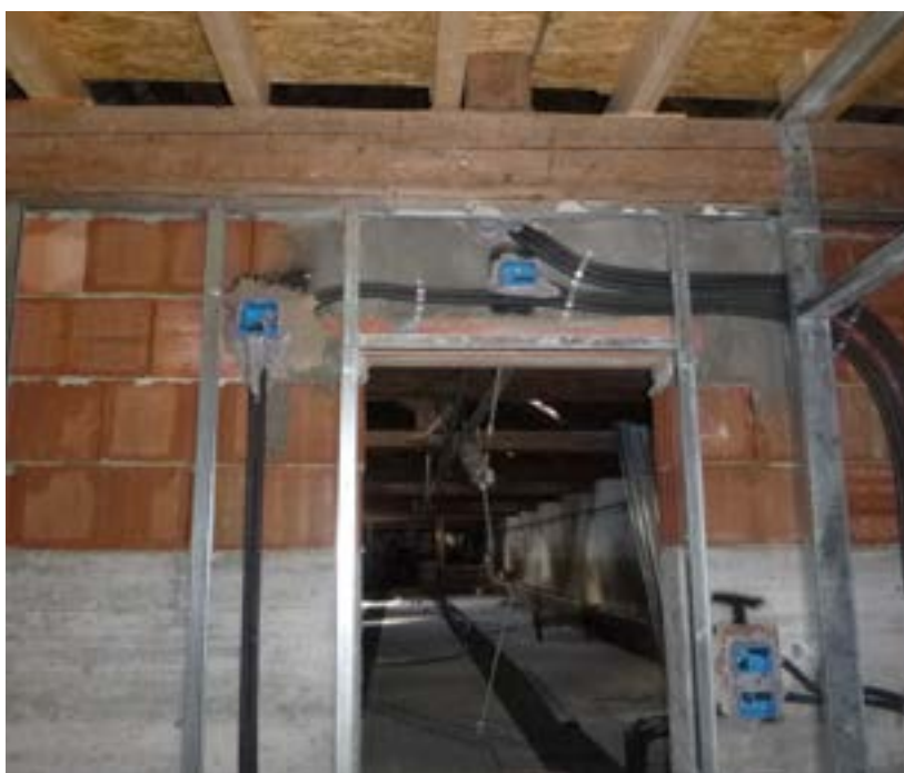
Manutenzione stalloni di Valsolero