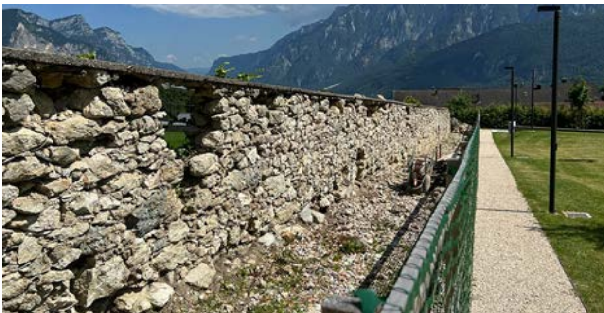
Muratura ad est del parco Steinmayr