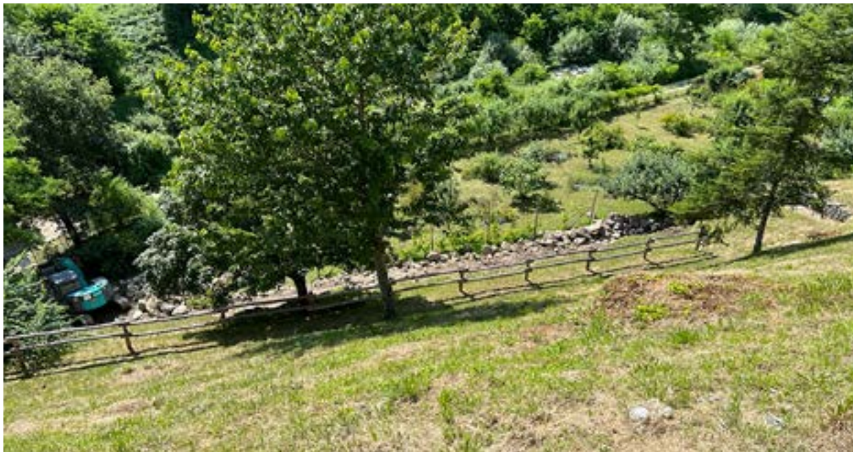
Messa in sicurezza muro Parco Zejati