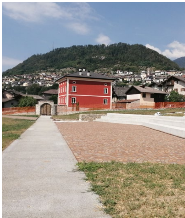
Lavori al Parco Steinmayr