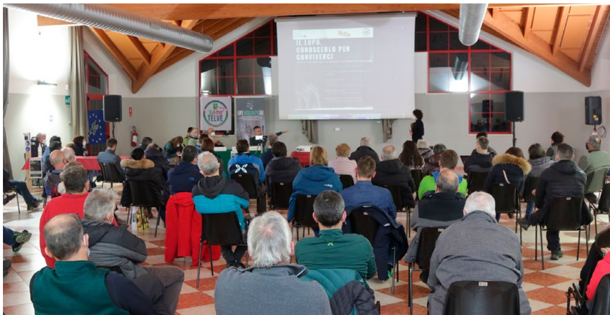
Un momento della serata Il lupo, conoscerlo per conviverci

La nostra interrogazione ha perlomeno portato l'amministrazione ad attivarsi ma, ci è stato risposto, "l'unico strumento che