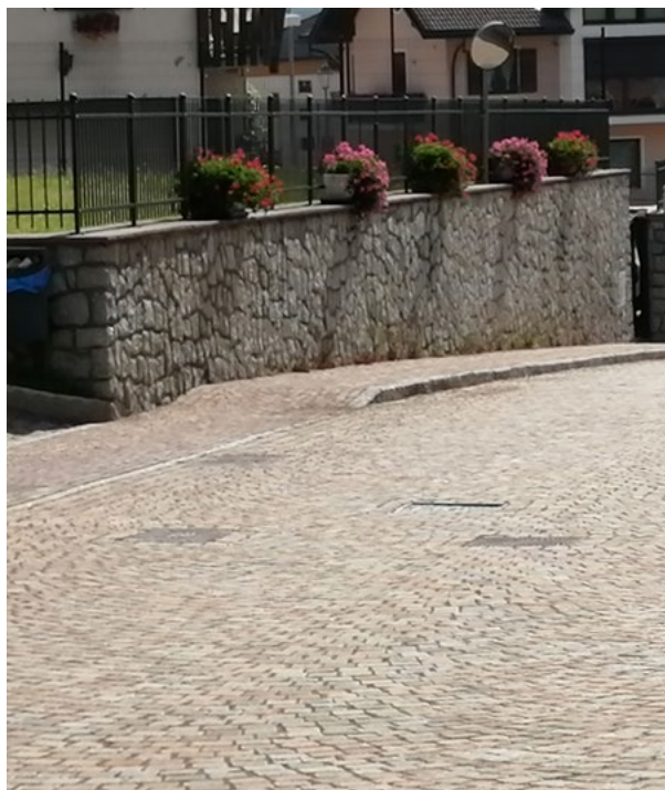
Rifacimento pavimentazione di via Canonica

Sono stati inoltre affidati gli incarichi di progettazione per la riqualificazione e riorganizzazione urbana di Via Fabbri e per il recupero del barco esistente di Malga Valsolero di Sopra. È invece in corso di approvazione il progetto di consolidamento e restauro della muratura che delimita il lato est del parco Steinmayr, con contestuale apertura di un varco per il passaggio pedonale nell'estremità sud e che permetterà di completare i lavori relativi al parco urbano.