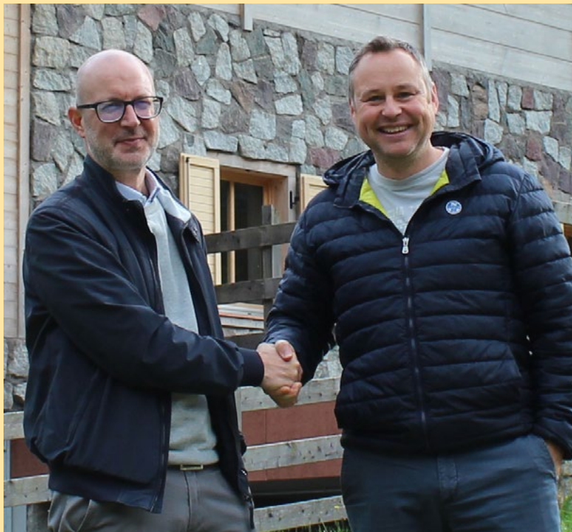
Ideale passaggio di consegne tra neo Presidente e ex Presidente

Concludo come di consueto riportando i dati della produzione in kW/h dei nostri impianti fino al 31 maggio 2022.