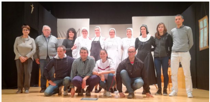
La filodrammatica ieri e oggi