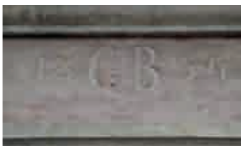
PIANO TERRA QO Iscrizione su architrave in via Battisti

L’edificio si trova nel centro storico di Pieve Tesino, si addossa e fa parte - con casa Tessaro - di un comparto edilizio che si affaccia su due fronti: a nord con la sua corte su via A. De Gasperi mentre la facciata principale è quella rivolta a sud, con l’entrata alla casa padronale, posta a piano primo, marcata dal portale su Via C. Battisti. Lo stato di conservazione delle strutture è pesante, essendo in stato d’abbandono da parecchi lustri, la mancanza di manutenzione del tetto sia nella parte centrale che nell’ala est ha compromesso i solai definitivamente e nemmeno il tardivo intervento sulle falde ovest ha evitato la marcescenza dei sottostanti solai lignei. L’edificio rientra largamente nella tradizione costruttiva alpina dell’area tesina: piano inferiore con cantina e stalla ad avvolto, cucina secondaria e stube, piano nobile sopralzato, locali comunicanti in linea dotati di stufe a ole, cucina con focolare e lavelli in pietra, ambienti vari di deposito a piano superiore accessibile da nord e sottotetto aperto e ventilato per l’asciugatura dei raccolti da stagionare. Un unico, capace “bus del fen”, caricabile dai due livelli superiori e comunicante con la mangiatoia della stalla.