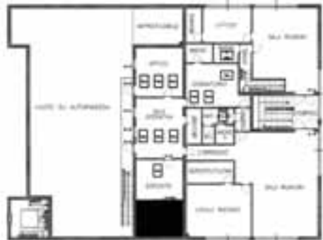
Pianta primo piano