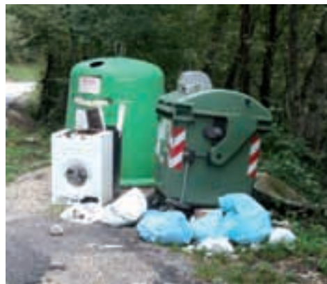
Conferimento anonimo di rifiuti

A causa di questi comportamenti incivili, i concittadini sono stati tenuti a pagare una bella cifra per il servizio di pulizia e smaltimento dei rifiuti anonimamente e scorrettamente depositati. Il Comune infatti ha dovuto saldare, al gestore del servizio – in questo caso il Comprensorio del C3 – la somma di ben 7.746,18 euro per l'anno 2007. Inutile considerare come questo denaro sarebbe stato più utile investirlo a favore della nostra comunità, come ad esempio assegnandolo alle nostre associazioni.