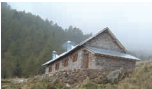
Malga Quarazza prima e dopo