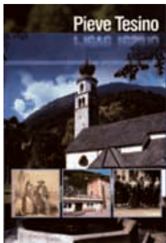
Guida di Pieve