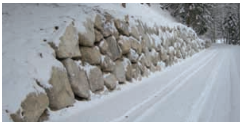
Scogliera strada Coston