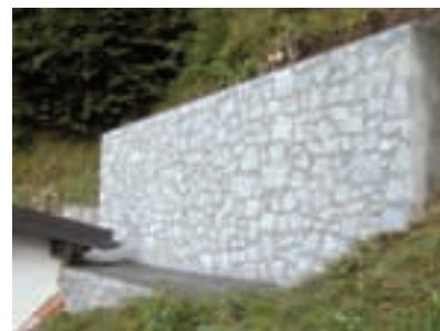
Salita Silana prima e dopo