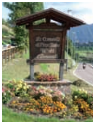
Ingresso al paese

Da sempre le Amministrazioni sono impegnate, grazie anche all'apporto gratuito di molte persone e delle associazioni, presentare al meglio il paese ed il suo territorio. Purtroppo accade spesso che per colpa di alcune persone l'immagine che Pieve dà ai concittadini ed ai turisti venga meno. Le immagini che pubblichiamo sono particolarmente eloquenti.