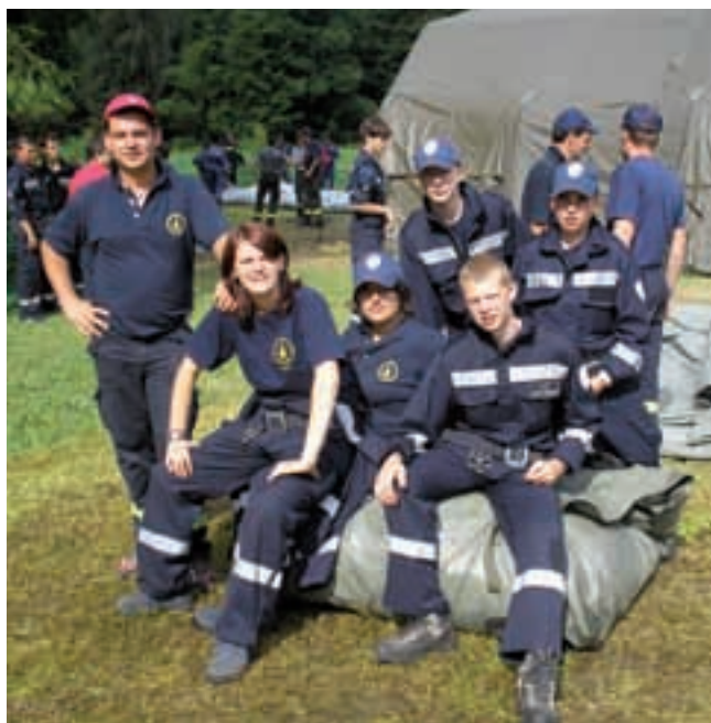
Il gruppo Allievi di Pieve Tesino

Lo scopo era trascorrere quattro giorni indimenticabili nella natura alla presenza di altri 86 Corpi di tutto il Trentino: nel complesso 712 allievi e 200 istruttori ed accompagnatori. Per l'intera durata del convegno, noi giovani dovevamo riflettere sull'abuso di alcol e droghe. Siamo anche stati sensibilizzati sulla raccolta differenziata dei rifiuti. Ma a parte questi momenti seri, istruttivi e impegnativi, ci sono state anche ore di svago: come visite guidate, pastasciutta e cene insieme per festeggiare e darci una gratificazione dopo un duro lavoro (manovre, collaborazione con gli effettivi...). Noi siamo felici di far parte dei Vigili del Fuoco Volontari di Pieve Tesino e speriamo di portare avanti nei migliore dei modi questo percorso che abbiamo intrapreso.