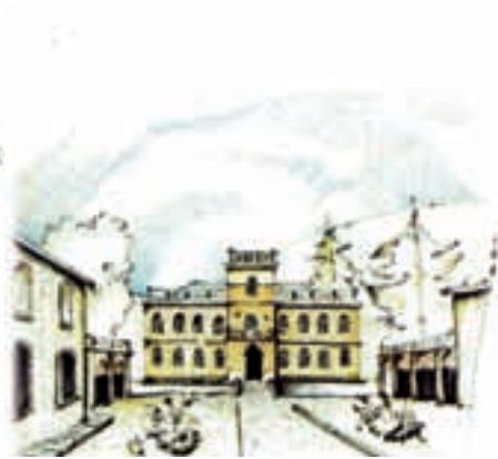
Scorci di Pieve