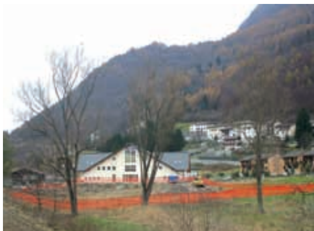
Il cantiere in località Frati