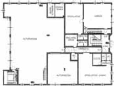
Pianta piano terra

e Bruno Battisti di Telve. Il cantiere è già transennato e oltre ai lavori di scavo per la bonifica del terreno e la realizzazione del sottofondo drenante verrà costruito l'edificio e un tetto in legno di prima scelta, con un manto di copertura in tegole canadesi colore grigio. I locali autorimessa, officina e deposito saranno dotati di un pavimento del tipo industriale, tutti gli altri locali saranno pavimentati in piastrelle di gress ceramico; oltre ai serramenti interni ed esterni è prevista l'isolazione termo-acustica, l'impiantistica termo-idrico-sanitaria ed elettrica, nel rispetto delle normative vigenti e secondo progetto (legge 10/91 e legge 46/90), un piazzale e l'allacciamento alle reti tecnologiche (acque nere, acquedotto, acque bianche). E' prevista anche la realizzazione di un castello di manovra in cemento armato a vista sui lati nord, sud, ovest ed est. La spesa complessiva prevista per la realizzazione dell'opera è di 1.651.814 euro: quasi 1.050.000 euro per lavori di opere edili, quasi 193 mila euro per le opere impiantistiche e 37.275,13 per oneri della sicurezza. Tra le somme a disposizione, 10 mila euro sono le spese per le indagini geognostiche, 35 mila euro per l'acquisto dei terreni dai privati e dalla locale Cassa Rurale e 15 mila euro per l'allacciamento alle reti tecnologiche. L'appalto dell'opera è stato aggiudicato alla ditta Pasquazzo spa di Ivano Fracena.