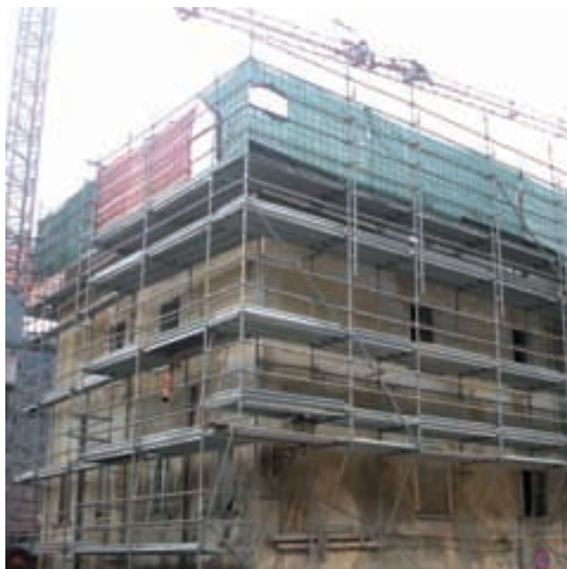
Il cantiere in via Brigata Abruzzi

Sono iniziati i lavori per la realizzazione dell'ostello per la Gioventù. Da alcuni mesi la Costruzioni Melchiori srl ha aperto il cantiere di lavoro per il risanamento della p.ed. 143/1, in pieno centro storico. Sull'importo a base di gara di 832.317,50 euro, di cui 26.000 per oneri di sicurezza, è stato applicato un ribasso del 16,115% per un prezzo di aggiudicazione complessivo di 702.379,43 euro. Il progetto è stato predisposto dallo Studio B Due di Borgo Valsugana ed il suo contenuto è già stato presentato in occasione del numero del bollettino comunale pubblicato a luglio. In questa occasione l'Amministrazione intende portare a conoscenza dei cittadini le planimetrie e gli spazi che saranno ricavati all'interno dell'edificio. Un'occasione per conoscere da vicino le caratteristiche di questa nuova struttura che, una volta ultimata, permetterà alla comunità di Pieve Tesino di avere a disposizione un servizio aperto ai tanti giovani e non che durante tutto l'anno frequentano la zona. Il nuovo ostello della gioventù potrebbe entrare in funzione entro la fine dell'anno prossimo.