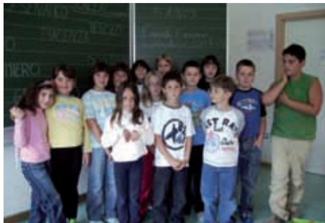
Le classi III e IV il primo giorno di scuola

Prevedono anche attività connesse all'educazione e alla convivenza civile: educazione alimentare, ambientale, affettiva, alla sicurezza, alla cittadinanza, alla conoscenza delle lingue straniere, perché i bambini crescano sempre più consapevoli di se stessi e del mondo che li circonda, aperti al confronto, autonomi e capaci di assumersi responsabilità proporzionate alla loro giovane età. Insegnanti specializzate guidano i bambini nella loro crescita spirituale con l'insegnamento della religione cattolica, ma è anche garantito il diritto di scelta delle famiglie, con la possibilità di non avvalersene. Nell'ambito dell'orario scolastico vengono proposte anche attività creative e sportive che stimolino, divertano ed arricchiscano i bambini. Questo lo scopo di tante iniziative del nostro plesso: la Festa delle rape con il mercatino di solidarietà, che anche quest'anno ha visto un'ottima partecipazio-