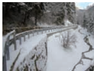
Strada Coston prima e dopo