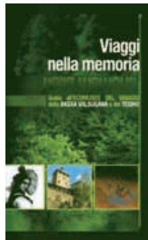
Guida dell'Ecomuseo del viaggio