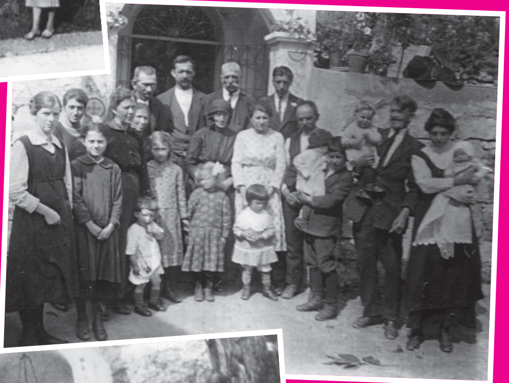
Capitello ai Pellegrini, anni Venti