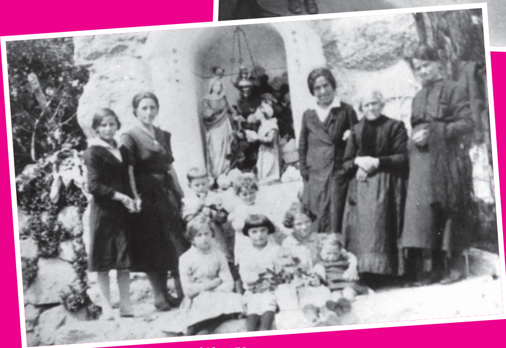
L'inaugurazione del capitello del Murazo