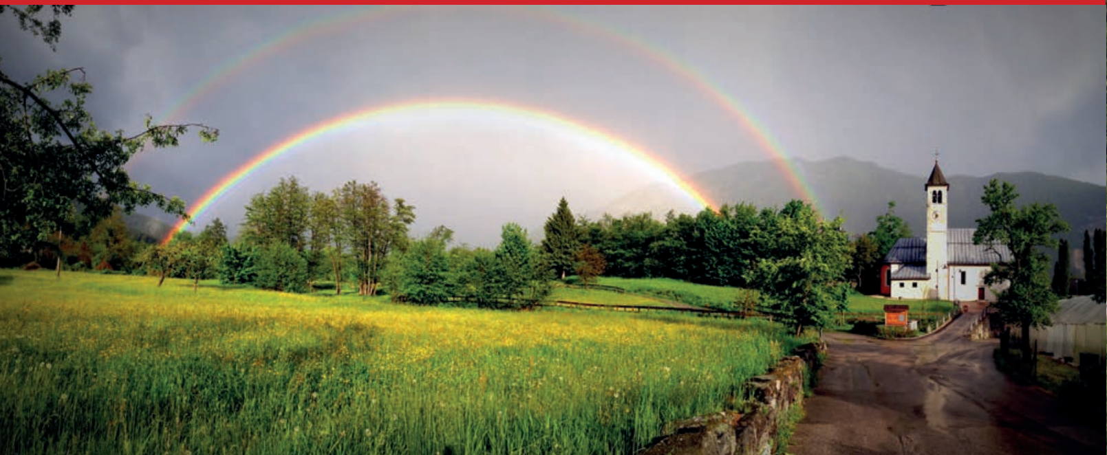
Il doppio arcobaleno sullo sfondo della chiesa di San Biagio