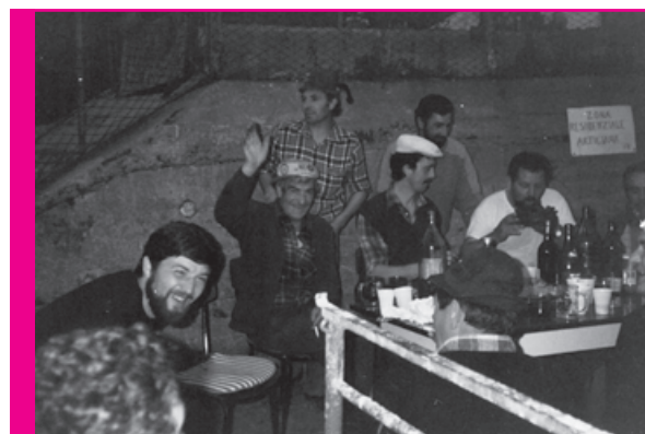
La prima edizione della festa il 1° maggio 1987