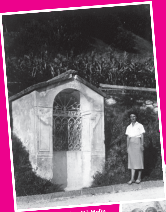
Capitello al Ponte in località Molin

Come eravamo...