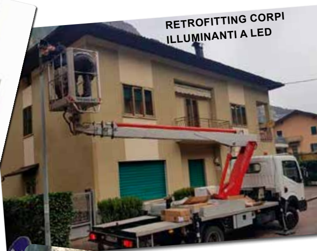
RETROFITTING CORPI ILLUMINANTI A LED