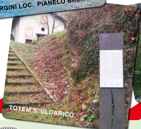
TOTEM S. ULGARICO