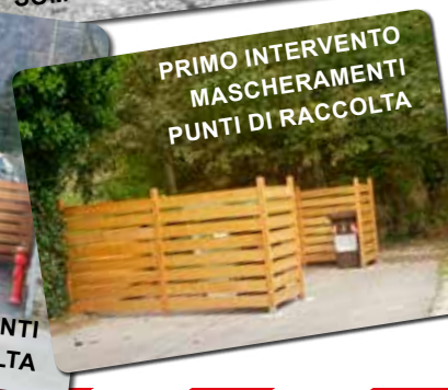
PRIMO INTERVENTO MASCHERAMENTI PUNTI DI RACCOLTA

Autorizzazione Tribunale Trento n. 497 del 12/07/1986