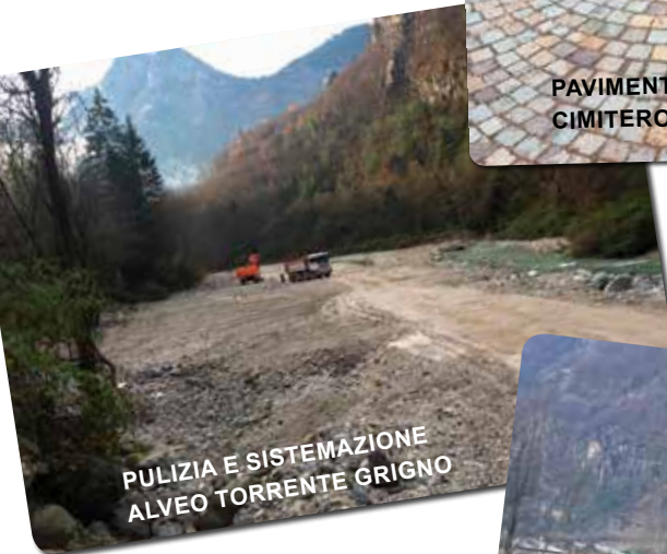
PULIZIA E SISTEMAZIONE ALVEO TORRENTE GRIGNO