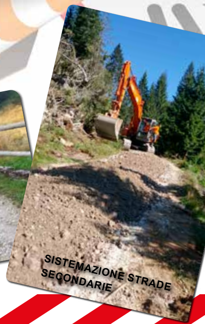
SISTEMAZIONE STRADE SECONDARIE