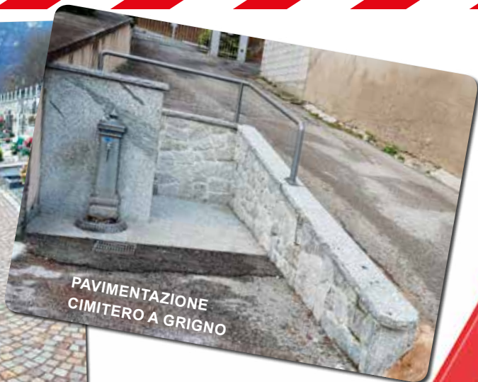
PAVIMENTAZIONE CIMITERO A GRIGNO