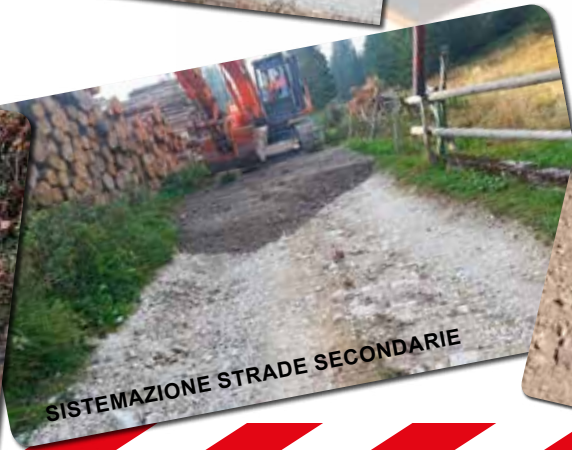
SISTEMAZIONE STRADE SECONDARIE