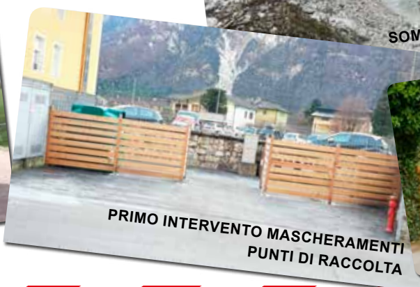
PRIMO INTERVENTO MASCHERAMENTI PUNTI DI RACCOLTA