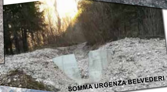
SOMMA URGENZA BELVEDERI