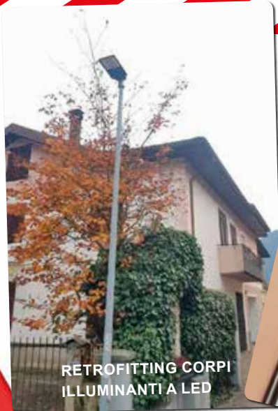
RETROFITTING CORPI ILLUMINANTI A LED