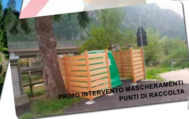
PRIMO INTERVENTO MASCHERAMENTI PUNTI DI RACCOLTA