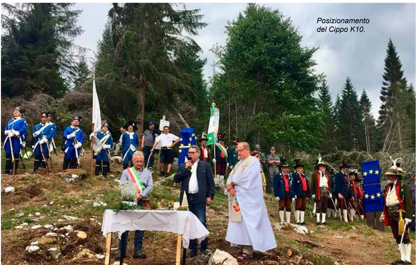
Posizionamento del Cippo K10.