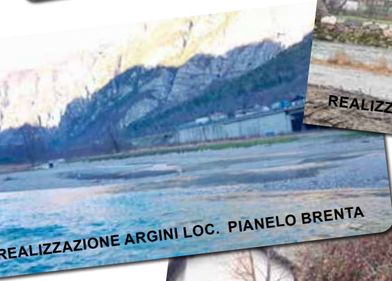
REALIZZAZIONE ARGINI LOC. PIANELO BRENTA