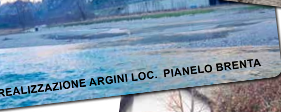
REALIZZAZIONE ARGINI LOC. PIANELO BRENTA