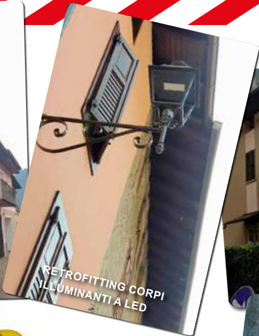
RETROFITTING CORPI ILLUMINANTI A LED