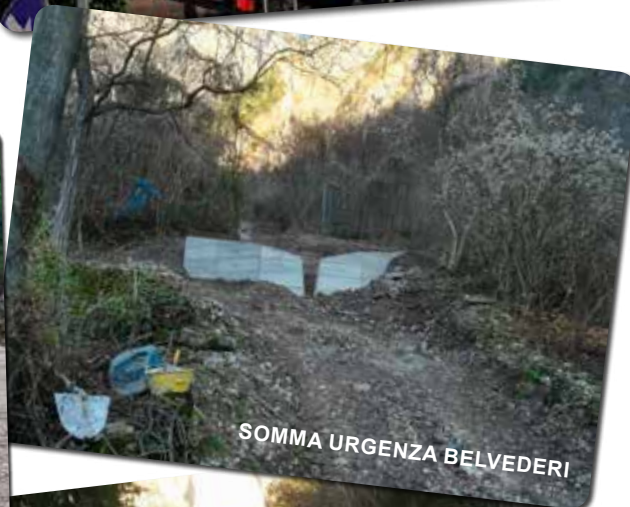
SOMMA URGENZA BELVEDERI