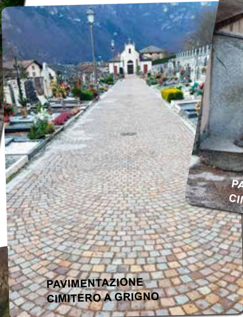
PAVIMENTAZIONE CIMITERO A GRIGNO