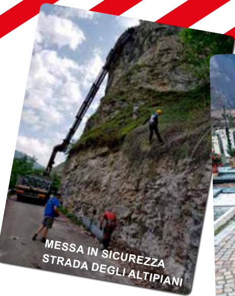
MESSA IN SICUREZZA STRADA DEGLI ALTIPIANI