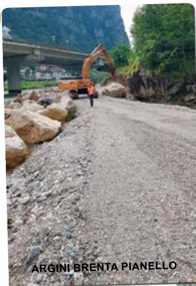
ARGINI BRENTA PIANELLO