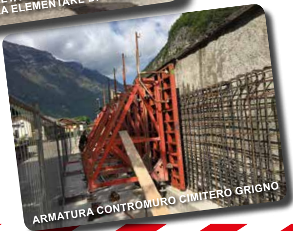
ARMATURA CONTROMURO CIMITERO GRIGNO