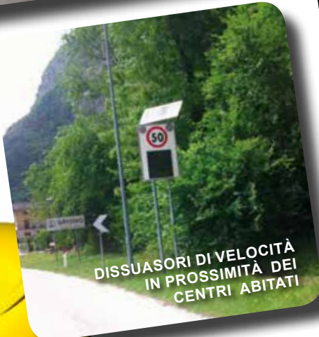
DISSUASORI DI VELOCITÀ IN PROSSIMITÀ DEI CENTRI ABITATI