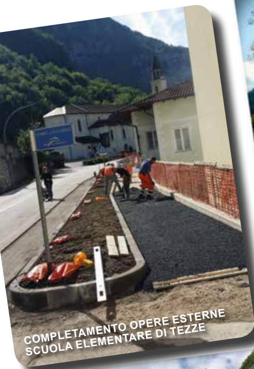
COMPLETAMENTO OPERE ESTERNE SCUOLA ELEMENTARE DI TEZZE