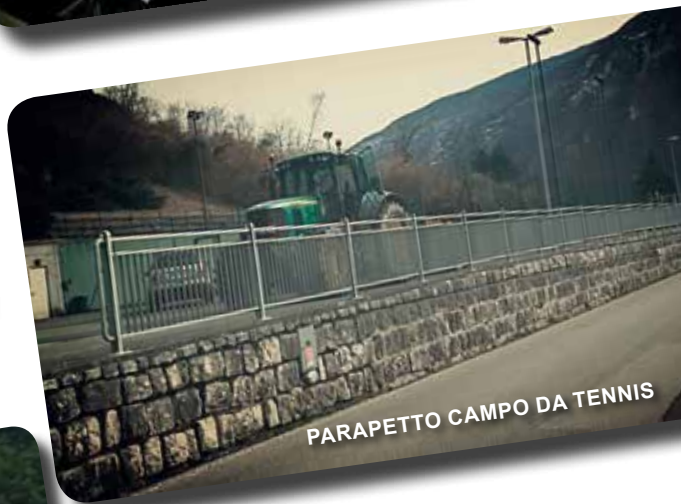
PARAPETTO CAMPO DA TENNIS