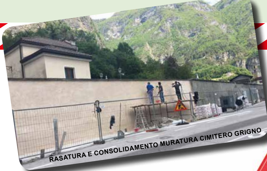
RASATURA E CONSOLIDAMENTO MURATURA CIMITERO GRIGNO