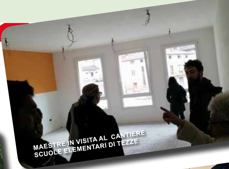
MAESTRE IN VISITA AL CANTIERE SCUOLE ELEMENTARI DI TEZZE