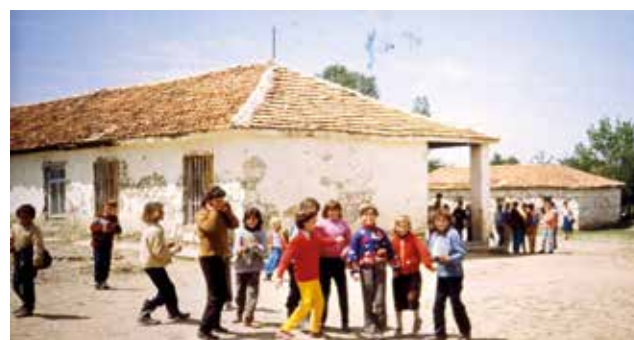
Scuole elementari in Albania