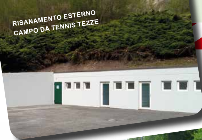
RISANAMENTO ESTERNO CAMPO DA TENNIS TEZZE