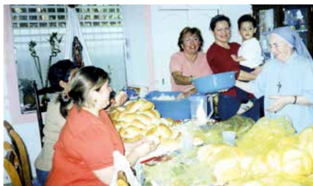
Missione del Messico Laboratorio di cucina

Tanto è stato fatto, anche se negli ultimi anni abbiamo perso vitalità: le veglie missionarie e la collaborazione con altri gruppi missionari si sono diradate e l'attività si è ridotta. Siamo consapevoli delle difficoltà del momento ma preghiamo il Signore perché ci aiuti a continuare. Infine, ringraziamo tutte le persone che in questi 20 anni ci hanno aiutato e hanno creduto in noi.