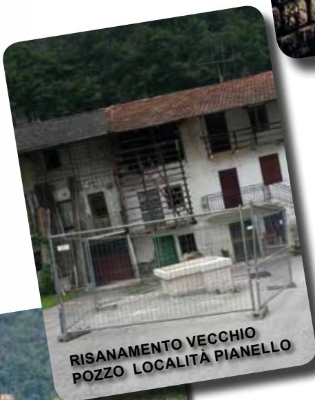
RISANAMENTO VECCHIO POZZO LOCALITÀ PIANELLO