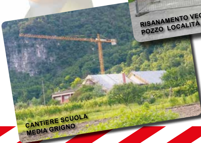
CANTIERE SCUOLA MEDIA GRIGNO