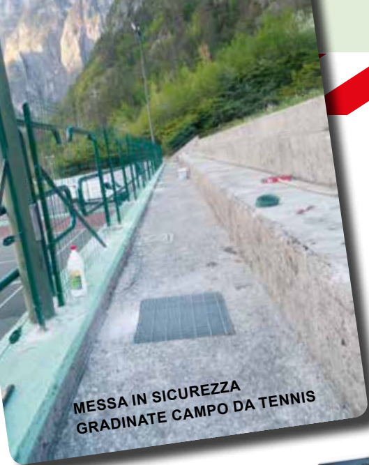
MESSA IN SICUREZZA GRADINATE CAMPO DA TENNIS