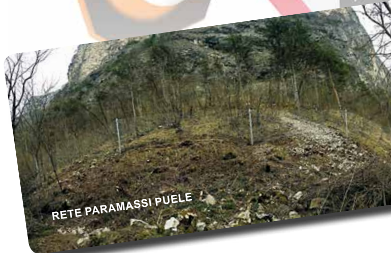
RETE PARAMASSI PUELE