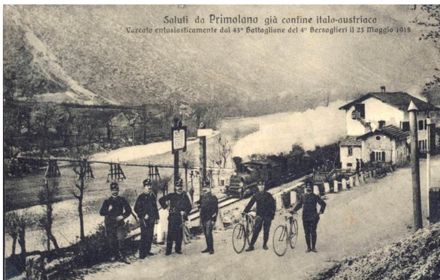
Saluti da Primolano già confine italo-austriaco Varcato entusiasticamente dal 43° Battaglione del 4° Bersaglieri il 23 Maggio 1915