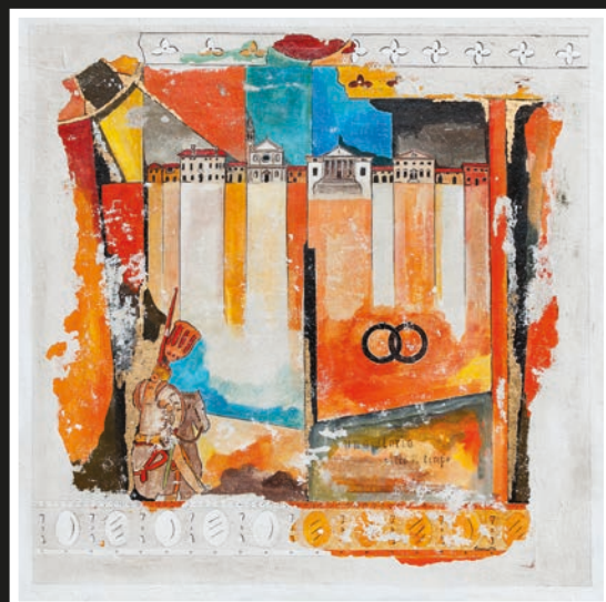
3° premio Una storia antica" di Tristano Casarotto