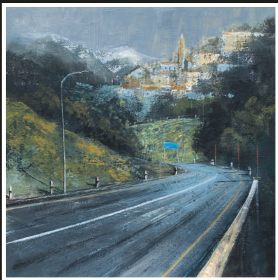
1° premio L'apparizione del paese" di Claudio Pompeo