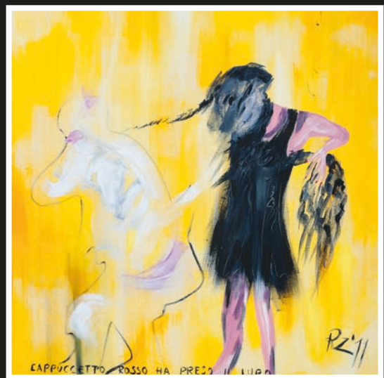
2° premio Cappuccetto rosso ha perso il lupo" Roberta Zadra