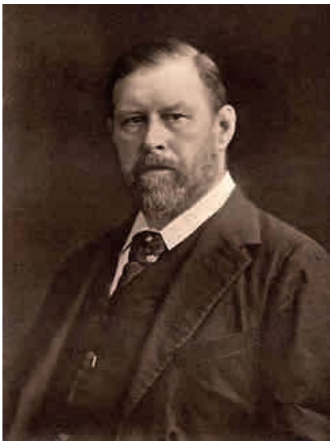
Abraham "Bram" Stoker 8 Novembre 1847 – 20 Aprile 1912

Quest'anno si celebra il centenario della morte di Bram Stoker (1847-1912), il padre di Dracula (Clontarf, Dublino 1847 – Londra 1912).