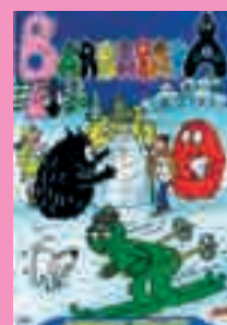
5) Barbapapà sulla neve