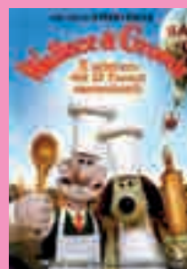
4) Wallace & Gromit: Il mistero dei 12 fornai assassinati .