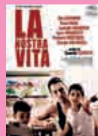
5) La nostra vita [con] Elio Germano ... [et al.]; un film di Daniele Luchetti