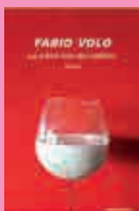
3) Volo Fabio Le prime luci del mattino