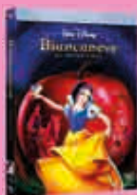
1) Biancaneve e i sette nani