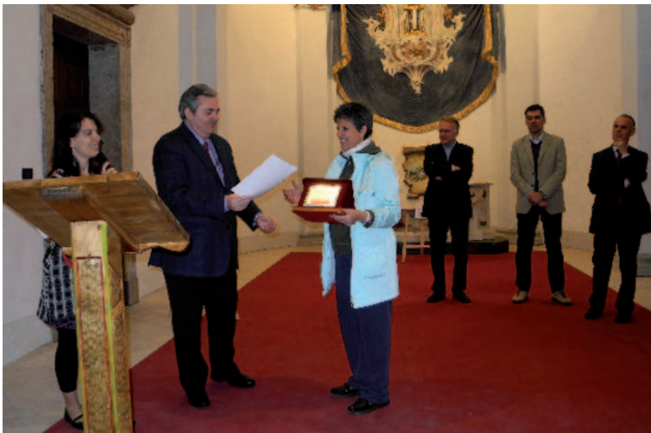
La premiazione del primo classificato