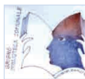
BIBLIOTECA PUBBLICA COMUNALE "ORLANDO GASPERINI" DI GRIGNO