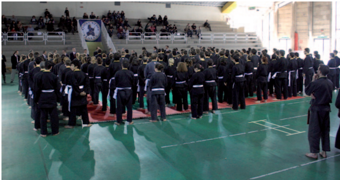
Campionati nazionali Scandicci marzo 2011

Siamo quasi giunti alla fine della stagione sportiva ed è il momento di fare i primi bilanci.