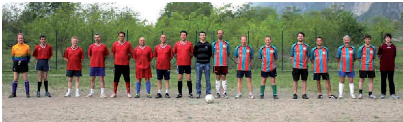
Toteni e Pitochi