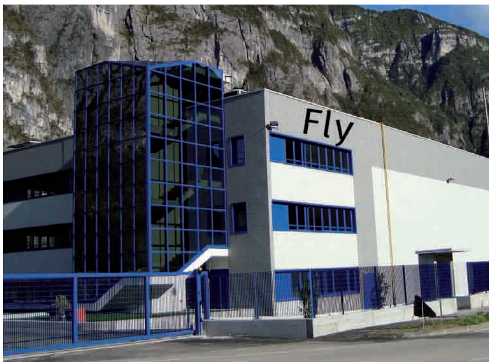
Grigno, lo stabilimento della Fly in zona industriale