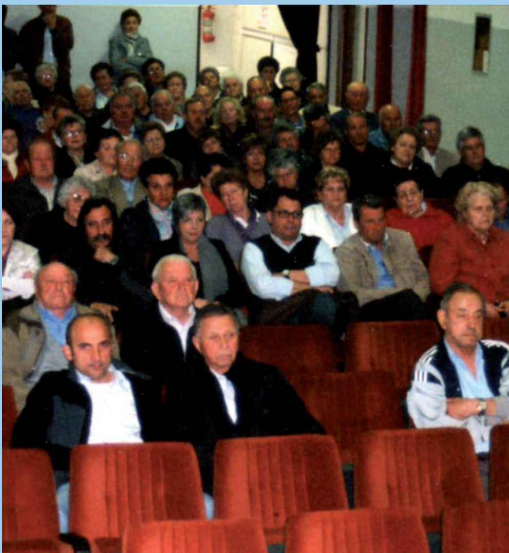
Grigno, soci del Circolo Pensionati Grigno Tezze in assemblea a Tezze