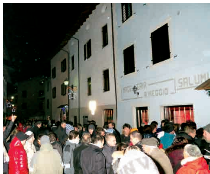
Nadale soto i portegghi

La comunità ha apprezzato questa iniziativa e prometiamo di riproporla anche l'anno prossimo, magari con altre novità.