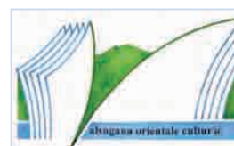
SISTEMA CULTURALE VALSUGANA ORIENTALE