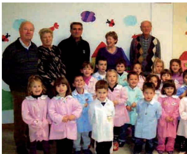
Il laboratorio alla scuola materna con i nonni di Tezze

dal Circolo Pensionati Anziani che ha aiutato i bambini nella costruzione e nell'allestimento degli addobbi per gli alberi di Natale, per la scuola e la piazzetta del paese.