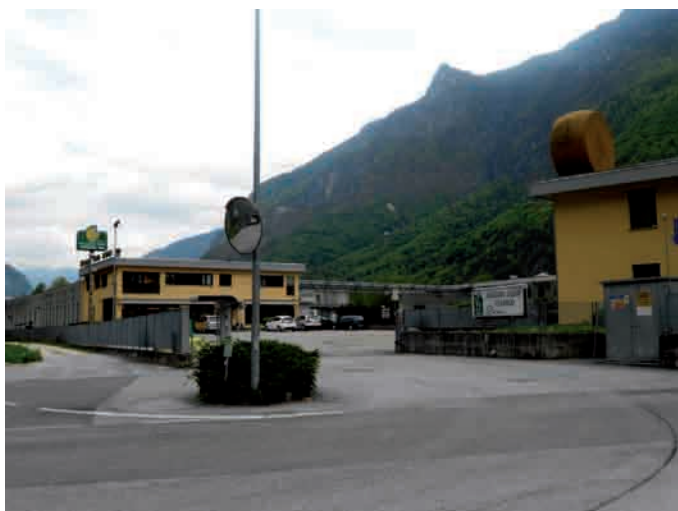
Grigno, la sede della Casearia Monti Trentini