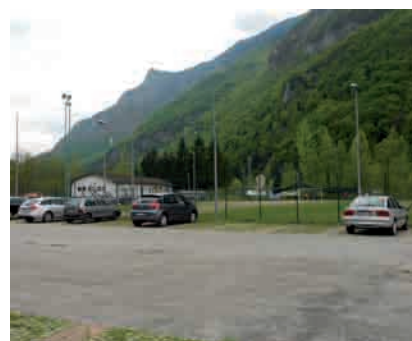
Grigno, veduta del campo sportivo

Il nuovo campo da calcio in erba sintetica sarà di 100 metri di lunghezza e 60 di larghezza. Con il progetto, approvato anche dal consiglio comunale, che prevede l'am-