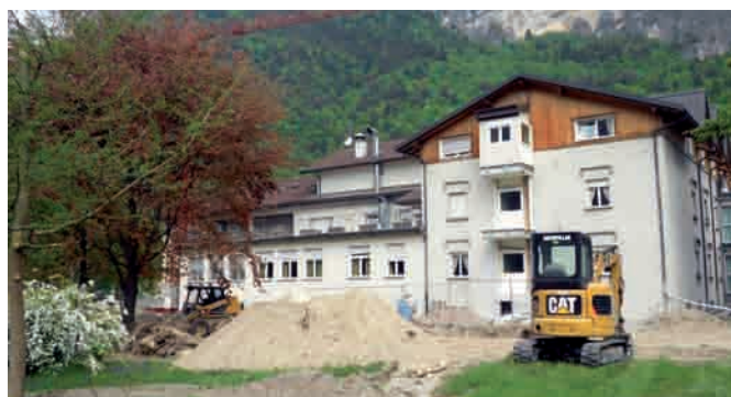
Grigno, i lavori alla casa di riposo