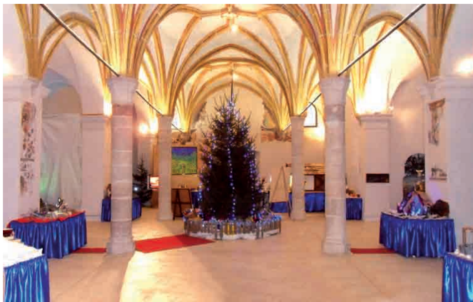
Rassegna di presepi