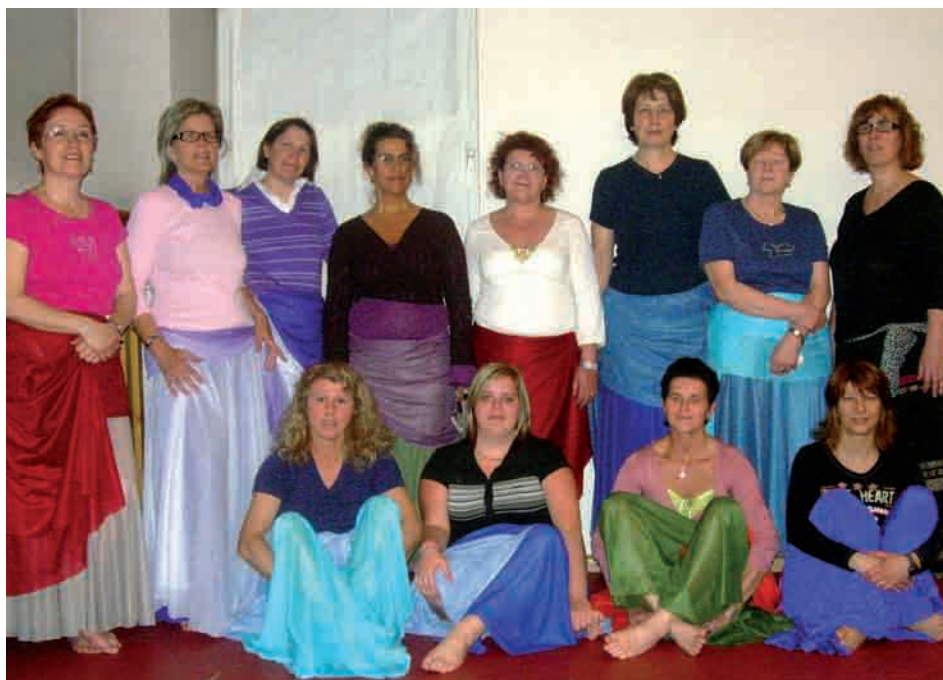
Gruppo di donne al corso di danza orientale

Quest'anno il nostro Gruppo compie 20 anni: è stato un lungo cammino fatto di mostre, serate, gite, corsi e soprattutto relazioni che abbiamo costruito con la comunità. Per festeggiare l'anniversario continueremo a lavorare e come sempre ci rivolgiamo alle donne perché si avvicinino a noi con nuove idee ed iniziative per i prossimi 20 anni! Grazie a tutti.