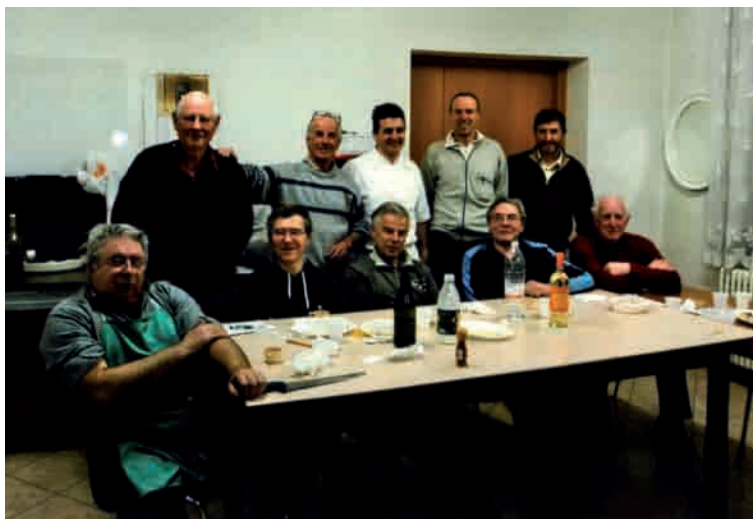
I partecipanti al corso di cucina per uomini della Pro Loco di Tezze

Soddisfatti del corso, ci auguriamo che l'iniziativa si possa ripetere quanto prima.