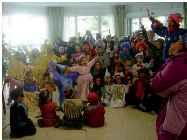
Le maschere di Carnevale in visita