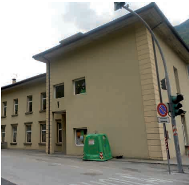
Tezze, le scuole elementari

Nell'ultimo numero del bollettino comunale, il sindaco Leopoldo Fogarotto era stato davvero un buon profeta. "Se non ci saranno intoppi, a settembre 2011 le scuole primarie saranno unite nel plesso di Grigno". Una previsione, la sua, davvero azzeccata. Infatti, in prospettiva dell'avvio dei lavori per la ristrutturazione della scuola elementare di Tezze, con l'anno scolastico 2011-12 tutte le classi della frazioni saranno spostate a Grigno. Una decisione, presa da tempo, confortata anche dalla decisione presa l'11 dicembre dall'ufficio Finanza Locale del Servizio Autonomie Locali della Provincia che ha concesso il finanziamento pari al 90% della spesa. Per mettere a norma l'edificio e dotare la comunità di Tezze di una scuola elementare con spazio e locali idonei, il progetto definitivo, così come approvato il 25 gennaio dalla giunta comunale, prevede una spesa complessiva pari a 3.780.000 euro. E le agevolazioni finanziarie che arriveranno dalla Provincia risultano così suddivise: un contributo in conto capitale di 2.551.500 euro (pari al 75% del contributo concedibile di 3.420.000 euro) ed un contributo annuo costante di 105.905,56 euro per la durata di dieci anni ed applicando un tasso del 4,20%. Per quanto riguarda la mensa, gli alunni usufruiranno degli spazi che saranno ampliati presso l'esistente scuola media di Grigno.