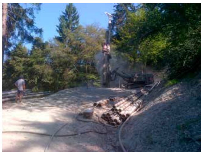
SMOTTAMENTO LOCALITÀ S. MARGHERITA