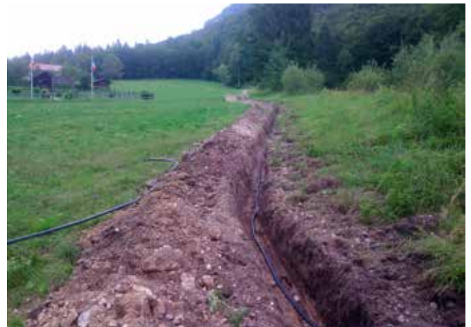
Da parcheggio a casamarket / Prai da Brenta