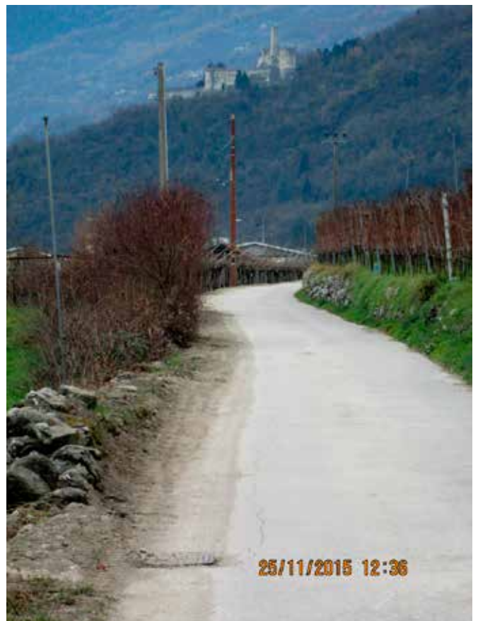
refacimento dell'impianto di illuminazione pubblica, loc. Ceggio.