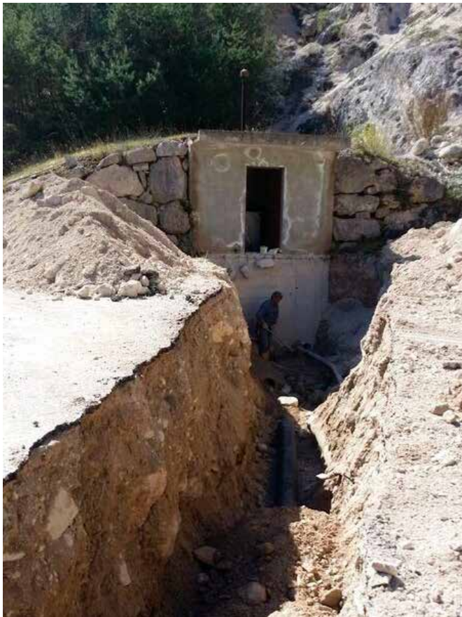
Sistemazione e messa a norma il serbatoio e l'opera di presa dell'acquedotto in loc. Zaccon/ Mesole