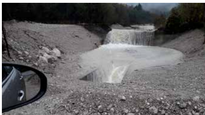
SMOTTAMENTO LOCALITÀ S. MARGHERITA