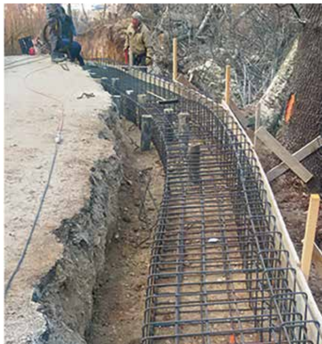
Località Mesole / Val Coalba