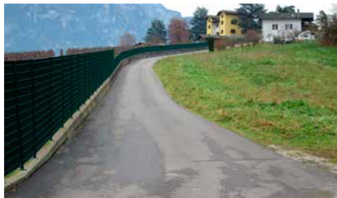
Asfalti STRADA SPAGOLLE