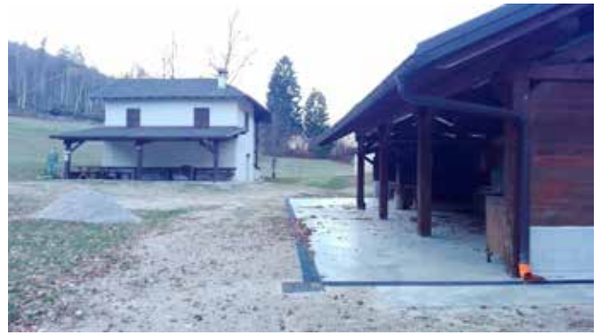
Bonifica prati di civerone