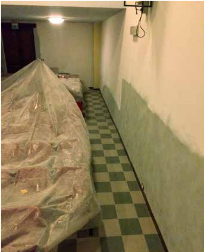
Edificio a servizio associazioni