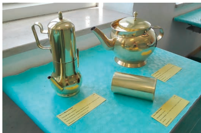
Caffettiera, bollitore e vaso in ottone, ricavati da bossoli di bombe