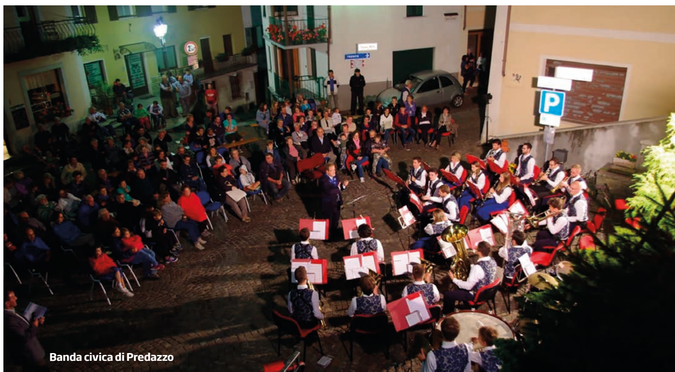
Banda civica di Predazzo

Proprio in val di Sella, all'ombra della cima Dodici, si concluderà il viaggio terreno dello Statista il 19 agosto 1954.