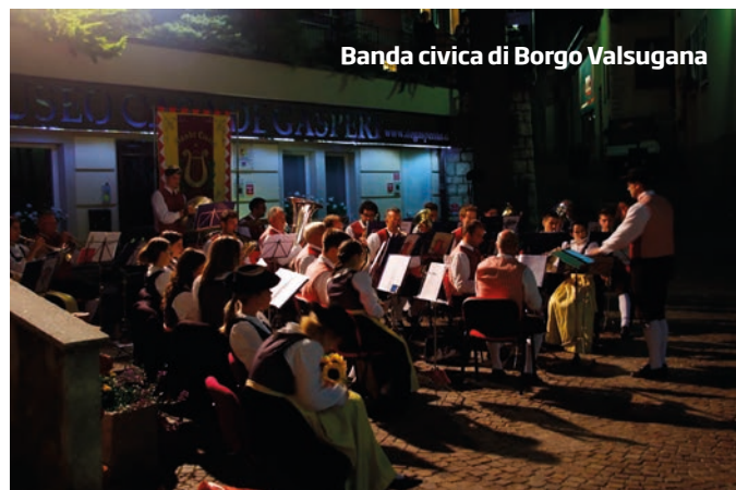
Banda civica di Borgo Valsugana