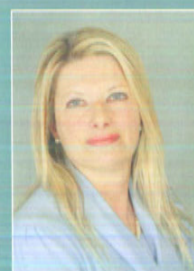
Lionella Denicolò Sindaco

Era la seconda variazione al bilancio 2010. Una manovra, quella approvata all'unanimità in occasione del terzo consiglio comunale di questa legislatura dal sindaco Lionella Denicolò, che servirà per pagare le spese di gestione 2009 della Scuola di Musica di Borgo (4.271,02 euro) ma anche per coprire spese correnti per 48.065,28 euro: tra le voci di spesa 3.900 euro per il mantenimento della registrazione Emas, 5.000 euro per gli uffici comunali, 4.500 euro per luce, riscaldamento e telefono, 2.500 euro per la manutenzione degli immobili, 2.000 euro per il riscaldamento degli appartamenti a casa Tupini, 2.000 euro per contributi alle attività scolastiche, 6.000 euro per attività culturali, 1.500 euro