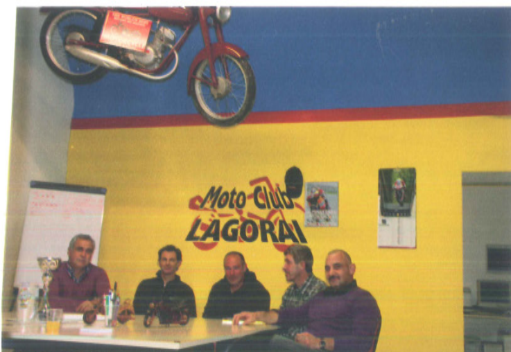
Riunione del direttivo in sede

www.motoclublagerai.it info@motoclublagerai.it