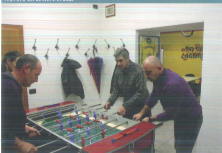
Intrattenimento con una partita a calcetto