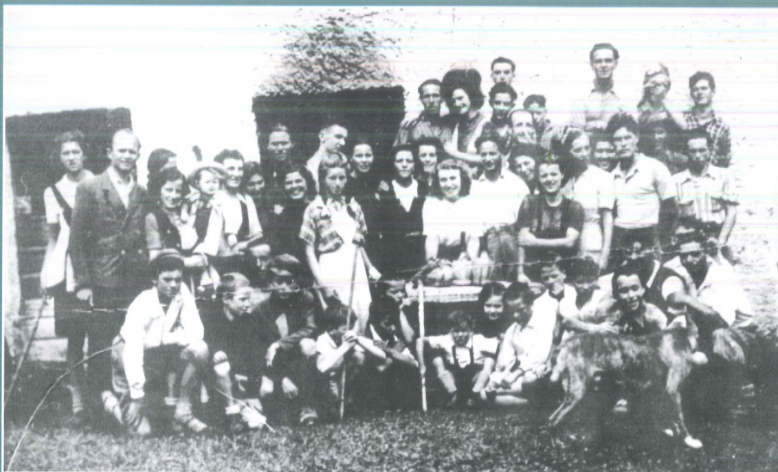
Una gita in Civerone il 6 giugno 1944

Omo in pension, femena in preson. Neve su la foia, inverno che fa voial!