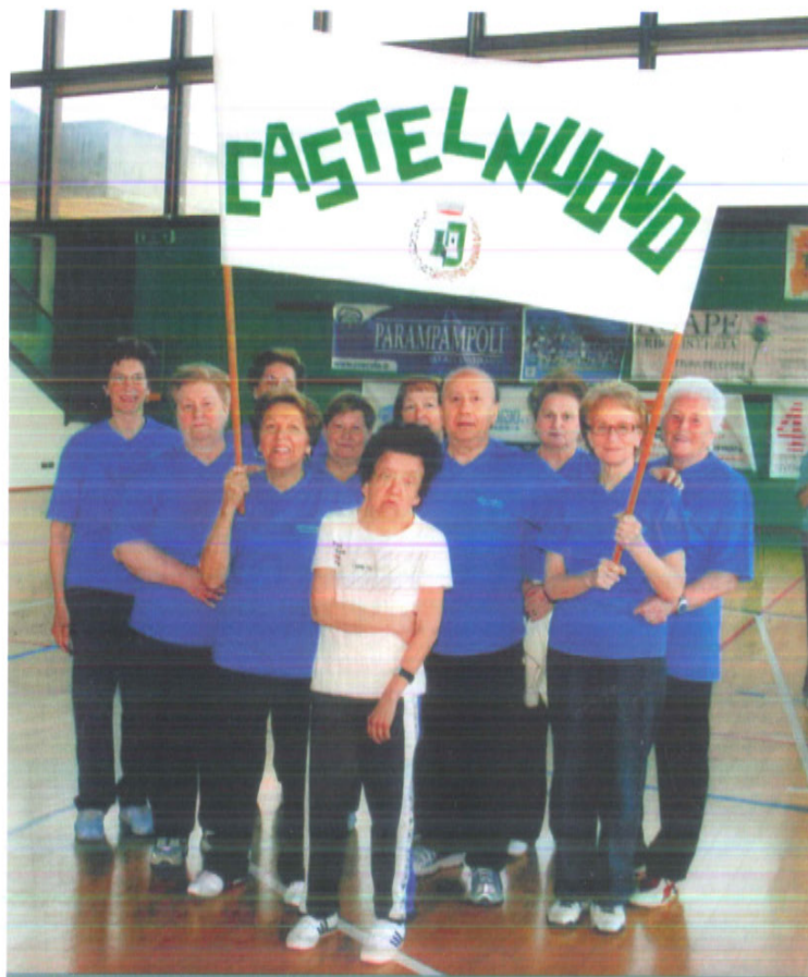
Gli anziani di Castelnuovo al "Giochinieme" al palazzetto dello sport di Borgo Valsugana

Il 9 aprile, presso il palazzetto dello sport di Borgo, ci sono stati i Giochinieme di tutti i cir-