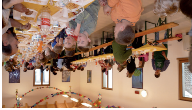
Maggio 2010 - Incontro conviviale con i bambini di Chernobyl ospiti di alcune famiglie del Tesino.