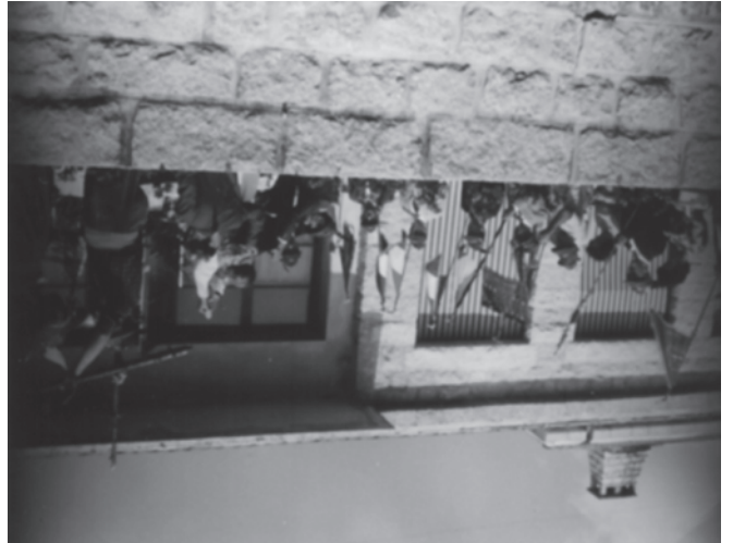
La S. Messa

Prima della celebrazione della fondazione, nel mese di marzo del 1960, il Gruppo per la prima volta ha partecipato con numerosi soci alla 33ª Adunata Nazionale A.N.A. che si è svolta a Venezia.