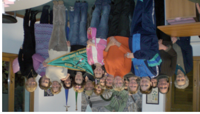
La "quota rosa" del Gruppo

“Colletta alimentare”, manifestazione che si svolge in tutta Europa e destinata ai bisognosi; organizza raccolta fondi in occasione di calamità naturali; ormai da diversi anni, durante le Festività Natalizie, fa visita alla Scuola Materna di Pieve Tesino portando doni e allegria a tutti i bambini e un sorriso agli Ospiti delle Case di Riposo di Pieve Tesino e Castello Tesino; partecipa sostenendo altre Associazioni con aiuti manuali nelle manifestazioni che organizzano o con aiuti più sostanziali con elargizione di contributi o organizzazioni di incontri conviviali. Per concludere, il Gruppo è orgoglioso perché sa di godere della massima stima e considerazione dell'Amministrazione Comunale, di tutta la cittadinanza, dell'ammirazione dei Gruppi a noi vicini, dei Dirigenti di Zona della Bassa Valsugana e Tesino e della Sezione A.N.A. di Trento.