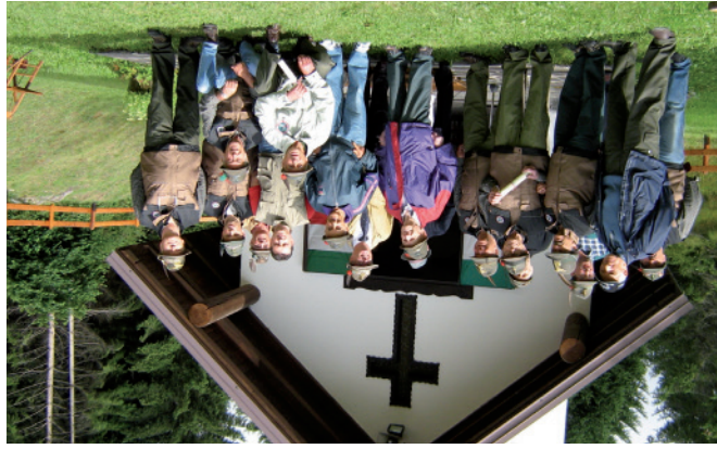
Monte Mezza 2006 - Cerimonia di consegna attestati ai Reduci

“Colletta alimentare”, manifestazione che si svolge in tutta Europa e destinata ai bisognosi; organizza raccolta fondi in occasione di calamità naturali; ormai da diversi anni, durante le Festività Natalizie, fa visita alla Scuola Materna di Pieve Tesino portando doni e allegria a tutti i bambini e un sorriso agli Ospiti delle Case di Riposo di Pieve Tesino e Castello Tesino; partecipa sostenendo altre Associazioni con aiuti manuali nelle manifestazioni che organizzano o con aiuti più sostanziali con elargizione di contributi o organizzazioni di incontri conviviali. Per concludere, il Gruppo è orgoglioso perché sa di godere della massima stima e considerazione dell'Amministrazione Comunale, di tutta la cittadinanza, dell'ammirazione dei Gruppi a noi vicini, dei Dirigenti di Zona della Bassa Valsugana e Tesino e della Sezione A.N.A. di Trento.