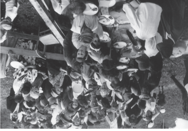
Ferragosto 1963 - 1ª Festa Alpina

Oggi la festa si svolge in un tendone con annessa una attrezzatissima cucina, messi a disposizione dal Comune e che si trova in prossimità degli impianti sportivi del paese.