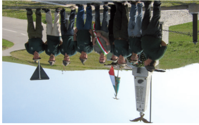
Passo Brocon 2009 - Inaugurazione Monumento ai Caduti