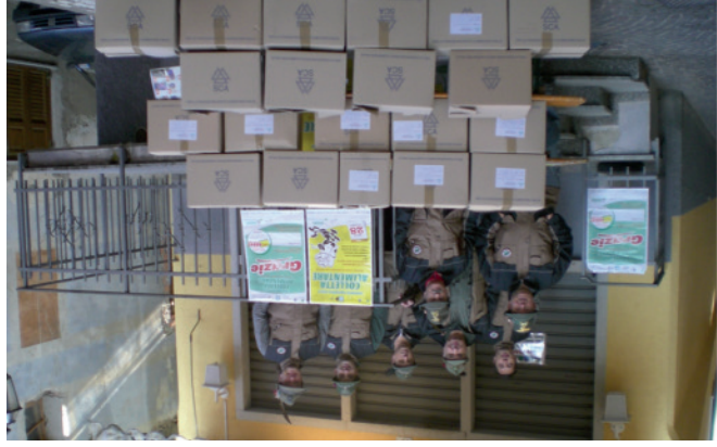
2009 - 1ª Colletta Alimentare