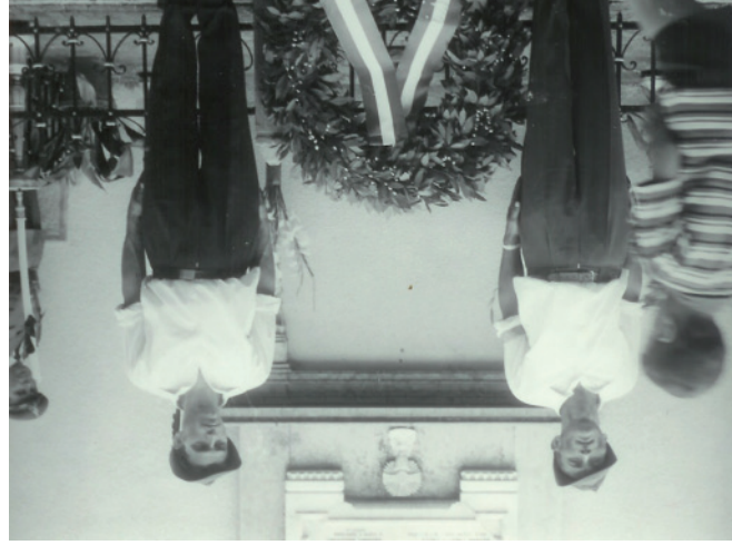
Cerimonia di commemorazione dei Caduti

NE MEMORIA POSE”. Cinte Tesino 8-6-1924.