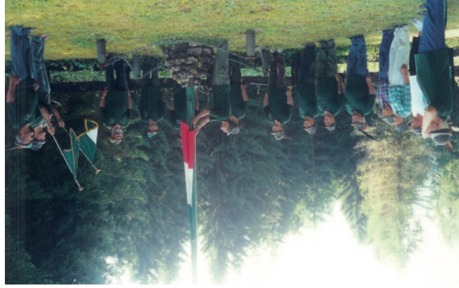
Monte Mezza Ferragosto 2003 - Alza Bandiera

Fermo restando gli impegni istituzionali dell'appartenza all'Associazione Nazionale Alpini, negli ultimi anni il Gruppo ha rivolto la propria attenzione anche all'aspetto sociale del volontariato. È doveroso dire che nelle calamità naturali che hanno colpito l'Italia il Gruppo ha partecipato solamente con iniziative individuali, però non ha fatto mancare il proprio sostegno alle popolazioni colpite raccogliendo fondi con sottoscrizioni popolari. Tanti sono i nostri Soci e Amici che sotto svariate forme hanno offerto il proprio aiuto o dedicando il proprio tempo a chi ne aveva bisogno. Il Gruppo partecipa fattivamente a fianco dell'A.I.L. (Associazione Italiana contro le leucemie, linfomi e mieloma - Trentino onlus) vendendo le stelle di Natale e le uova di Pasqua il cui ricavato va devoluto interamente all'Associazione; partecipa alla giornata dedicata alla