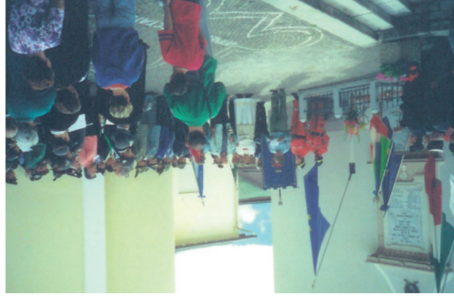
Cerimonia di posa della lapide nel 2000