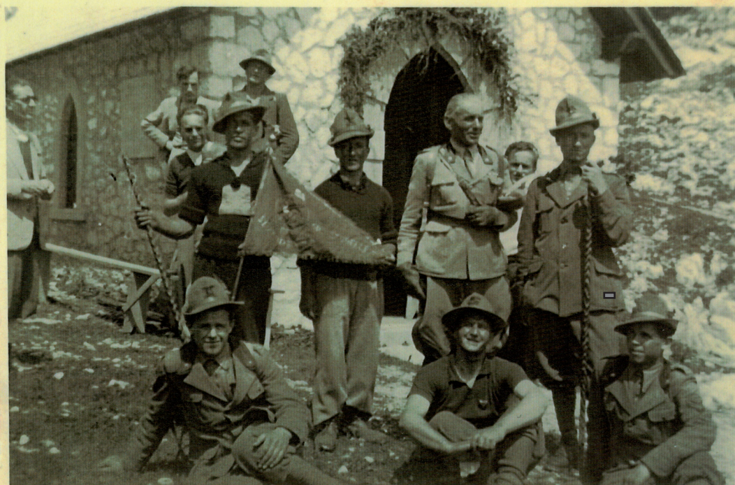
SULL' ORTIGARA, 9-7-39

Anche il Gruppo fu decimato dagli incalzanti eventi bellici. Ben undici soci furono richiamati alle armi. Coloro che erano rimasti si prodigarono per fornir loro un aiuto finanziario, attraverso collette. Lo scioglimento divenne comunque inevitabile.