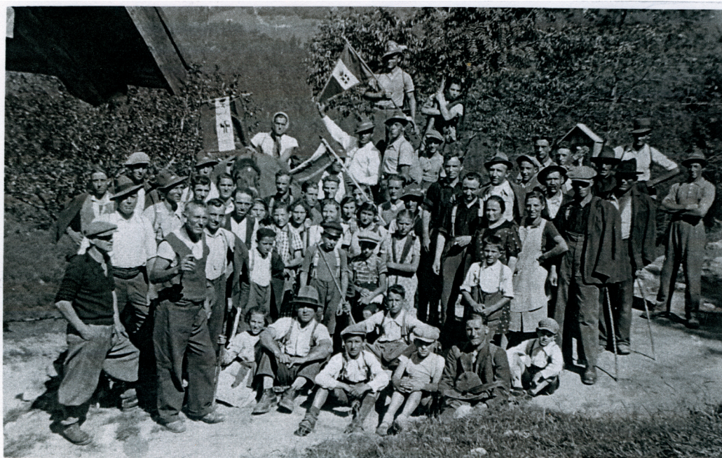
16 luglio 1939 : Gita sociale a Cenone. Notare sul gagliardetto al centro in alto lo stemma sabauda. Nella foto sotto al Cippo del Crucolo