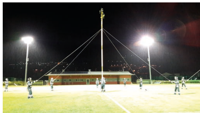
Esecuzione scala controventata - Convegno Distrettuale di Torcegno