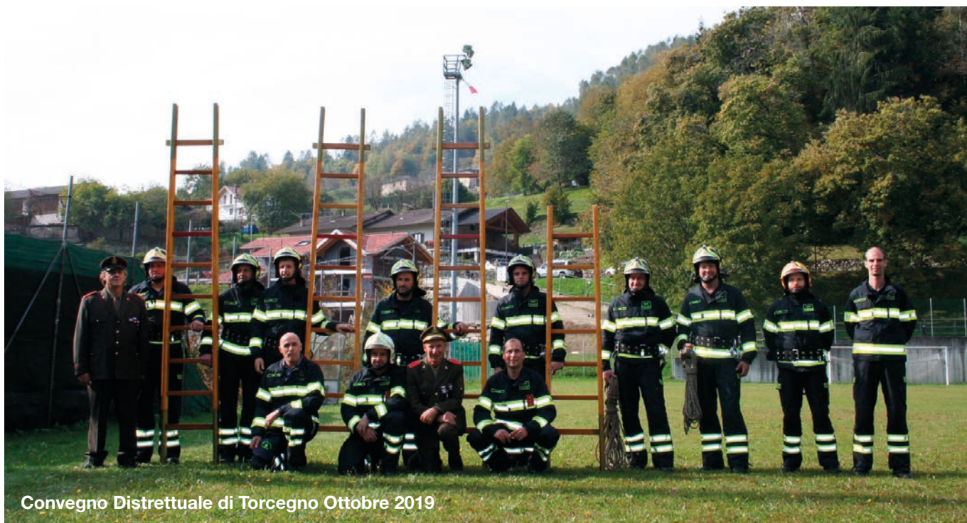
Convegno Distrettuale di Torcegno Ottobre 2019

Anche quest'anno in occasione della ricorrenza di Santa Barbara è stata illustrata l'attività svolta nel corso del 2019 dal Corpo dei Vigili del Fuoco, che registra 70 rapporti di intervento, per un totale di 1700 ore/uomo.