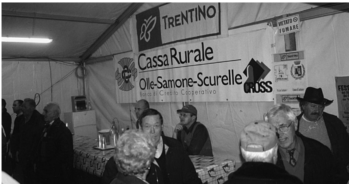
Un momento della Sagra di San Leonardo.