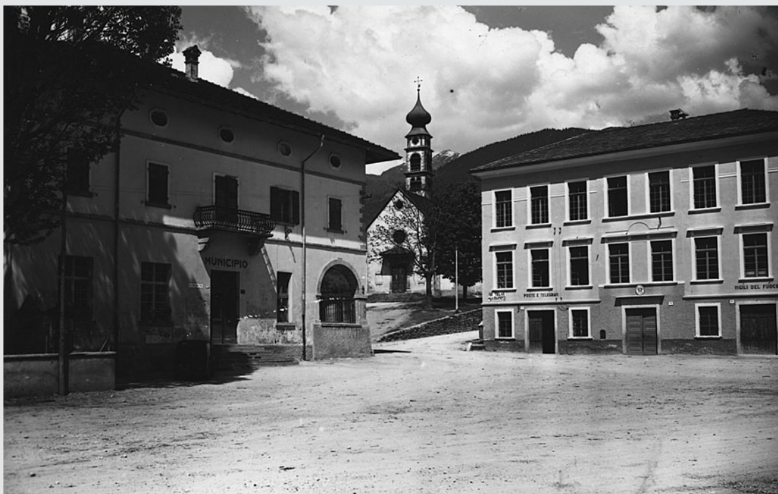
Castelnuovo negli Anni '50 (foto gentilmente messa a disposizione da Giuliana Dalla Rosa).

"Ippovia del Trentino orientale". Approvazione schema di convenzione tra il Comune di Castelnuovo e il Comprensorio Bassa Valsugana e Tesino per l'affidamento a quest'ultimo della gestione complessiva del progetto