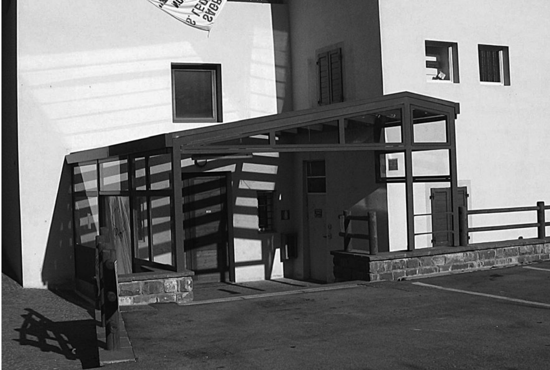
Tettoia casa De Bellat.

sono previsti il rifacimento del tratto di acquedotto e di illuminazione pubblica e la predisposizione della tubazione del nuovo collettore per le acque nere.