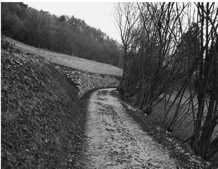
Opere del Servizio Ripristino e valorizzazione ambientale della Provincia.

È stato approvato in linea tecnica il progetto esecutivo dei lavori di sistemazione della strada Santa Margherita, inerenti le pp. ff. 1381 (strada "Andrioi") e 1389/1 in c.c. Castelnuovo, e contestualmente il nuovo quadro economico. L'impresa appaltatrice è la Cooperativa Lagorai Scarl di Borgo Valsugana. L'intervento consiste in un nuovo muro con paramento in pietra, l'allargamento di una curva e la messa in sicurezza di un tratto di strada con la posa in opera di un cordolo in cemento armato con sovrastante guard-rail.