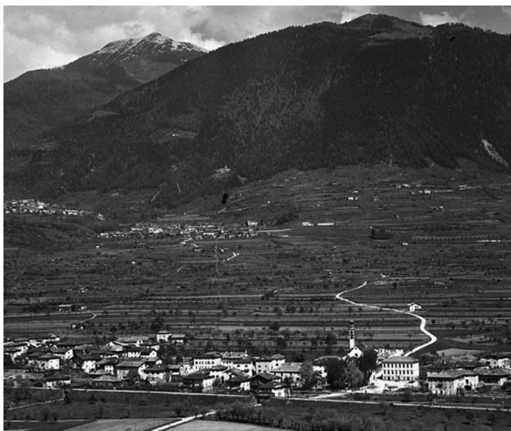
Panorama di Castelnuovo negli Anni '50.

Io noto che anche all'interno del nostro Comune sono ampiamente prevalenti importanti volontà di reazione e queste sono a volte maggiormente espresse dalla stessa società civile di Castelnuovo nel suo insieme. Alcuni rappresentanti appaiono infatti più interessati al pettegolezzo politico o all'attacco gratuito su questioni di campanile, magari ispirate da cattiveria e invidia piuttosto che da spirito costruttivo. Con questi atteggiamenti non si matura né si cresce.