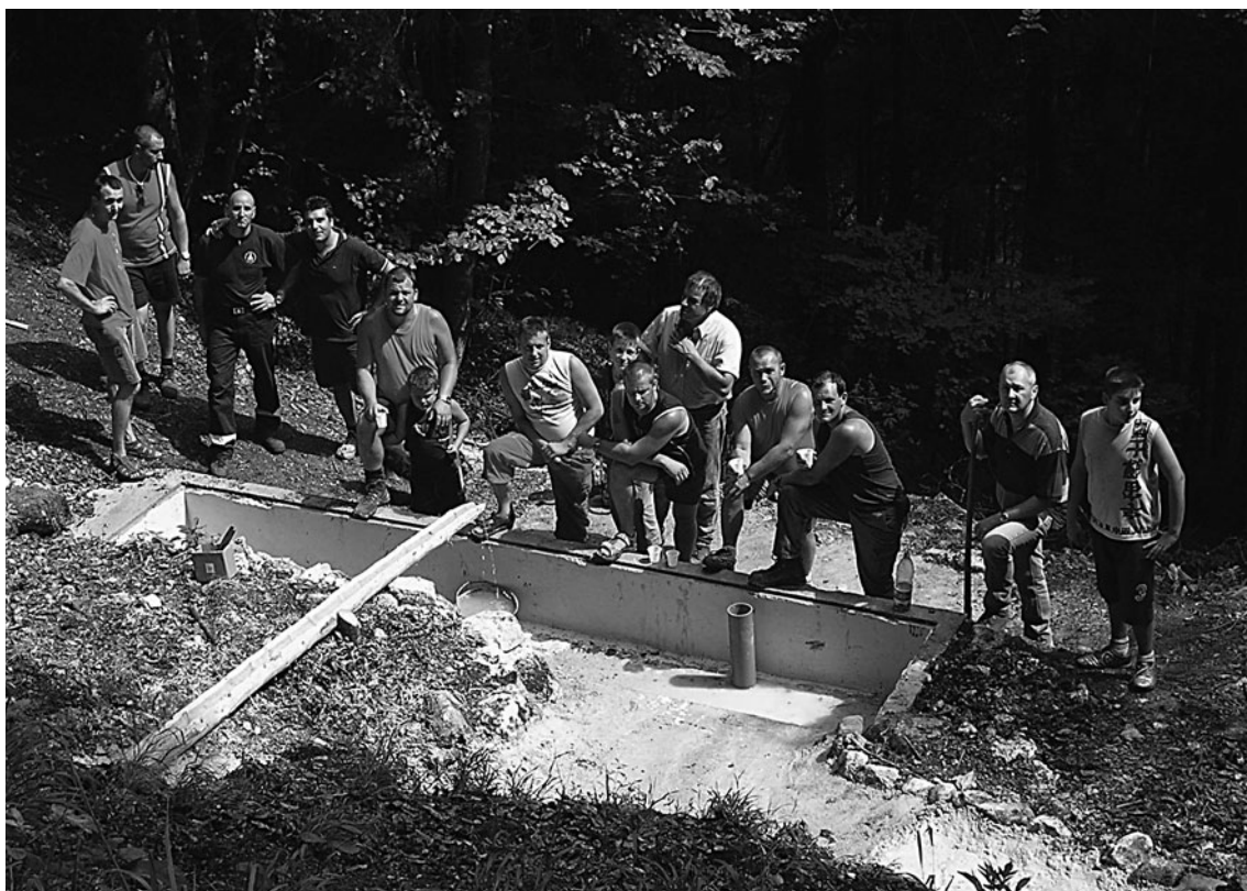
Sotto: i lavori alla fontana in Civerone.