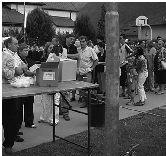
Sopra: la Gnoccolada di luglio.

Cogliamo l'occasione per ringraziare la ditta Silvelox che ha fornito il portone per il magazzino.