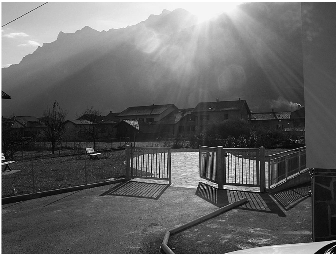
Il parco "Casa Tupini".

ALLARGAMENTO STRADA LOCALITÀ MESOLE. L'oggetto dell'appalto consiste nell'esecuzione dei lavori di allargamento e rettifica di parte della strada comunale identificata con la p.f. 1362, in località Mesole. L'importo complessivo dei lavori di competenza comunale è pari a 82.875,76 Euro, iva e oneri inclusi. Il tratto di strada è quello che va dal bivio che porta alle abitazioni della frazione e il confine con il comune di Villa Agnedo. Il primo tratto è a carico dei lottizzanti dell'area artigianale attigua, mentre il secondo tratto è a carico dell'Amministrazione comunale. Oltre all'allargamento