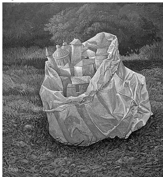
Diego Bridi: Città protetta.