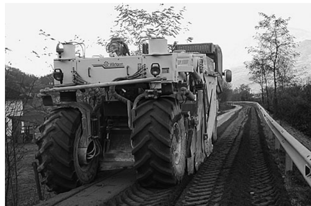
Consolidamento originale Mesole.

CONSOLIDAMENTO E ASFALTATURA STRADA ARGINALE PER LOC. MESOLE. Sono stati ultimati i lavori di consolidamento e asfaltatura della strada arginale destra Brenta per la località Mesole. I lavori sono stati compiuti dalla ditta Zanghellini Asfalti S.p.A. di Trento, per una spesa complessiva di 50.767,84 Euro, iva e oneri inclusi. I lavori sono stati realizzati con un innovativo intervento che permette di consolidare sottofondi stradali evitando i costi di trasporto a discarica dei materiali scadenti e la realizzazione di nuove massicciate con l'apporto di materiali di cava. Una macchina fresatrice e stabilizzatrice realizza in un solo passaggio la scarificazione e la miscelazione del materiale in situ con cemento, ed eventualmente calce se è presente materiale a matrice argillosa, per una profondità