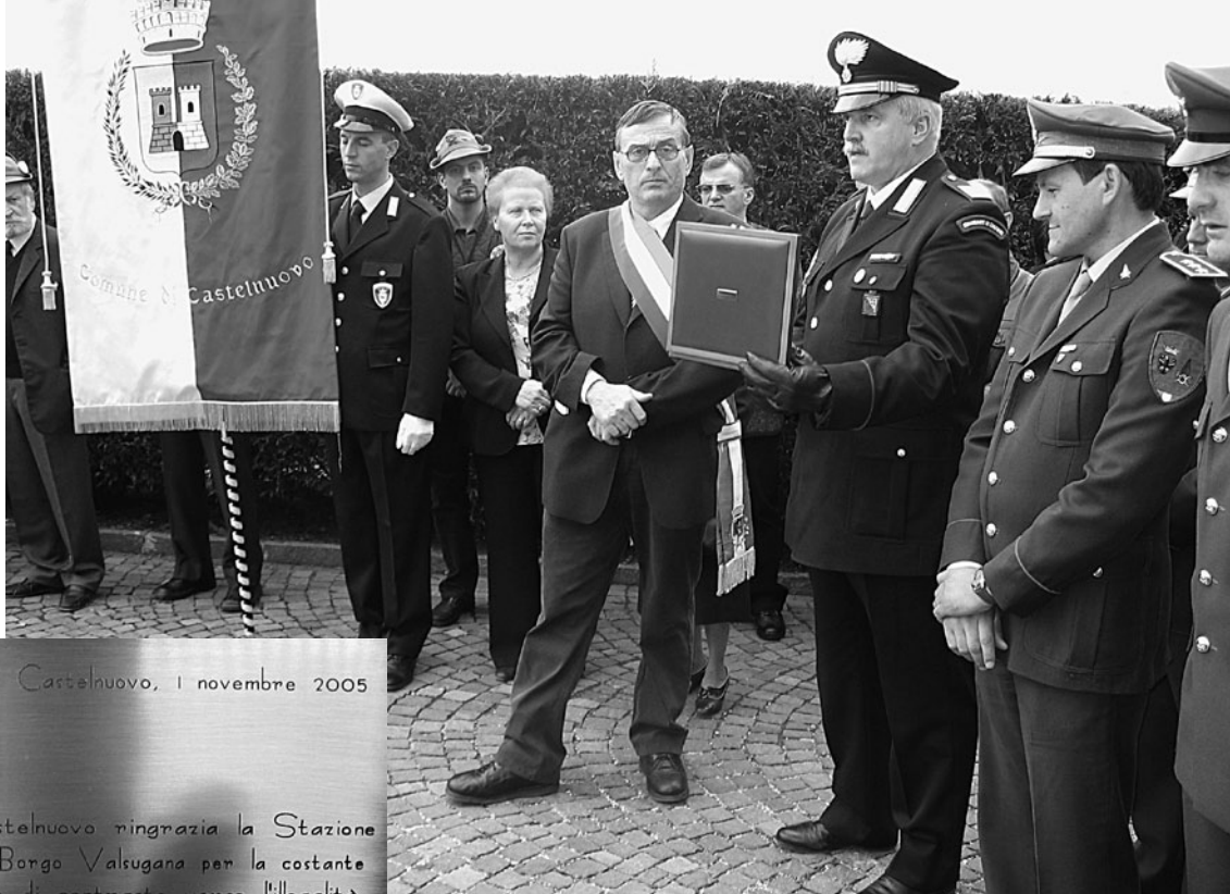
La cerimonia di commemorazione dei caduti.