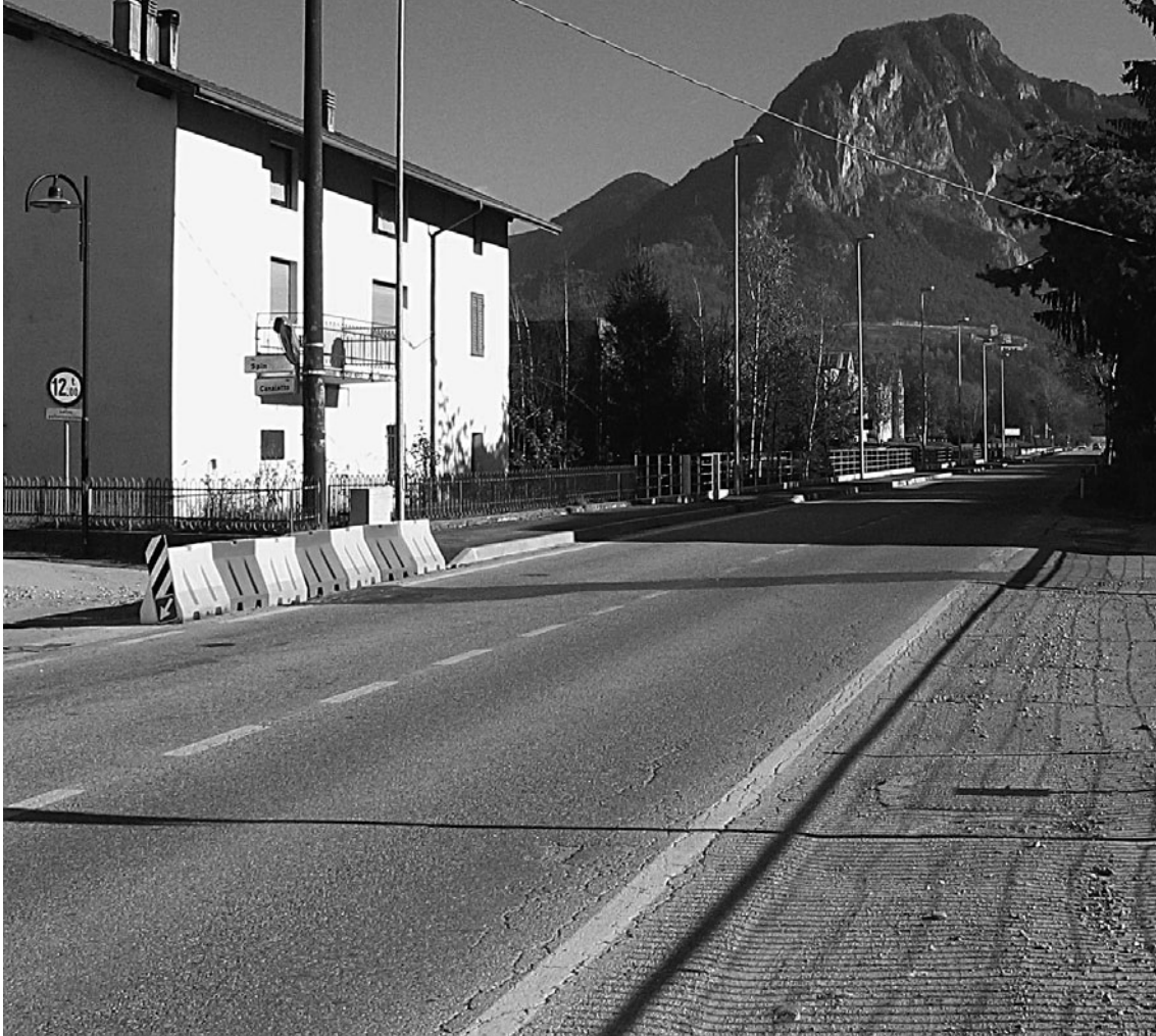
Il marciapiede di viale Venezia.

cia ha ultimato i lavori di sistemazione della strada che da località Ausei porta a loc. Mesole, della strada di collegamento da località Spagolle alla "Caneveta", nonché della strada per Civerone denominata "Caneveta". Si tratta di interventi di adeguamento della viabilità minore i cui costi sono a totale carico dell'Amministrazione Provinciale e consentono il recupero e la manutenzione dei fondi limitrofi, privati e pubblici, che