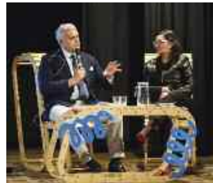
Alessandro Campagna, un vero "totem" della pallanuoto italiana, ospite d'onore nella serata organizzata all'Auditorium di Borgo per la rassegna "Gener azioni"