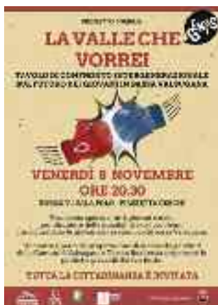
Locandina del progetto "La valle che vorrei"

Nell'ottica di un sempre maggiore coinvolgimento dei giovani sono stati