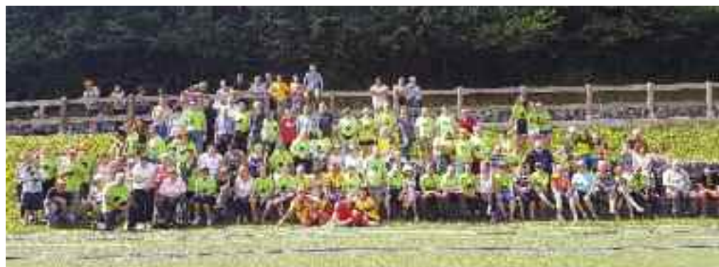
Tutto il "popolo" di Gaia in esposizione

Alla fine del corso verrà rilasciato un attestato di partecipazione a tutti i corsisti che avranno partecipato ad almeno il 70 per cento delle lezioni o delle attività programmate. ■