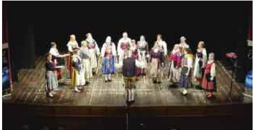
Il Coro da Camera Trentino che ha partecipato alla prestigiosa manifestazione concertistica "Città di Legnano"

La partecipazione a queste prestigiose manifestazioni, nelle quali i cori della scuola hanno saputo raccogliere lusinghieri risultati e riconoscimenti importanti, costituisce solo una parte dell'attività complessiva della scuola in ambito corale; infatti la Scuola di Musica ha attivato per il secondo anno consecutivo, in collaborazione con i docenti e la dirigente dell'Istituto comprensivo di Borgo Valsugana, un importante progetto di formazione corale rivolto a tutte le classi terze, quarte e quinte della scuola primaria: questo percorso didattico, denominato "Ogni classe un coro", è stato finanziato dalla Provincia di Trento e dal Comune di Borgo Valsugana. Nello scorso mese di giugno, a conclusione del primo anno del progetto, si è svolto al Palasport di Borgo un grande concerto corale e strumentale che ha visto la presenza di oltre 300 giovani esecutori e di circa 900 spettatori e che ha costituito un momento musicale molto suggestivo e di grande partecipazione.