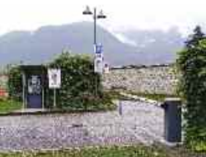
Il nuovo accesso all'area sosta camper e le indicazioni apposte sui sostegni dell'illuminazione pubblica

ILLUMINAZIONE E DECORO PUBBLICO. Su ogni palo di sostegno dell'illuminazione pubblica sono state installate targhette di riconoscimento che riportano il numero di telefono utile, in caso di