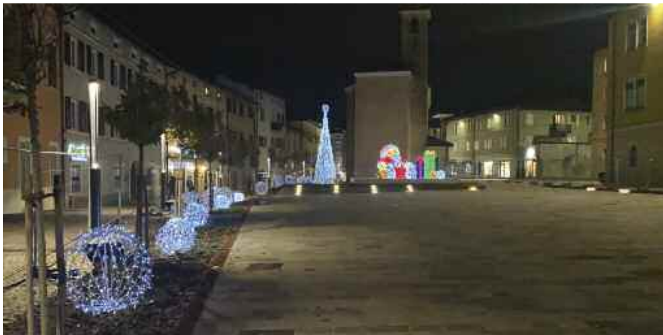
Uno scorcio della nuova piazza Degasperri in notturna, con gli addobbi natalizi

presentazione della Comunità. Sono fiducioso che sarà vissuta così dalla popolazione.