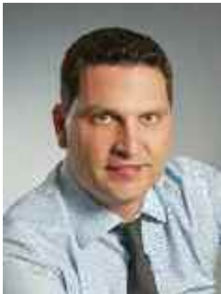
Enrico Galvan Sindaco del Comune di Borgo Valsugana

Concluso il restyling dell'agorà di Borgo, biglietto da visita del paese e luogo di socializzazione restituito alla cittadinanza. In dirittura d'arrivo anche i lavori ad Olle