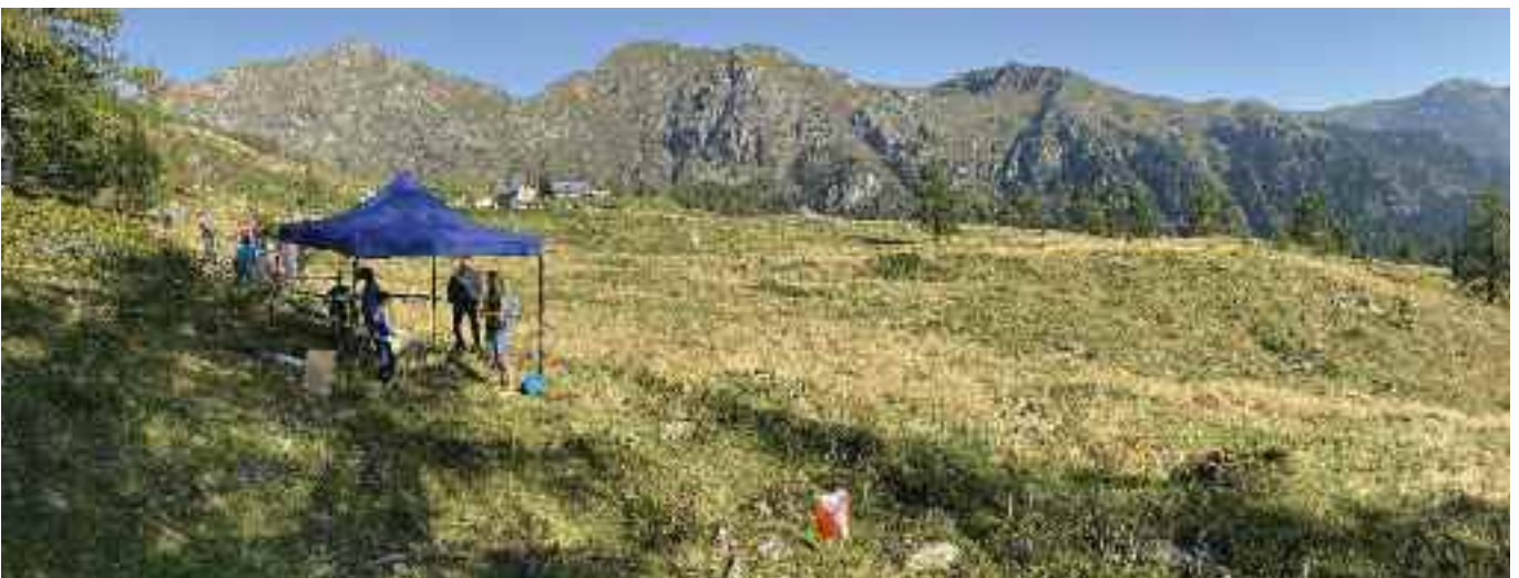
La fantastica zona di Casapinelò, sede di partenza della gara organizzata dal Panda a metà settembre