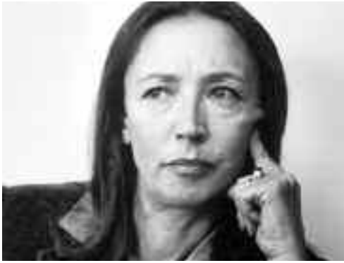
Oriana Fallaci, la scrittrice e giornalista alla quale la Lega Salvini Trentino chiede di intitolare una via di Borgo

siamo impegnati è quella dell'intitolazione di una via o di una piazza di Borgo a Oriana Fallaci, considerata la più grande giornalista italiana di sempre e una delle scrittrici italiane più apprezzate del XX secolo. La sua esistenza sorse all'insegna del binomio tra scrittura e impegno civile: già all'età di 14 anni fu parte attiva nella resistenza partigiana militando nel gruppo "Giustizia e Libertà"; un'esperienza che le permise di maturare dentro di sé quella volontà di essere "in prima linea" che in seguito la spinse a raccontare da vicino i principali teatri di guerra del Novecento. Una donna che può essere d'esempio per le generazioni future e proprio per questo ci faremo portatori di una mozione che la possa ricordare adeguatamente attraverso l'intitolazione di una via o di una piazza del paese.