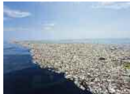
Emanuele Deanesi Presidente del Consiglio comunale di Borgo Valsugana