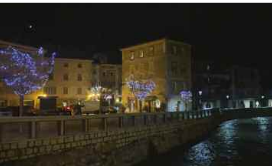
Le illuminazioni natalizie lungo il Brenta fanno già festa

Un altro evento animerà la fine del 2019 e l'arrivo del nuovo anno: il Gran galà di Capodanno, organizzato sempre