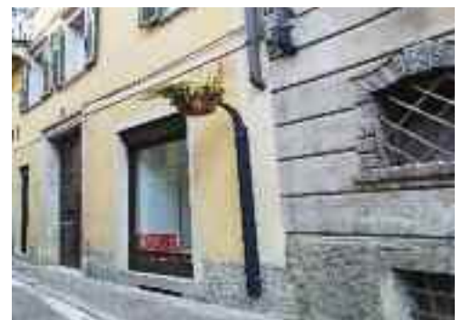
Fioriere in corso Ausugum