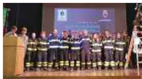
Il plotoncino dei 24 nuovi Vigili del Fuoco che entrano a far parte dei 22 Corpi del Distretto