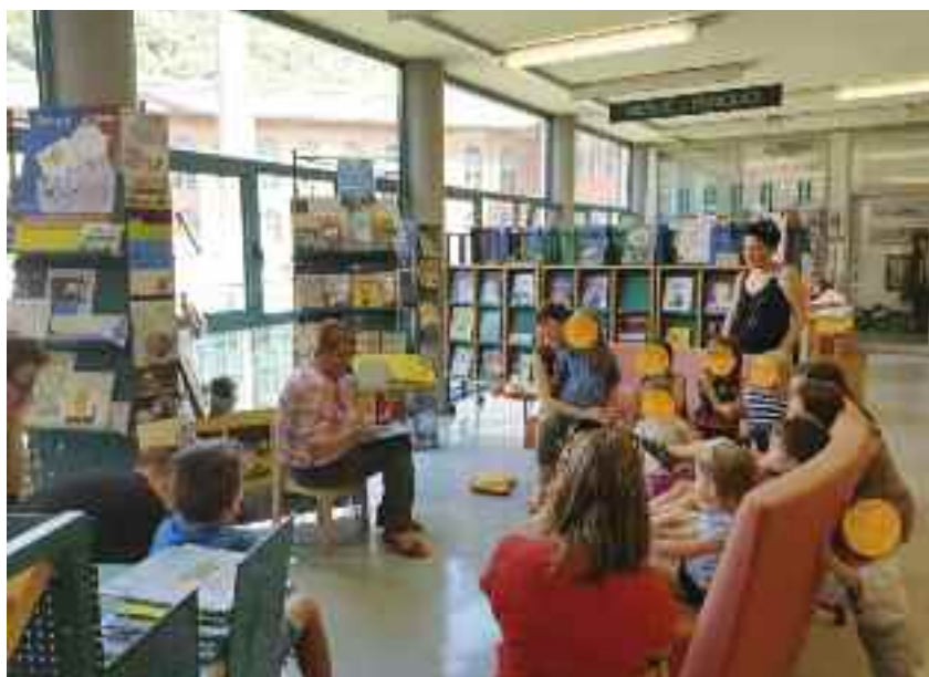
Una volontaria di NpL in azione con tanti piccoli bambini

Nello specifico la Biblioteca comunale di Borgo Valsugana aggiorna costantemente l'offerta di libri per la fascia d'età dagli 0 ai 7 anni, propone letture animate per bambini sia in biblioteca, sia nei luoghi più frequentati dai bambini (come ad esempio i parchi o le piazze del paese), organizza mostre e ospita incontri con esperti in collaborazione con il Nido d'infanzia e la Scuola materna, interviene nei corsi di genitorialità post-partum organizzati presso il Consultorio familiare di Borgo Valsugana. Inoltre, a partire dal 2015, l'Amministrazione comunale offre ai genitori dei nuovi nati di Borgo Valsugana un libriccino da leggere al proprio bambino e materiale informativo sull'importanza della lettura sin dalla più tenera età. Nel corso di questi anni si è rivelato incisivo anche il contributo dei volontari Nati per Leggere che, in collaborazione con le Biblioteche comunali della zona, si rendono disponibili a far dono del proprio tempo e della propria voce ai bambini.