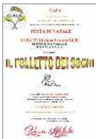
La locandina dello spettacolo "Il Folletto dei Sogni"

Importante il ruolo svolto dal Gruppo Scuola che opera in alcuni istituti medi e superiori della valle creando importanti momenti di riflessione sul tema