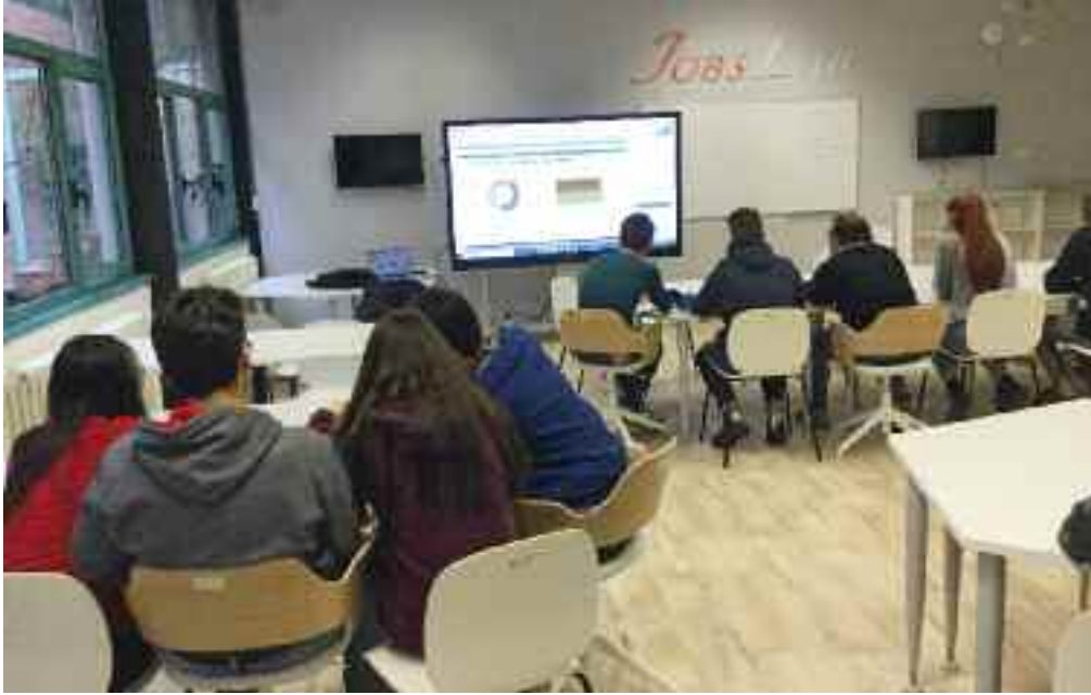
Una classe della scuola al lavoro nell'innovativo spazio didattico Jobslab

vengono svolte nei laboratori: particolarmente innovativi sono lo Startlab e il Jobslab . Rispetto alla scuola che abbiamo frequentato gli anni precedenti affrontiamo nuove materie (fisica, chimica, latino), i professori però ci danno una mano e ci sostengono. Un'altra cosa che ci aiuta molto in questo periodo è il peer tutoring , ovvero la disponibilità dei ragazzi del triennio ad aiutarci nei compiti. In generale ci troviamo molto bene».