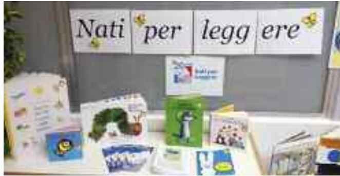
Alcune delle proposte presentate dalla Biblioteca comunale di Borgo per "Nati per Leggere"

Per festeggiare i 20 anni di Nati per Leggere la Biblioteca comunale allestirà nei mesi di dicembre e gennaio una mostra bibliografica con i 20 libri che hanno fatto la storia dell'iniziativa. Si tratta di 20 libri, selezionati dall'Osservatorio editoriale di Nati per Leggere, significativi per la letteratura per l'infanzia, ricorrenti nell'uso di operatori, volontari e genitori nel corso di questi due decenni. ■