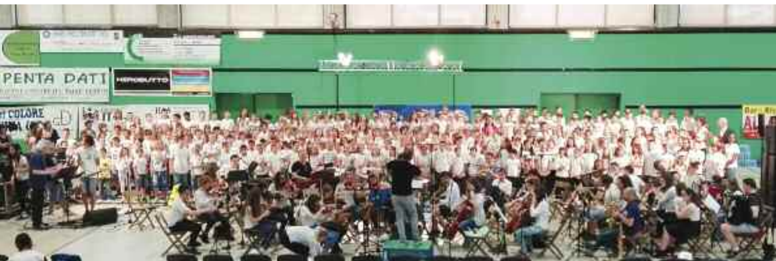
Una bella immagine del grande concerto corale, tenutosi al Palazzetto lo scorso giugno, al quale hanno partecipato trecento giovani esecutori dell'Istituto comprensivo di Borgo Valsugana

Il coro ha avuto l'onore di prendere parte ai due concerti in programma, il primo dei quali svoltosi il sabato nella splendida cornice della chiesa parrocchiale dei SS. Martiri Anauniani, il secondo in calendario il giorno dopo nel teatro "Città di Legnano".