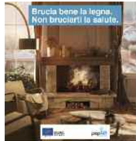
La locandina che richiama la campagna promossa dalla PAT per un corretto utilizzo delle stufe a legna in casa