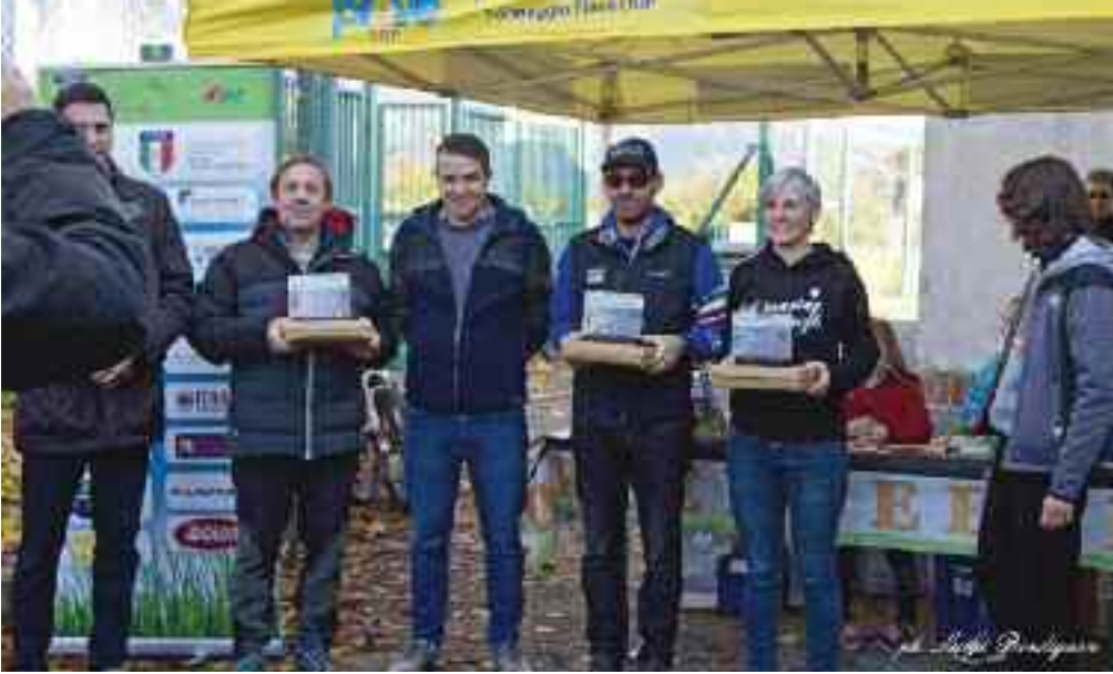
La premiazione della squadra del Panda per il terzo posto ai Campionati italiani 2019 di mountain bike orienteering

orientamento. Il sabato pomeriggio con una gara di tipo "sprint" a Borgo Valsugana valida per assegnare il titolo di campione trentino, mentre il giorno successivo una splendida giornata di sole ci accoglieva in pieno Lagorai dove i 300 concorrenti intervenuti si sono cimentati in una gara nazionale di media distanza, tra i lariceti fortunatamente non toccati dalla tempesta dello scorso ottobre: il territorio interessato dalla manifestazione è quello che si snoda attorno a malga Casapinelò, in quel di Torcegno, e si estendeva sino ai laghi del Colo.