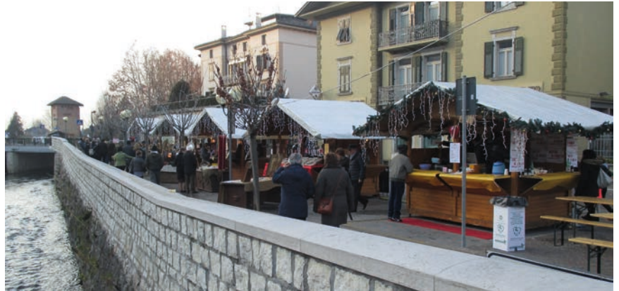
■ Mercatino di Natale lungo il Brenta, a Borgo

Non siamo solamente critici, vogliamo anche essere propositivi e quindi invitiamo la Giunta ad individuare nuove zone da adibire a sosta camper, a ridosso del centro storico oppure in Val di Sella, assieme magari ad un bici grill che possa dare ulteriore impulso al turismo nel nostro paese e attirare ulteriori amanti della natura che visitano le bellezze del nostro territorio. Ci auguriamo che in tempi brevi venga approvato il "Piano baite" della Val di Sella ed il "Piano commercio" che, dopo un primo momento di accelerazione, sembrano spariti; confidiamo che tutto questo ritardo sia dovuto alle nostre richieste