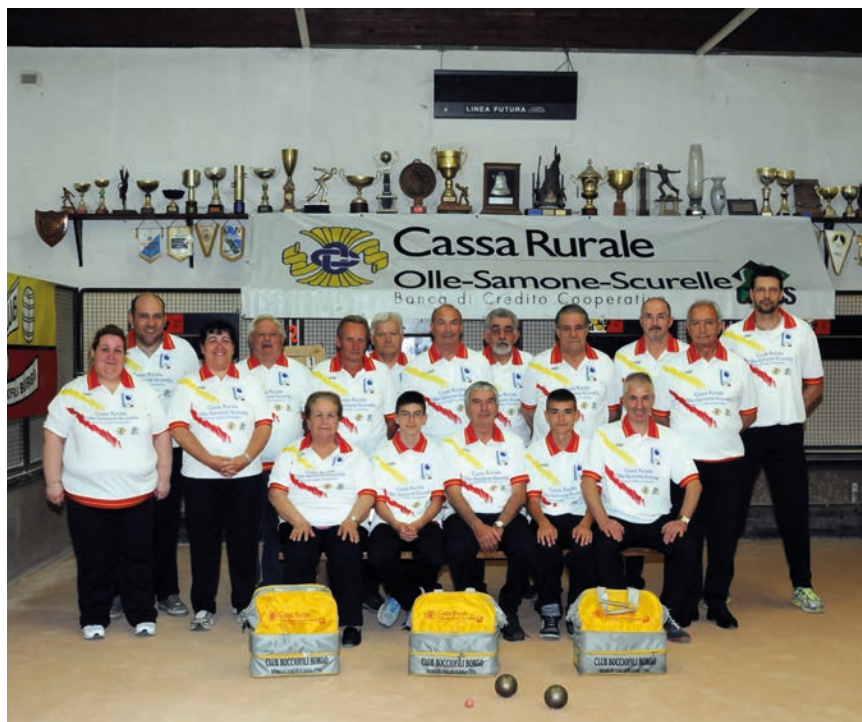
■ La squadra del Club Bocciofili Borgo in posa davanti alla bacheca con le coppe e i trofei vinti in quarant'anni di attività