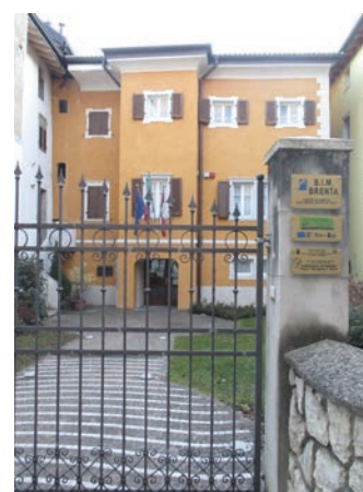
■ La sede del B.I.M. Brenta a Borgo