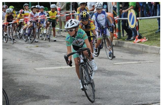
■ Giovanissimi al via nell'edizione 2015 della Coppetta d'Oro