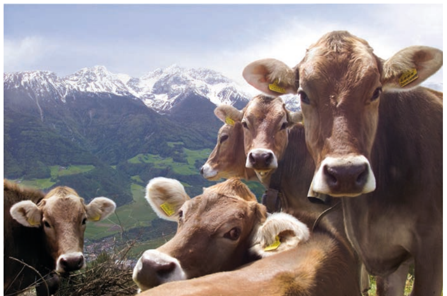
■ La salvaguardia dell'agricoltura locale, al centro del programma elettorale del PATT