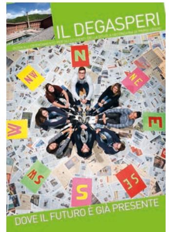
■ La copertina dell’opuscolo con i particolari della nuova offerta formativa del “Degasperi”

Tutto questo per arricchire la didattica che da anni punta con determinazione alla qualità. Obiettivo raggiunto, come dimostrano i dati Invalsi, OCSE Pisa e degli Esami di Stato, tutti al di sopra delle medie nazionali e provinciali.