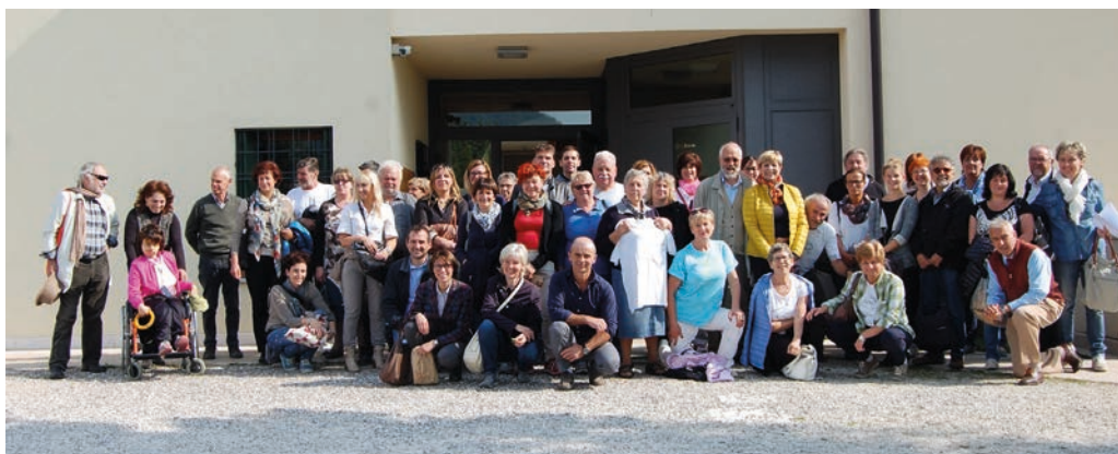
■ Il folto gruppo di volontari Gaia

“Assistenza”, però, non è il termine più appropriato da usare in quanto, molto spesso, i volontari entrano a tutti gli effetti a far parte della cerchia di amicizie delle persone che visitano. Si crea con loro un legame e si condividono esperienze di vario genere.