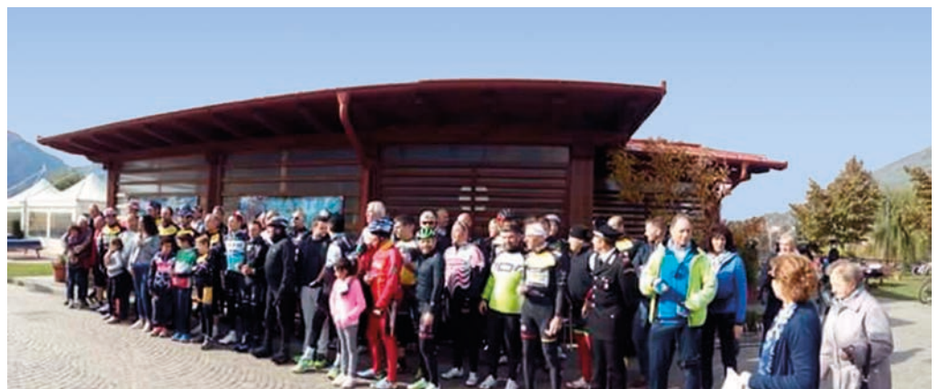
■ Il folto gruppo dei partecipanti alla pedalata con Matteo Trentin

Borgo è dotata di impianti sportivi e piste ciclabili all'avanguardia che tutta la provincia e il vicino Veneto ci invidiano e presso i quali possono cimentarsi quotidianamente atleti ed appassionati di ogni età.