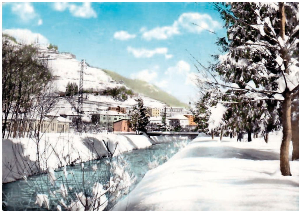
■ Neve a Borgo. Fino a qualche giorno fa una chimera

bile ai loro colleghi più navigati. Non riteniamo necessario fare analisi di voto, lo avrete già fatto a suo tempo e quindi sarebbe inutile e noioso, però convintamente ringraziamo quanti ci hanno dato fiducia; cercheremo di ripagarli con un lavoro serio e di impegno, a favore della nostra Comunità e del nostro territorio. Non a caso abbiamo rimarcato la parola territorio. La nostra è valle che necessita quanto mai di attenzione: la grande crisi che stiamo attraversando sta purtroppo indebolendo le nostre ditte locali, gli artigiani della Valsugana, un tempo vanto per tutta una