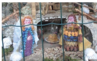
■ Un dettaglio del presepe "ingabbiato" all'ingresso della Chiesa arcipretale di Borgo