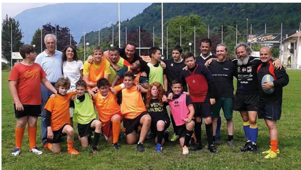
■ Foto di gruppo per i Black Bears, la società rugbistica che gioca a Borgio

Ringraziamo gli sponsor, l'Amministrazione comunale e gli enti del territorio che ci sostengono: senza di loro tutto risulterebbe molto difficile. Un grazie ai collaboratori, ma soprattutto ai genitori che ci affidano i loro figli con fiducia; e ai giocatori che sono il presente e saranno il futuro del rugby a casa nostra.