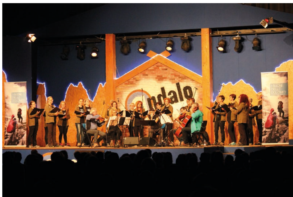
■ Il coro da Camera Trentino di scena ad Andalo

Il più importante “Festival in quota” estivo a livello nazionale ha proposto quest’anno un interessante progetto del noto compositore trentino Armando Franceschini, al quale abbiamo chiesto di fornirci qualche dettaglio sull’evento