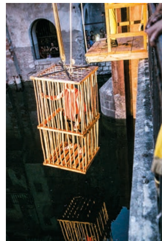
■ La tonca nel Brenta

In chiusura, vi auguriamo buon Natale e felice anno nuovo.