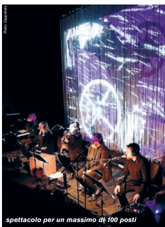
spettacolo per un massimo di 100 posti

di Carlo Casillo & Mariano de Tassis regia, video e luci Mariano de Tassis arrangiamenti musicali, direzione musicale Carlo Casillo con: Valerio Bazzanella voce, piano; Lisa Bergamo voce; Corrado Bungaro cori, nichel arpa, violino; Carlo Casillo chitarra, armonica, mandolino, computer Mariano de Tassis attore, percussioni; Giacomo Plotegher ingegnere del suono, Antonio De Cia elaborazioni 3D