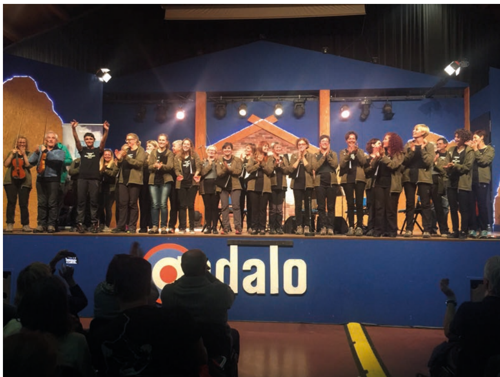
■ Molto apprezzata l'esibizione del Coro da Camera Trentino "Suoni delle Dolomiti" 2015

guerra, l'emigrazione. Confronto fra tradizione popolare, affidata alle voci femminili del Coro da Camera Trentino , diretto da Giancarlo Comar, e contemporaneità, raccontata dalla voce straordinaria di Petra Magoni. A far da collegamento fra i vari temi, gli interventi strumentali dell'ensemble de I Virtuosi Italiani e le riflessioni poetiche di Giuseppe Calliari".