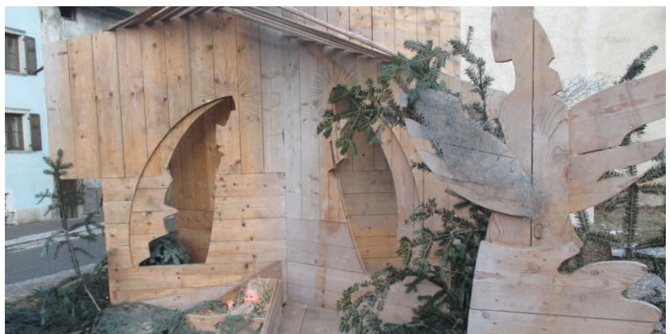
■ Il presepe in legno che campeggia in piazza Degasperì