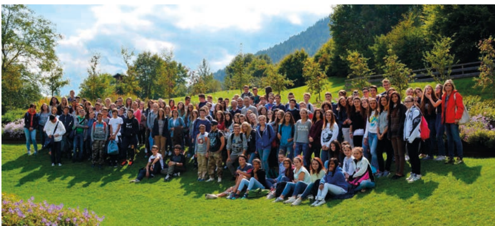
■ Le matricole 2015 del “Degasperi” a Pive Tesino nel giorno dell’accoglienza

Al Degasperi lo sguardo è rivolto al futuro. In primo luogo a quello prossimo, relativo alle iscrizioni per il nuovo anno scolastico, scadenza per la quale sono state organizzate attività didattiche di notevole valore.