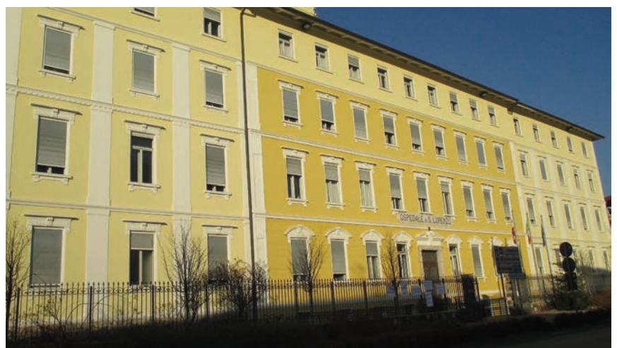
■ L'ospedale "San Lorenzo" di Borgo, al centro del programma elettorale di Borgo Domani