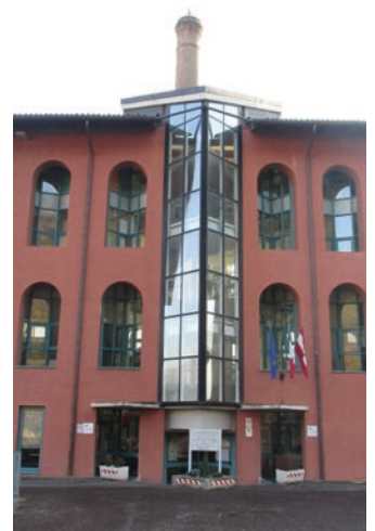
■ L'Istituto di Istruzione "Degasperi"; la ventilata riduzione dei corsi di studio è stata al centro di una delle interrogazioni di Civitas