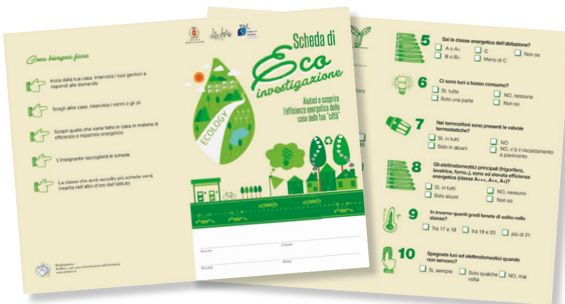
■ La scheda di eco-investigazione che i ragazzi dovevano compilare per "fotografare" l'efficienza energetica delle loro abitazioni