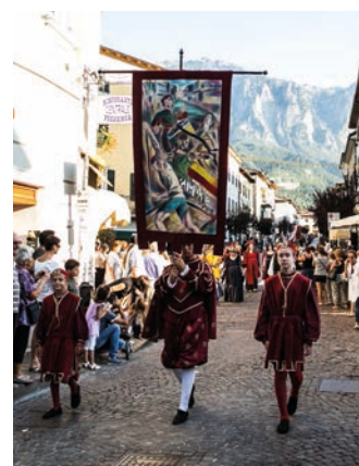
■ Il nuovo Palio in sfilata

Per tesseramenti o per restare informati sulle nostre attività: