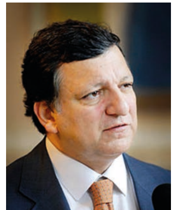
■ Manuel Barroso, Presidente della Commissione Europea dal 2004 al 2014

"Attraverso il Patto dei Sindaci, l'UE ha mostrato al resto del mondo l'unione dei suoi cittadini nell'impegno a ridurre le emissioni di CO 2 . Grazie a questo movimento pionieristico, i Paesi e le Città di tutta Europa stanno sviluppando soluzioni autonome basate sulla partecipazione dei cittadini e volte ad affrontare questo problema globale di estrema urgenza". (José Manuel Barroso)