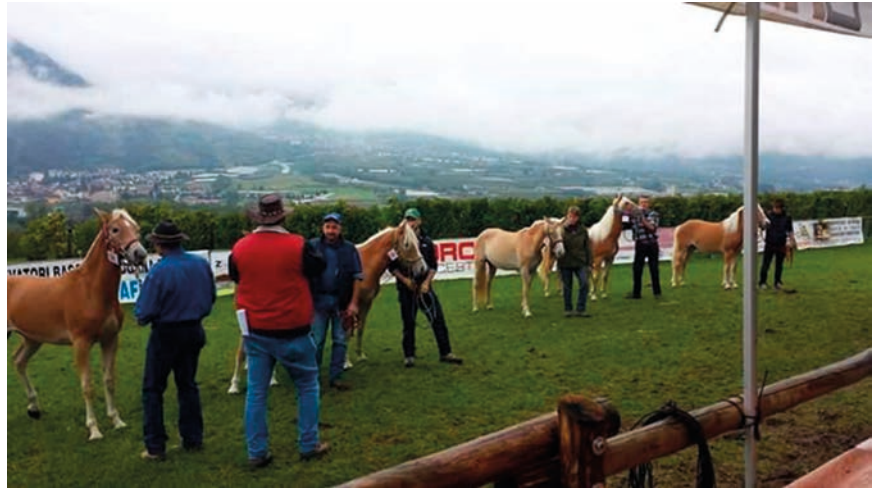
■ Un'istantanea della rassegna "Cavallo Haflinger e Norico"

A queste va il mio grazie e quello di tutta l'Amministrazione. Grazie per esserci sempre e grazie per il servizio che rendete alla collettività! Questo è il valore aggiunto e questo è ciò che nessun contributo e nessun emolumento potrà mai compensare.