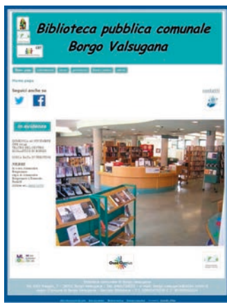
■ Il nuovo portale internet della Biblioteca, on-line dal gennaio 2015

A disposizione, in rete, i dettagli riguardanti le procedure che regolano le scelte, gli acquisti e indirizzano le iniziative intraprese