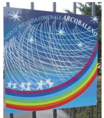
■ Il cancello per accedere al nido d'infanzia "Arcobaleno", dove si inizia a conoscere ed imparare anche la lingua di Ghoete

Speriamo di porre le basi di un'educazione multiculturale per le generazioni future, per i nostri figli, per i cittadini e gli amministratori che avremo in futuro e che dovranno confrontarsi con una realtà variegata, dove la capacità di comprendere e farsi comprendere sarà la base imprescindibile dello sviluppo.