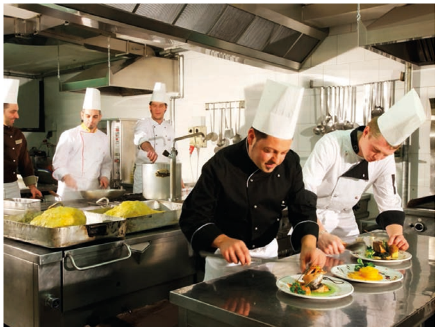
■ Giovani e lavoro, uno dei temi cari al PATT

Il Gruppo consiliare PATT - Civica Autonomista