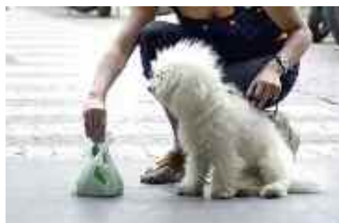
Un gesto civile ed educato. Peccato che non tutti i cittadini abbiano questa sensibilità

Non voglio giudicare questo modo di urlare la politica (evidentemente qualcuno è già "sceso in campo" per le prossime elezioni comunali), ma vorrei soffermarmi su una mozione che Corrente Giovani e Civitas hanno presentato l'11 marzo 2013, puntualmente bocciata con banali e sterili giustificazioni.