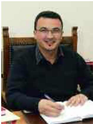
Fabio Dalledonne Sindaco di Borgo Valsugana