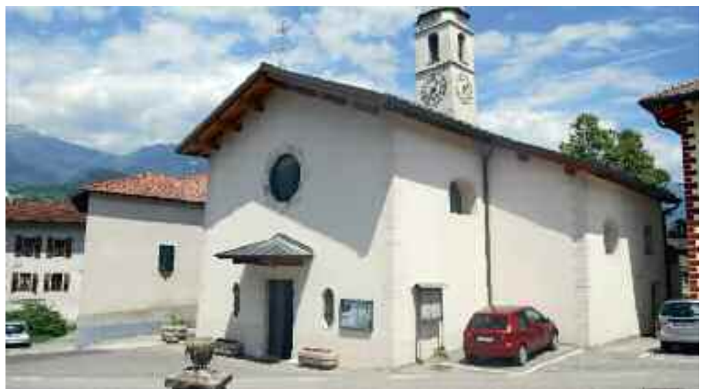
La Chiesa di Olle

Spesso la gente non si rende conto di quanto sia difficile governare e le ultime ristrettezze economiche di certo non aiutano in questo compito; è giusto però che un buon amministratore impieghi le risorse economiche a disposizione in favore dei cittadini e in opere che diano lavoro e favoriscano l'economia. Bisogna avere il coraggio di pensare in grande e chiedere alla Provincia di intervenire consistentemente nella nostra valle, spesso dimenticata. Ne abbiamo bisogno.