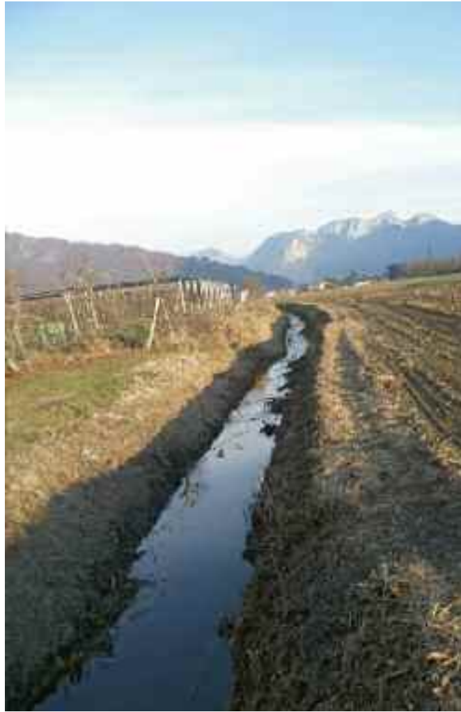
Uno dei lavori realizzati per garantire sicurezza e controllo del territorio, soprattutto in ambito agricolo