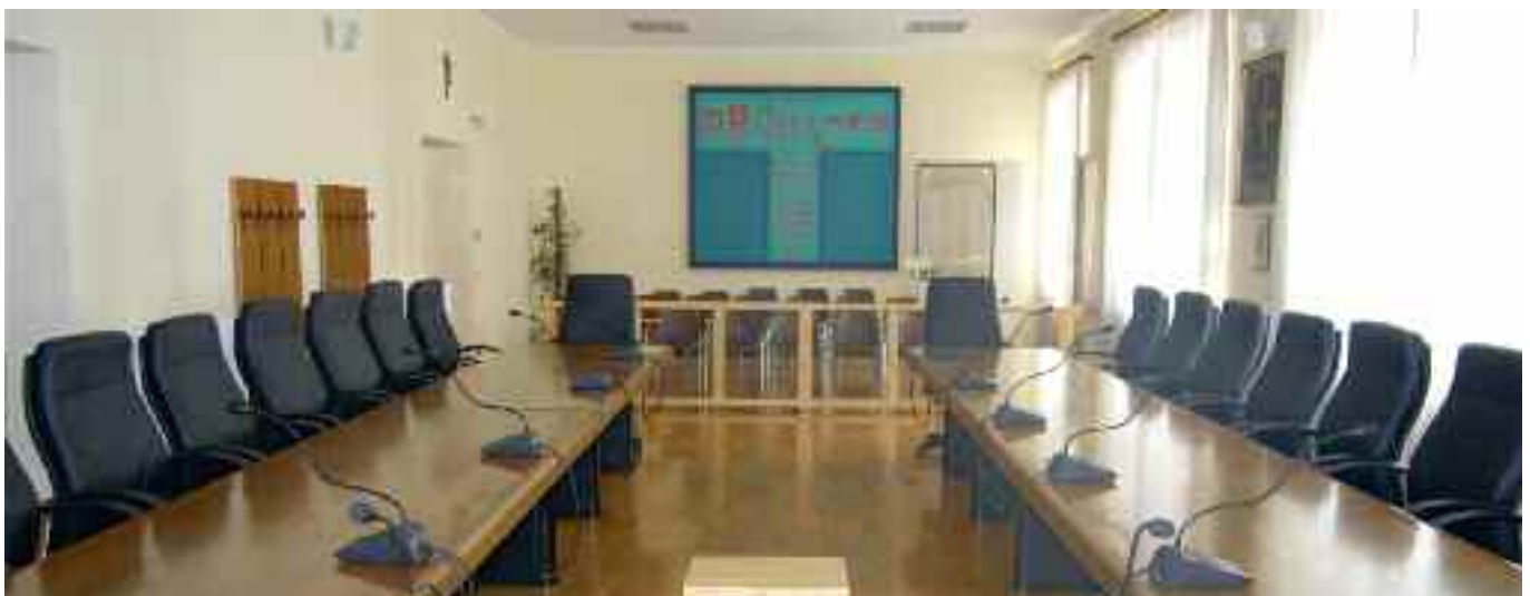
L'aula che accoglie il Consiglio comunale di Borgo Valsugana

Presidente del Consiglio comunale di Borgo Valsugana