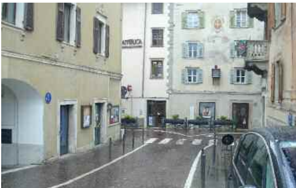
L'ingresso del negozio ora gestito da Enzo Spagolla e dalla moglie Sonia

Enzo Spagolla e Sonia, una coppia al bacio, nel loro negozio