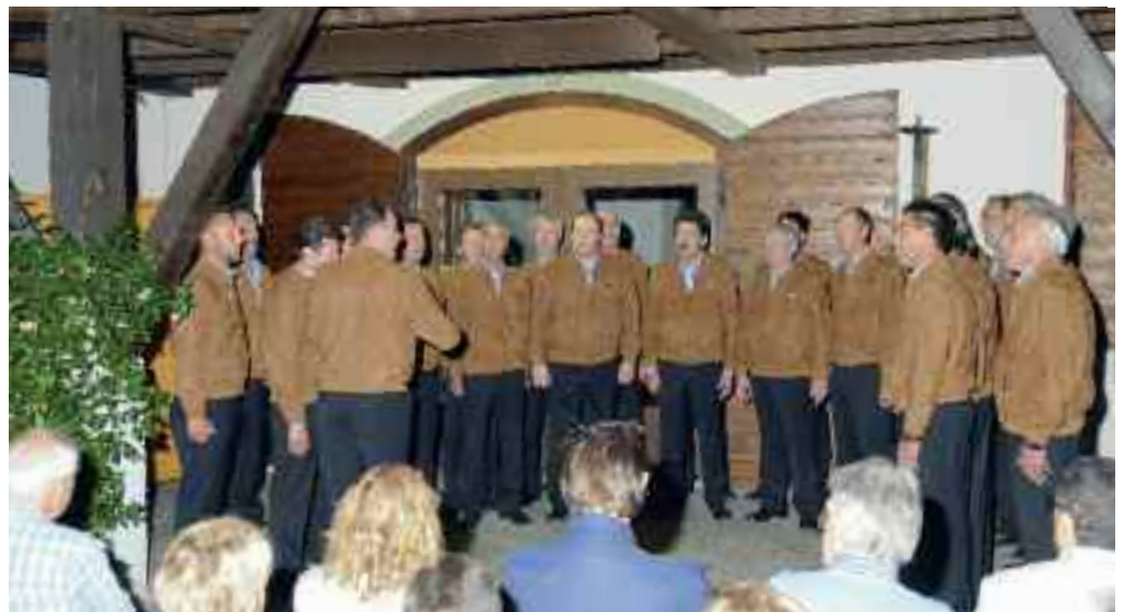
Il Coro Valsella, spesso protagonista apprezzato della Festa della Cultura a Borgo

Una questione che riguarda l'organizzazione delle manifestazioni è sempre la parte burocratica amministrativa. Da metà maggio è stato organizzato un servizio che ha la finalità di agevolare