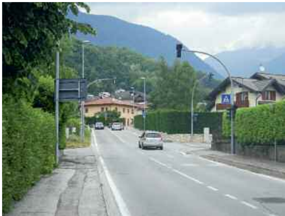
Il pericoloso e trafficato incrocio tra via per Telve e via Segantini