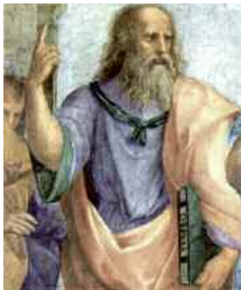
Platone, filosofo di riferimento nelle conferenze di Ragucci Brugger e Ferrai

Una riflessione sul presente e sul futuro della democrazia, partendo dal passato: ecco l'obiettivo degli incontri proposti da Giorgio Ragucci Brugger e Lucia Ferrai presso il Municipio di Borgo Valsugana dal 13 marzo all'8 maggio 2014.