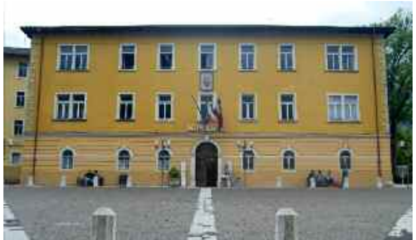
Il Municipio di Borgo

L'esperienza insegna che il genere letterario "lagna" non è di alcun giova-