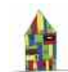
Biblioteca Comunale di Borgo Valsugana