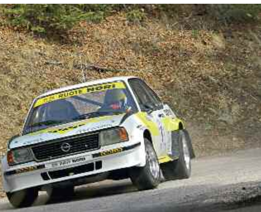
Protagonisti sulle strade della Valsugana Historic Rally