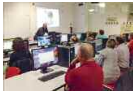
Studenti e docenti protagonisti del progetto E.d.A. durante alcune attività d'aula