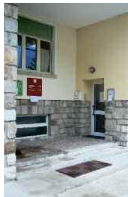
L'ingresso della Scuola Materna di Borgo