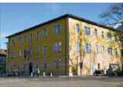
Il Municipio di Borgo