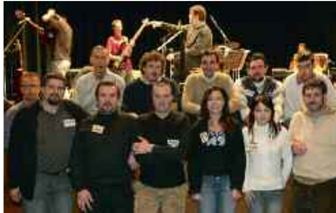
Il direttivo della Nota Bene

Vanti dell'associazione l'aver sempre preferito la musica d'autore (che non sempre "paga" in quanto a presenza di pubblico) e la qualità alla musica commerciale, ma anche la politica di contenimento del costo del biglietto (la musica deve essere fruibile da tutti) resa