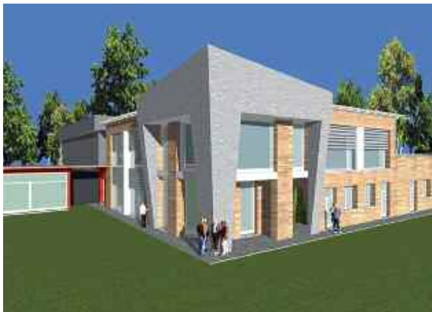
Il rendering della Casa dello Sport di Rovereto sulla Secchia

Gruppi consiliari Borgo Domani Borgo Centro Popolare