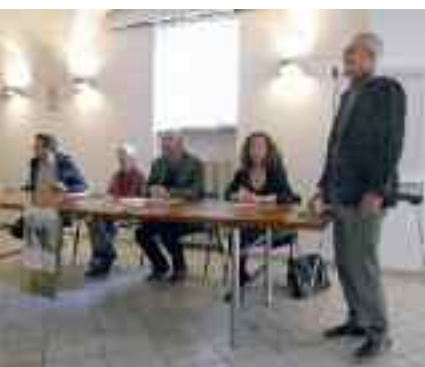
"Vernice" stagionale per il Museo della Grande Guerra

L'afflusso di appassionati e curiosi, ingolositi dalla possibilità di visita guidata proposta da ASCVOT, si è protratto fino a sera a testimoniare dell'interesse e del credito riscossi dall'associazione in lunghi anni di impegno divulgativo e di valorizzazione delle incredibilmente ricche testimonianze di storia bellica sparse sul territorio della Valsugana e del Canal di Brenta.