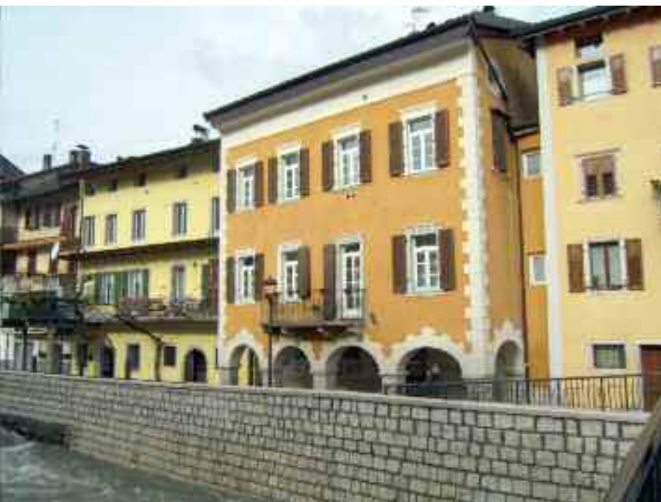
Il palazzo che ospita la sede del BIM

Il Consorzio dei Comuni trentini compresi nel bacino imbrifero montano del fiume Brenta ha saputo nel tempo soddisfare i Comuni consorziati, dapprima distribuendo sulla base parametrica del