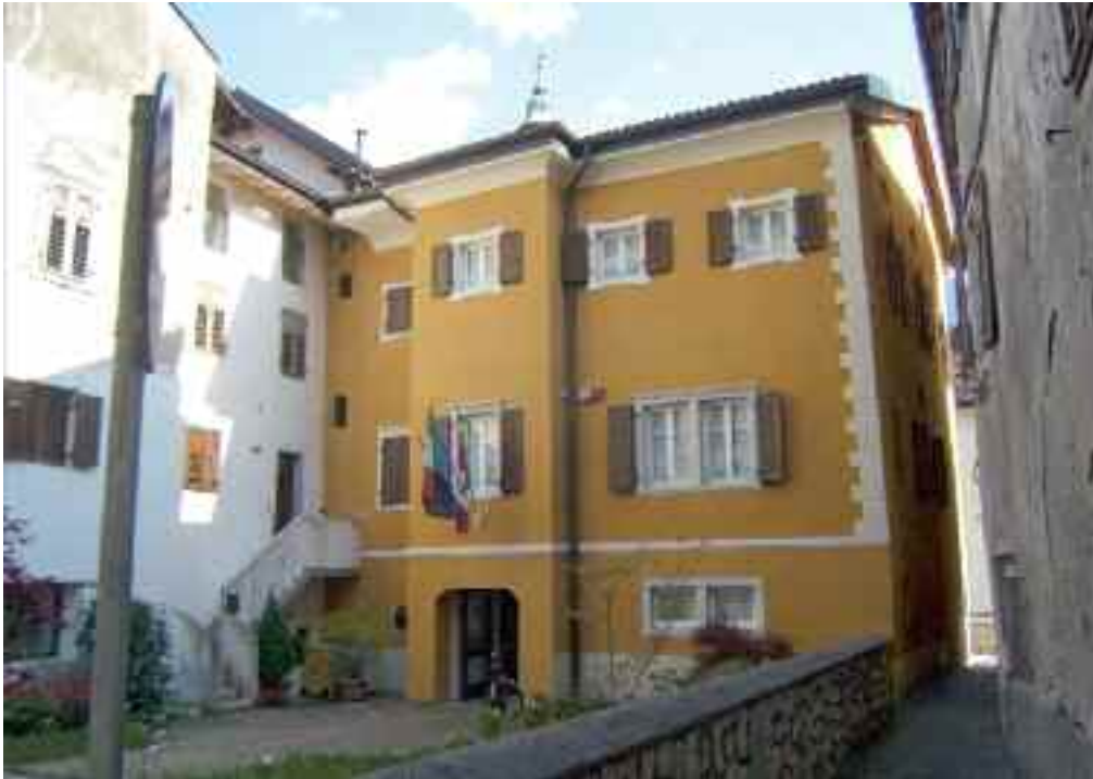
L'ingresso principale del BIM: vi si accede da Corso Ausugum

territorio, della popolazione e della presenza di impianti idroelettrici, i riscatti proventi dei sovracani; in un secondo tempo, dal 1992 fino a poco tempo fa, operando attraverso fondi di rotazione quinquennali, ha dimostrato concretamente la sua preziosa presenza sia univoca che complementare ad altri interventi provinciali o statali. A puro titolo esemplificativo, nel decennio 2001-2010 il Comune di Borgo ha destinato i propri finanziamenti a lavori di manutenzione alla Cappella del Cimitero, a lavori di allargamento di via Piccola, all'acquisto del terreno "ex Modena" per la realizzazione delle nuove Scuole elementari. Ora la crisi economica ha rallentato forzatamente, con il cosiddetto "patto di stabilità", la destinazione di fondi che avevano permesso interventi sul territorio intero molto apprezzabili (per investimenti di circa 20 milioni di euro nel decennio). Oggi la maggior parte dei Comuni preferisce godere della quota spettante destinandola a spese correnti. Per effetto di questo la gestione dei sovracani si rivolge adesso alle attività produttive e al risparmio energetico. In particolare per l'anno 2014 sono quattro gli ambiti di intervento: l'asse-