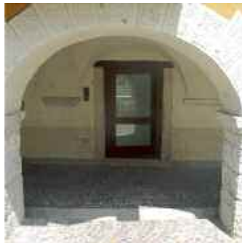
Il grazioso accesso al BIM dai portici del lungo Brenta

gnazione di contributi in conto interessi (circa il 3%) su mutui a favore di alcuni settori produttivi e l'assegnazione a soggetti privati, ovvero a imprese, di contributi in conto capitale per la realizzazione di sistemi di risparmio idrico negli edifici o per diagnosi energetiche sul patrimonio edilizio esistente. Un ultimo settore di interventi riguarda contributi ad associazioni culturali, sociali e ricreative che sul territorio hanno come scopo primario quello di riunire la popolazione: non grosse cifre, ma di fronte ad eventi di qualificante spessore, la sensibilità degli amministratori si è sempre rivelata generosa. ■