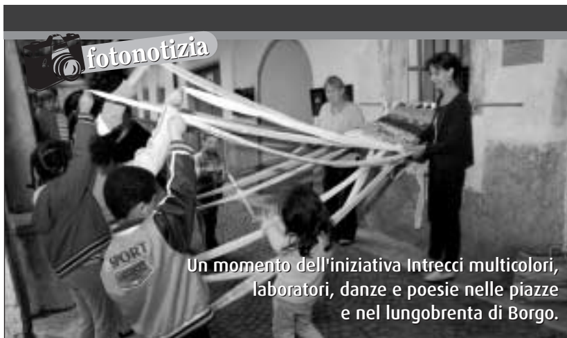
Un momento dell'iniziativa Intrecci multicolori, laboratori, danze e poesie nelle piazze e nel lungobrenta di Borgo.