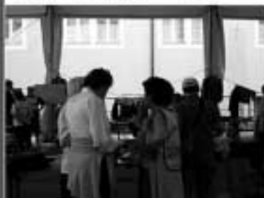
Manifestazione Ri-uso, 16 giugno 2007

A tal proposito si ringrazia quanti hanno collaborato con lo Spazio Giovani di Borgo per la positiva realizzazione della manifestazione e nello specifico l'A-