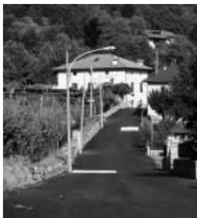
Nuovo asfalto in via per Roncegno

sottolineare come stiano per essere completati alcuni interventi di asfaltatura. Una spesa complessiva di 170.000 euro che ha interessato via per Roncegno e che quanto prima metterà mano anche al Primo Boale, via Lunar ed alcune vie del centro». I lavori del nuovo parcheggio a Olle sono in via di ultimazione e con 120.000 euro verrà finanziata una variante per il completamento dell'opera: con altri 140.000 euro verranno finanziati i lavori per la messa in sicurezza della strada per Torcegno , mentre