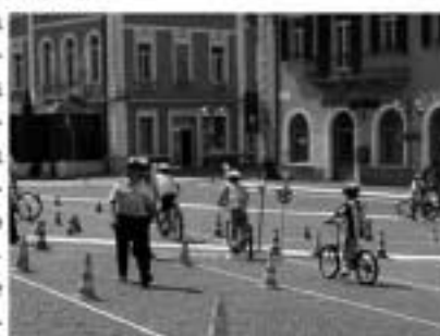
Manifestazione StreeTotem, 16 giugno 2007

Infine per tutto il pomeriggio è stato presente lo stand del progetto "Giovani e alcol" coordinato dal Settore Socio-Assistenziale del C3. I referenti del Settore Socio-Assistenziale della Bassa Valsugana e Tesino, dell'ACAT Valsugana Orientale e Tesino e del Servizio Alcolologia dell'A.P.S.S. distretto della Bassa Valsugana hanno proposto cocktail analcolici e regalato simpatici segnalibri.