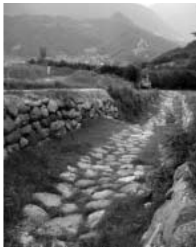
Lavori al Rio Canaia

È prevista anche la sistemazione e la messa in sicurezza del tratto del Rio Canaia dalla superstrada fino alla ferrovia: il tratto iniziale verrà sistemato dal Servizio Bacini Montani (il Comune interviene con