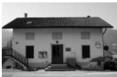
Ex caseificio Olle