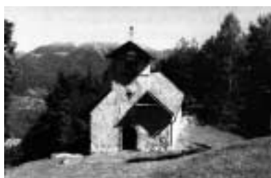
Eremo di San Lorenzo

Mons. Giovanni Battista Montini (futuro Paolo VI) celebra la Messa nella chiesa arcipretale. Quel giorno, il 13 agosto, era ospite di Alcide Degasperì in Val di Sella