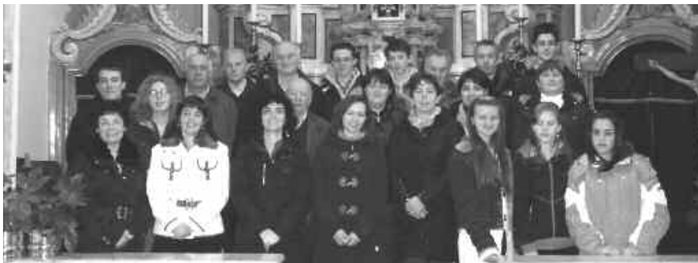
Il coro parrocchiale