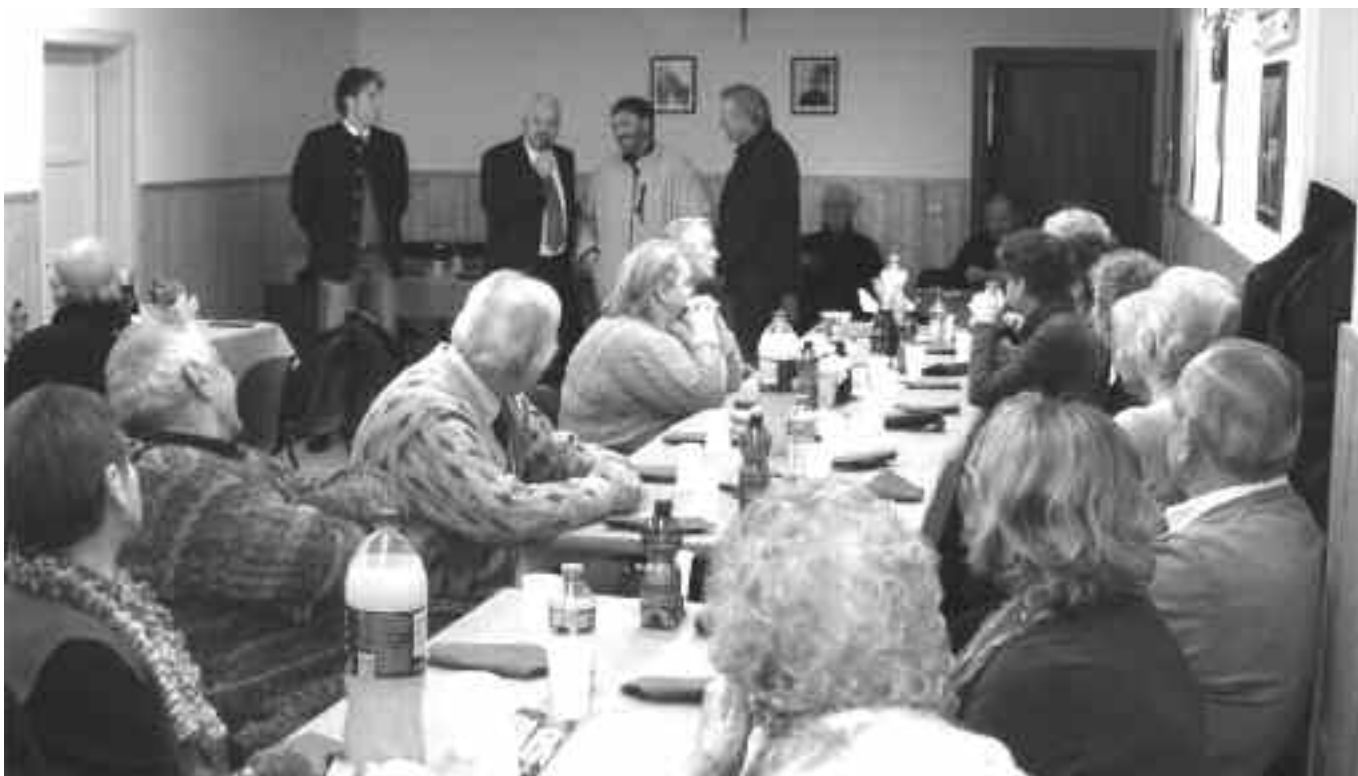
Pensionati alla festa e, in fondo, le autorità