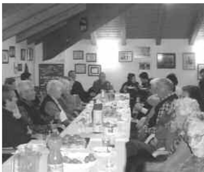
Festa dei compleanni