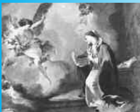
G. B. Pittoni "Annunciazione"

O Maria, luminosa armonia delle origini, risplendi nelle nostre coscienze!