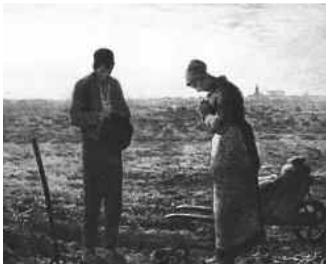
"Preghiera" Giovanni Segantini

E nell'offrire i doni della nostra terra alle sorelle Clarisse del monastero di Borgo li accompagniamo con la speranza che la loro incessante preghiera ottenga a tutti l'immenso dono della fede.