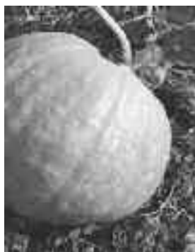
Zucca prodotta in loc. Vie Fonde, sul terreno dell'avvocato Ildebrando Lazzarotto ... peccato non sia stata pesata e misurata! Chi l'ha vista afferma che era ... "enorme". Complimenti ai due produttori!