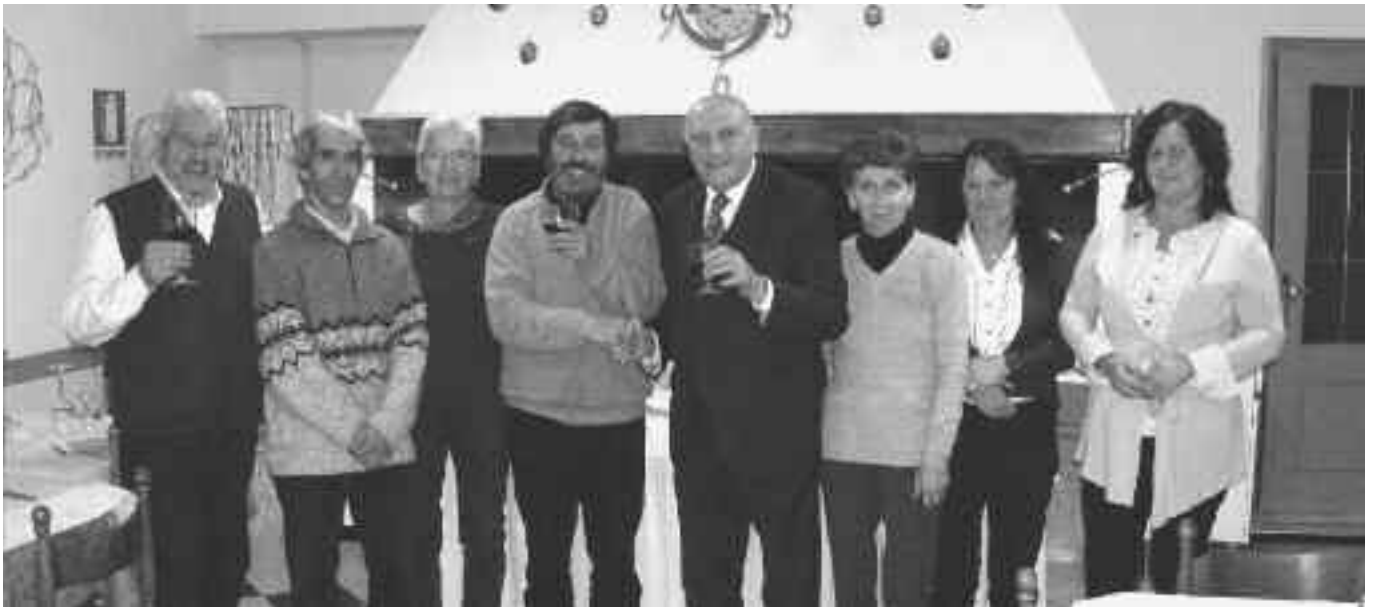
Il brindisi augurale