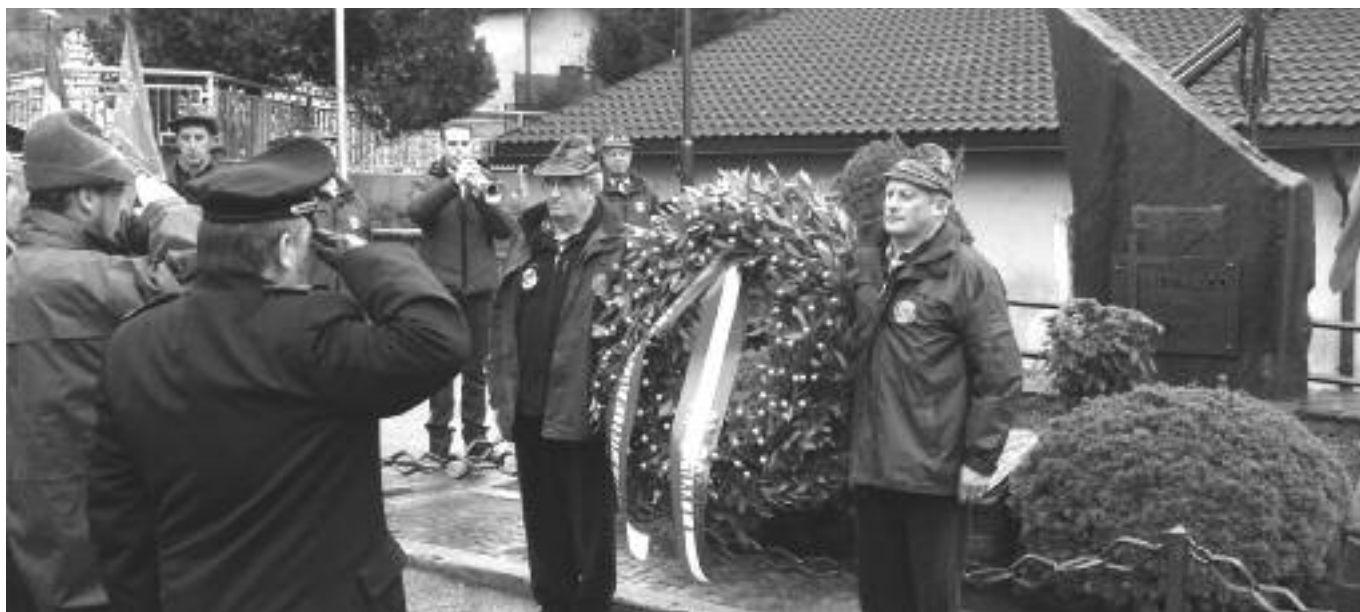
La deposizione della corona al Monumento