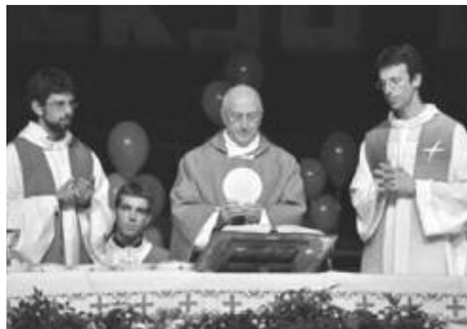
La santa Messa col Vescovo

Anche quest'anno, la nostra Diocesi ha organizzato la "festa diocesana Adolescenti" presso il PalaTrento. Per i giovani e gli Adolescenti delle nostre comunità della Valsugana Orientale è stata una festa particolarmente sen-