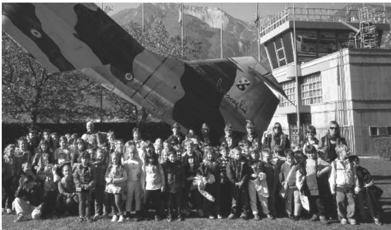
Gli scolari al museo "G. Caproni" con le insegnanti ed alpini

Molto interesse hanno dimostrato gli scolari che hanno formulato una lunga serie di domande appropriate ottenendo delle risposte esaurienti.