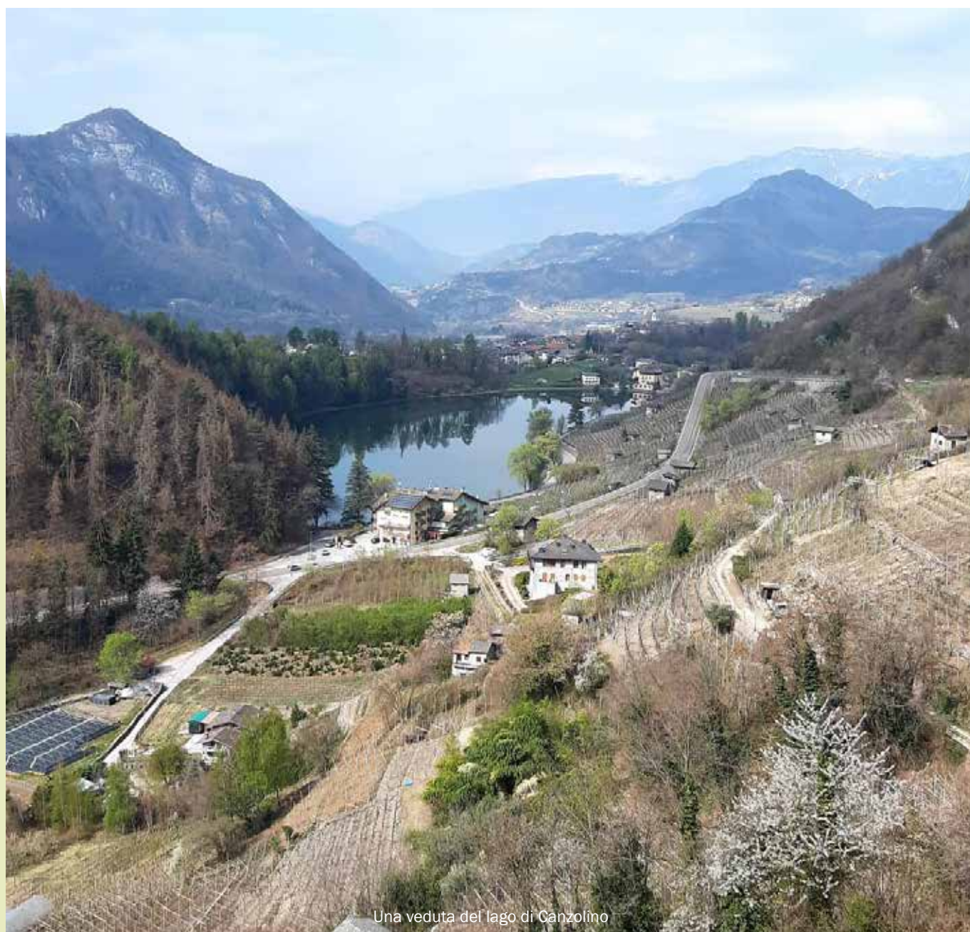
Una veduta del lago di Canzolino