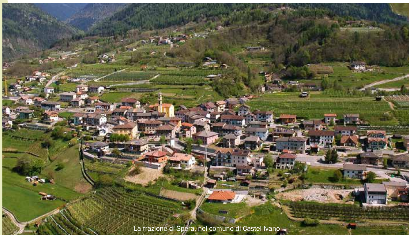
La frazione di Spera, nel comune di Castel Ivano

All'unanimità, infine, viene deciso di avvalersi della facoltà prevista dal comma 2 dell'art. 232 del TUEL di non tenere la contabilità economico - patrimoniale con riferimento all'esercizio 2021.