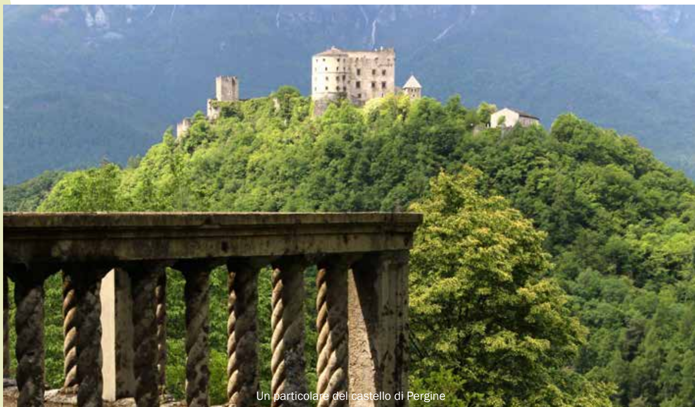
Un particolare del castello di Pergine