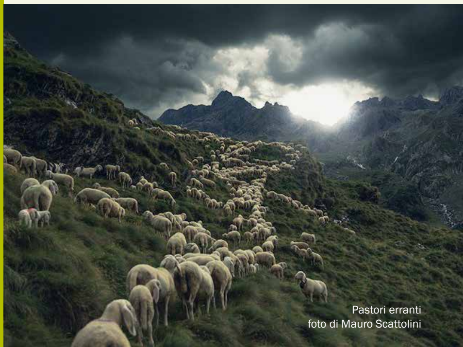
Pastori erranti

Redazione Corso Ausugum, 82 38051 Borgo Valsugana (TN) Tel. 0461 754560 - Fax 0461 752455 e-mail: info@bimbrenta.it