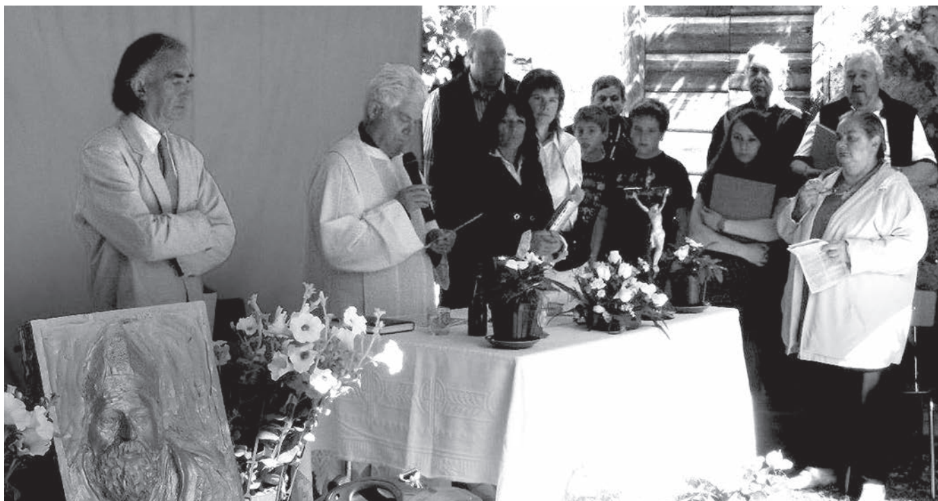
Un momento della celebrazione e, a sinistra, la scultura di San Desiderio

Da dove ora sei ti chiediamo di rivolgere il tuo pensiero a tutti noi che siamo quaggiù e che ti ricordiamo con tanto affetto”.