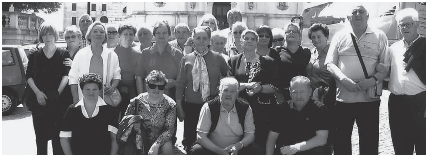
I partecipanti al pellegrinaggio a Monte Berico

Per iniziativa del locale gruppo Pensionati e Anziani, ha avuto luogo recentemente un pellegrinaggio al Santuario della Madonna di Monte Berico che ha visto la partecipazione di una trentina di persone del paese, soprattutto della terza età. A mezzo pullman, i partecipanti hanno raggiunto