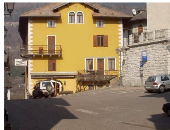
Piazza San Giorgio