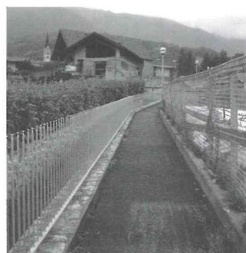
Il marciapiede lungo il rio Ensegua in località Pravazzi.