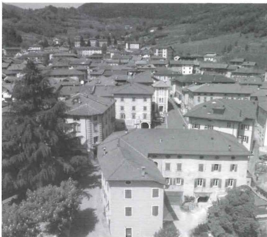
Nella foto sopra una veduta di Strigno e, in basso, il tradizionale mercato settimanale.