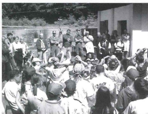
Due simpatiche foto che ricordano ai nostri lettori la tradizionale Festa degli alberi, svoltasi presso il vivaio forestale in Lunazza con gli alunni delle scuole materne e elementari.