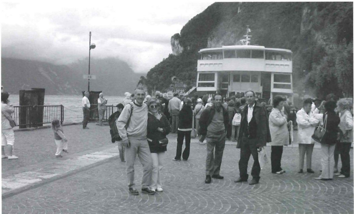
Foto di gruppo per i partecipanti alla gita di Riva del Garda