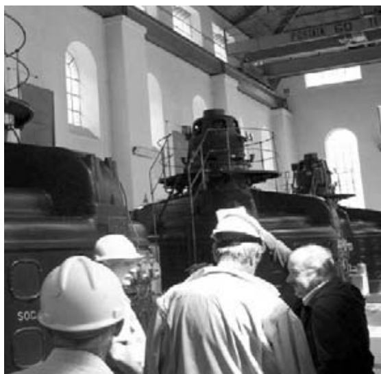
Interno della centrale di San Silvestro

Lo scopo di queste iniziative, oltre quello di “informare”, era di rendere consapevoli i partecipanti dell’importanza che l’energia occupa nella nostra società e dei relativi problemi che contestualmente provoca