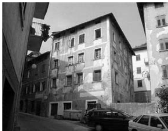
Casa Strapieri a Castello Tesino

L'Amministrazione comunale utilizzerà il mutuo accordato dal Consorzio BIM Brenta per il risanamento del ponte Santa Margherita,