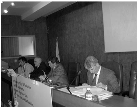
Il tavolo dei relatori dell'Assemblea Federbim