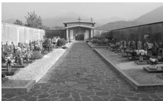
Il cimitero di Canale

L'Amministrazione comunale ha deciso di utilizzare il mutuo accordato dal Consorzio BIM Brenta per la parziale copertura dei lavori di ampliamento del cimitero della frazione Canale. L'incremento demografico e l'espansione urbanistica di Canale rendono infatti necessaria tale opera, che prevede l'ampliamento della zona a monte, la realizzazione di nuovi muri perimetrali, di un servizio accessibile anche ai disabili, di una nuova illuminazione, di un deposito per le attrezzature necessarie alla gestione del cimitero e di un parcheggio. Verranno inoltre ridisegnati e pavimentati in cubetti di porfido alcuni percorsi interni. Tutta l'area verrà quindi resa conforme alle normative vigenti. I lavori sono stati appaltati ad una ditta locale, che li sta eseguendo e dovrebbe ultimarli entro l'anno.