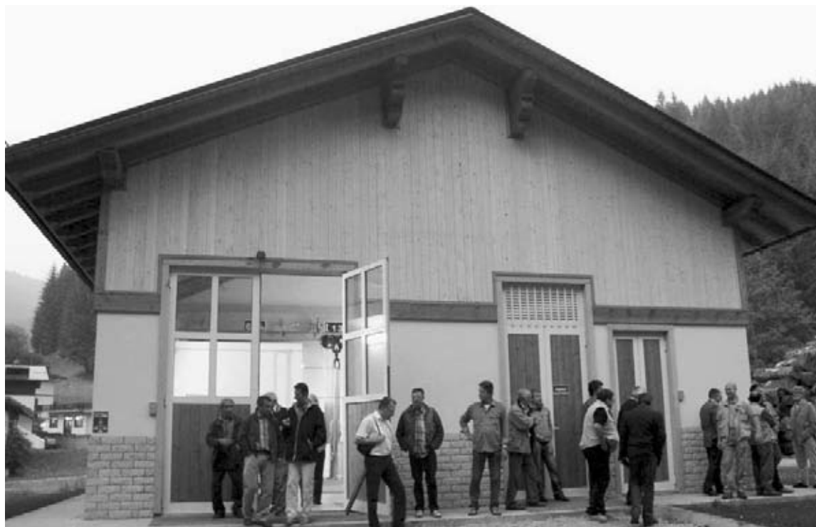
San Nicolò Comelico, la centralina idroelettrica