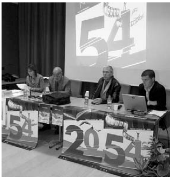
Un momento del convegno "Vivere sulla montagna"