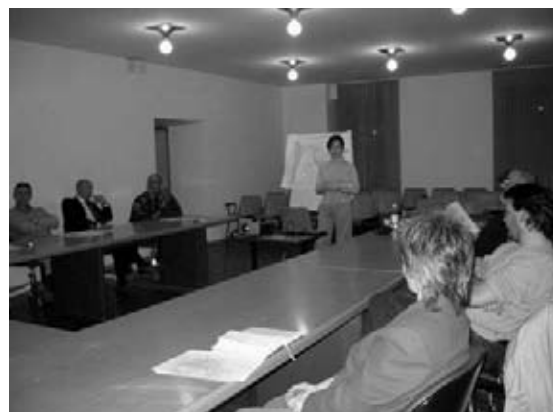
Incontro a Caldonazzo

Per implementare il modello sono state effettuate due sperimentazioni: la prima con un gruppo omogeneo formato dai rappresentanti di 10 delle 12 municipalità il cui territorio appartiene interamente o in parte al bacino idrografico oggetto dell'analisi (Bosentino, Calceranica al Lago, Caldonazzo, Centa San Nicolò, Folgaria, Lavarone, Levico Terme, Pergine Valsugana, Tenna, Vattaro, Vignola Falesina e Vigolo Vattaro); la seconda con un gruppo eterogeneo di partecipanti, al quale appartenevano il Dipartimento Agricoltura e Alimentazione e il Dipartimento Programmazione, Ricerca ed Innovazione della Provincia Autonoma di Trento, l'Agenzia per la Protezione dell'Ambien-