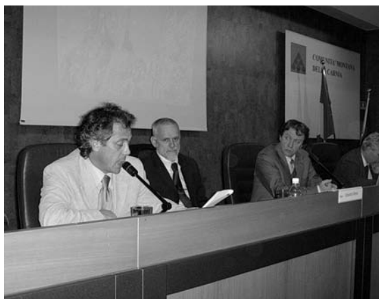
Il tavolo dei relatori dell'Assemblea Federbim

L'esigenza di fornire servizi ai soci ha già portato ad attivare un "Eurosportello", una rete di assistenza e di supporto alle piccole e medie im-