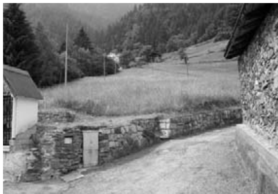
La zona dove sorgerà l'area attrezzata

frazione di Ronco Chiesa. Il progetto preliminare, in particolare, prevede lo sbancamento e la predisposizione del terreno, la realizzazione di una piazzetta pavimentata con un piccolo anfiteatro e che potrà venir coperta da un tendone, di un'area giochi e, interrati, un piccolo deposito e degli spogliatoi per gli animatori che proporranno delle attività. Allo stato attuale è stato assegnato l'incarico per la redazione del progetto definitivo e sono state avviate le procedure per l'acquisizione dei terreni. Si prevede che i lavori, finanziati quasi per intero dal mutuo del Consorzio e, per la parte rimanente, da fondi comunali, verranno eseguiti l'anno prossimo.