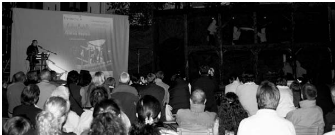
Lo spettacolo a Calceranica al Lago

A Luserna si è concluso il corso di formazione "Mettere in scena materiale etnografico"