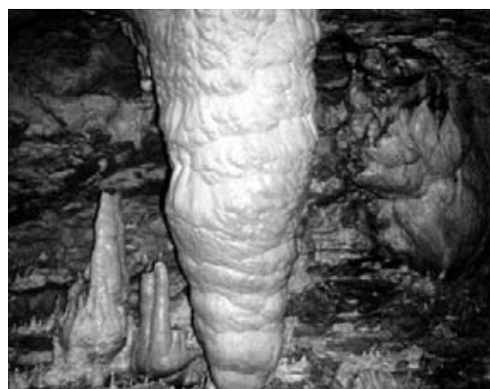
Particolare delle grotte di Castello Tesino

L'ultimo intervento riguarda la valorizzazione delle Grotte di Castello Tesino. L'unica cavità naturale attrezzata per le visite in provincia si snoda per circa 230 metri con un percorso affascinante costellato di stalattiti e stalagmiti e impreziosito da numerosi laghetti e pozze. Verrà messo in sicurezza l'ingresso