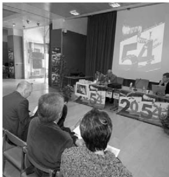
Un momento del convegno "Vivere sulla montagna"

marchio Federbim e delle iniziative attuate dai Consorzi BIM durante la suddetta giornata (programmi e stampe, comunicati stampa, sito web dell'evento); la Cineteca del Filmfestival a disposizione dei Consorzi BIM per tutto l'arco dell'anno. Tutto questo in risposta al sostegno finanziario al Filmfestival da parte di Federbim e dei Consorzi BIM del Trentino Alto Adige.