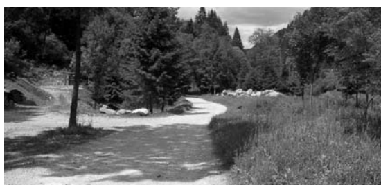
La Strada Piana a Siror

Il Comune di Siror ha appaltato ad una ditta locale i lavori di asfaltatura di 1,5 km di "Strada piana", la via che porta dal ponte sul torrente Cismon alla zona artigianale in direzione della centrale elettrica di Civertaghe. Contestualmente verranno anche realizzate alcune piazzole di sosta, la canalizzazione e gli scarichi per le acque piovane. I lavori sono già in fase di esecuzione e verranno completati entro il mese di luglio.