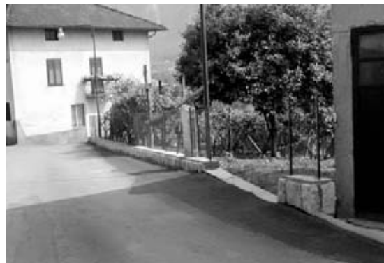
Via Margere a Villa Agnedo

Alcuni lavori legati alla viabilità comunale sono stati finanziati quasi per intero dal mutuo concesso dal Consorzio BIM Brenta. Nello specifico si è trattato del rifacimento del muro che sostiene Via Borgo Careno, con posizionamento del parapetto in ferro, per una lunghezza di 20 metri; la demolizione di un muretto appartenente a un privato per consentire l'allargamento di Via Margere, con spostamento di un punto luce e di una cassetta di derivazione dell'ENEL. I lavori sono già stati completati da parte di una ditta locale.