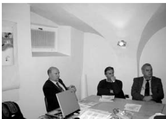
Incontro presso la sede del Consorzio BIM Brenta

Purtroppo il nostro Paese non vanta una lunga tradizione per quanto concerne la partecipazione pubblica nella gestione delle acque, ragione per cui gli obiettivi della Direttiva Quadro rappresentano una notevole sfida; tuttavia l'implementazione di CATCH in Alta Valsugana ha evidenziato la presenza di un notevole interesse per questa tematica, oltre a una concreta volontà di raccogliere la sfida della Direttiva Quadro per utilizzare al meglio tutte le potenzialità offerte dalla partecipazione pubblica nella gestione dei bacini idrografici.