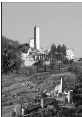
In copertina: Castel Telvana a Borgo Valsugana