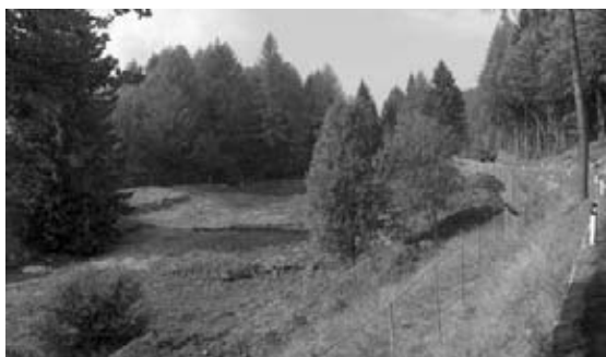
L'area dove sorgerà la zona artigianale di Luserna

sospesi poco dopo a causa del ritrovamento di forni fusori risalenti all'età del bronzo, che hanno comportato lo spostamento dell'area per consentire i sondaggi e gli scavi opportuni. La variante al PRG è stata approvata ed è entrata in vigore il 13 giugno. È in corso la procedura espropriativa per l'ampliamento e l'approvazione della perizia di variante.