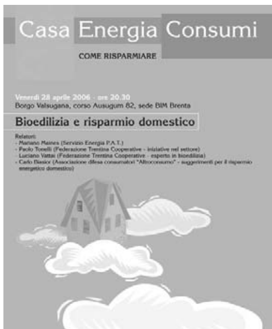
La locandina della prima conferenza

centrale idroelettrica di San Silvestro della Primiero Energia SpA; a San Nicolò Comelico, con visita ad un piccolo impianto idroelettrico appena finito, di ultima generazione tecnologica.