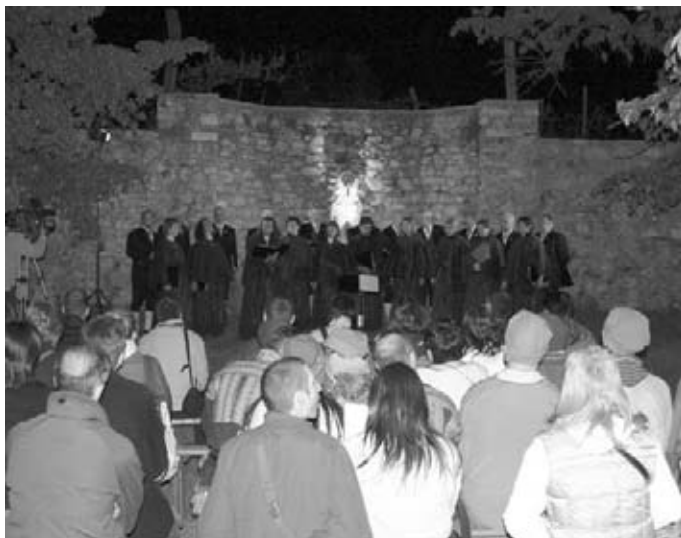
L'esibizione della Corale Cimbri al Calendimaggio

denominato "Ulysse" che riconosce le iniziative più innovative e rispettose dell'ambiente. Il progetto RETE EUROPEA DEL TURISMO DI VILLAGGIO, gestito a livello trentino dai due Enti