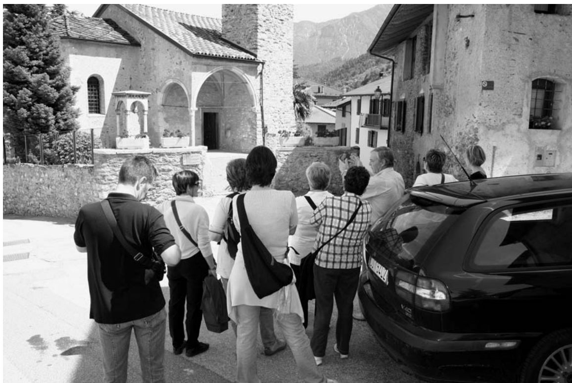
Visita a Calceranica al Lago nell'ambito dello scambio di esperienze tra villaggi trentini aderenti alla Rete

bra si è esibita con un repertorio di ballate e ninne nanne, era pure stata allestita un'esposizione di prodotti artigianali del paese, tra cui preziosi lavori al tombolo, oltre ad alcuni pannelli che illustravano le origini, la storia e la realtà di questa isola linguistica tedesca nel Trentino.