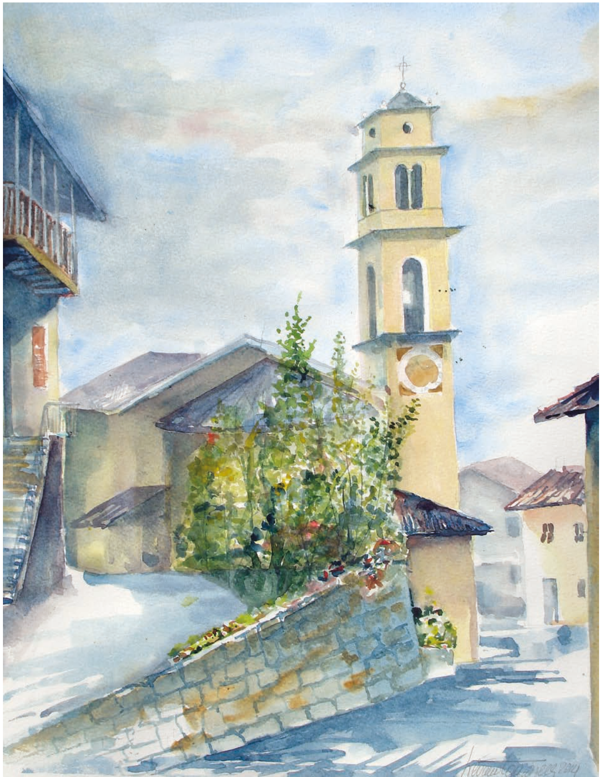
Spera, Chiesa dell'Assunta