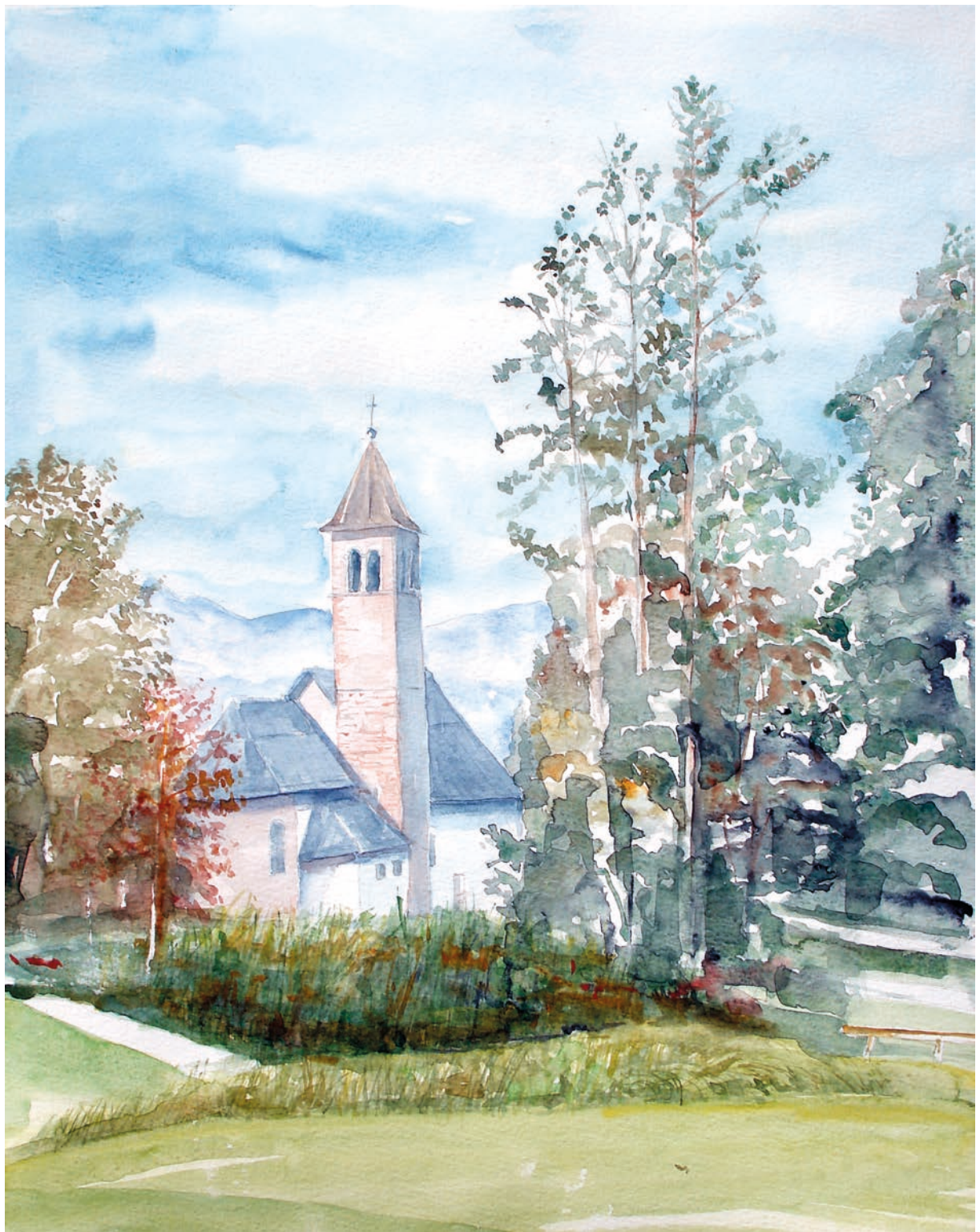
Bieno, Chiesa parrocchiale di S. Biagio