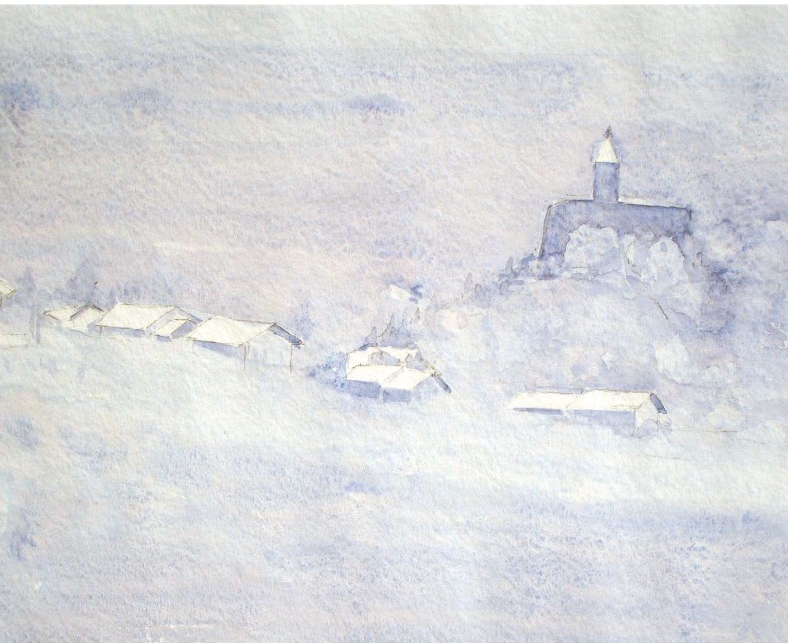
Ivano, veduta invernale