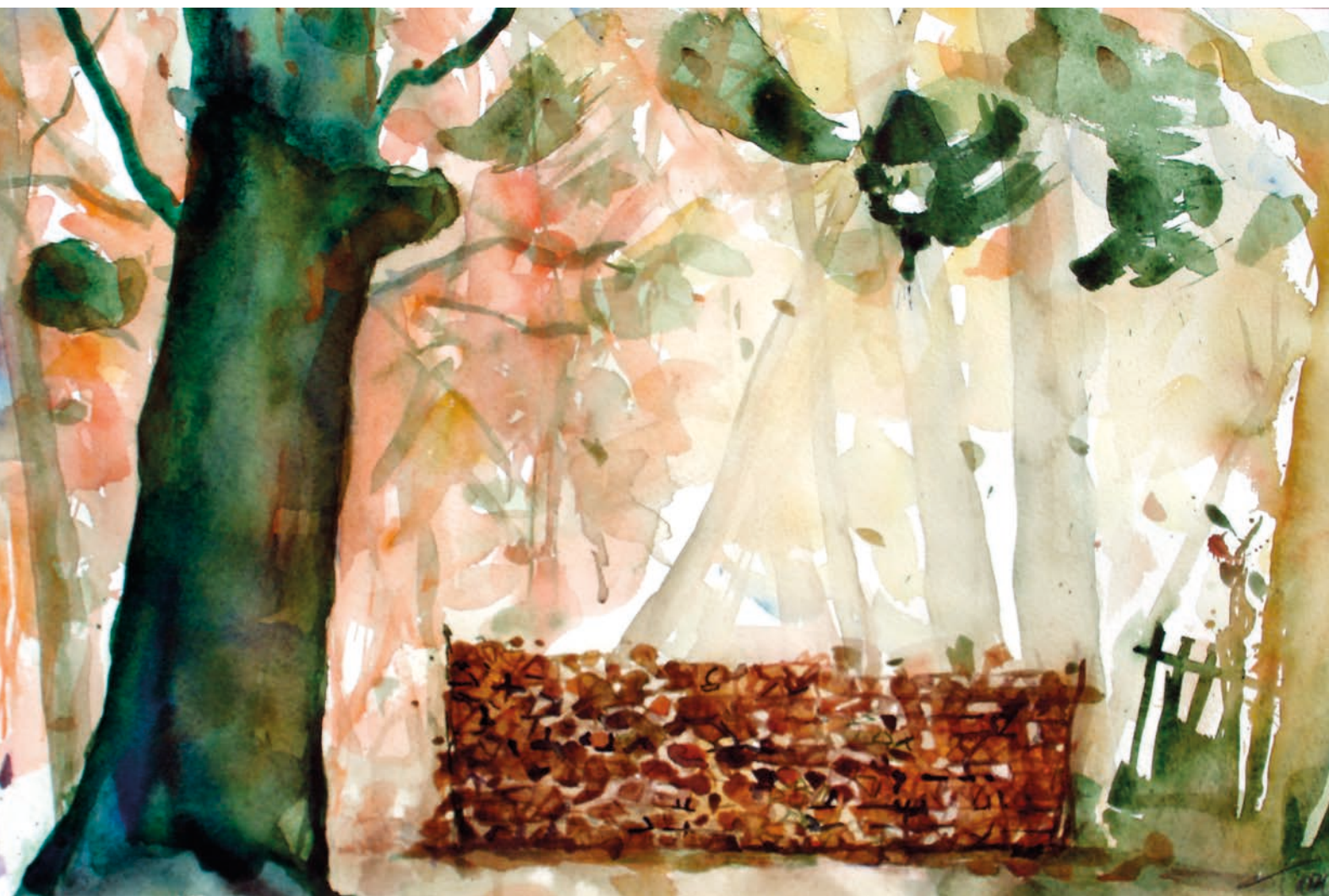
Bieno - I castagni