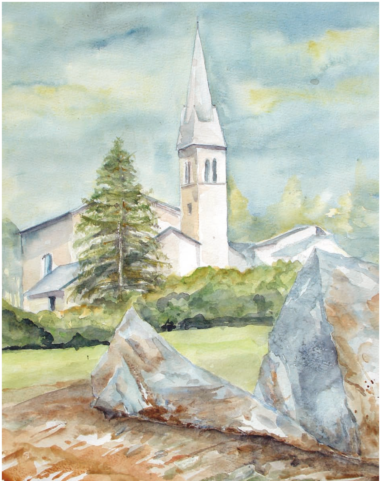
Villa Agnedo, la Chiesa dei Santi Fabiano e Sebastiano