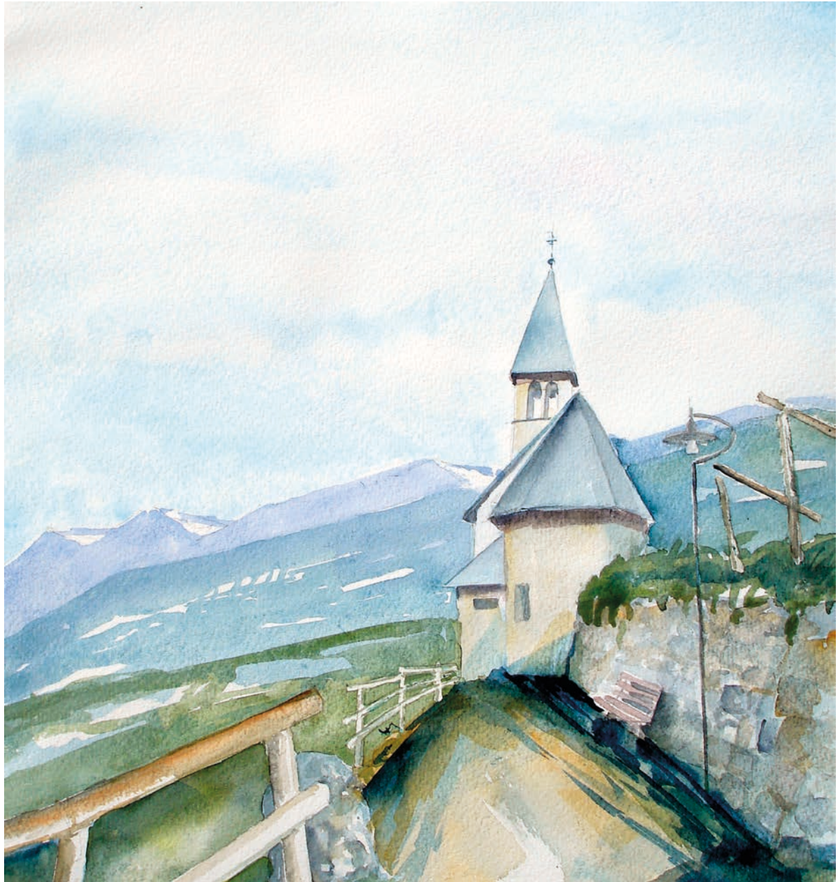
Scurelle, Chiesa dei Santi Martino e Valentino