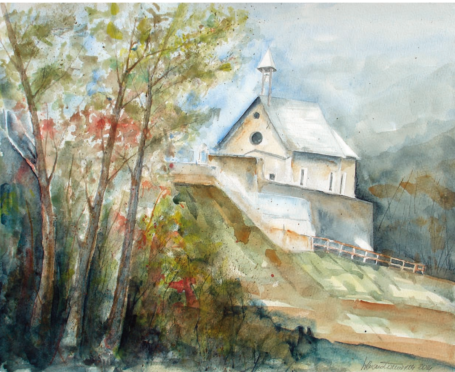
Spera, chiesetta di S. Apollonia