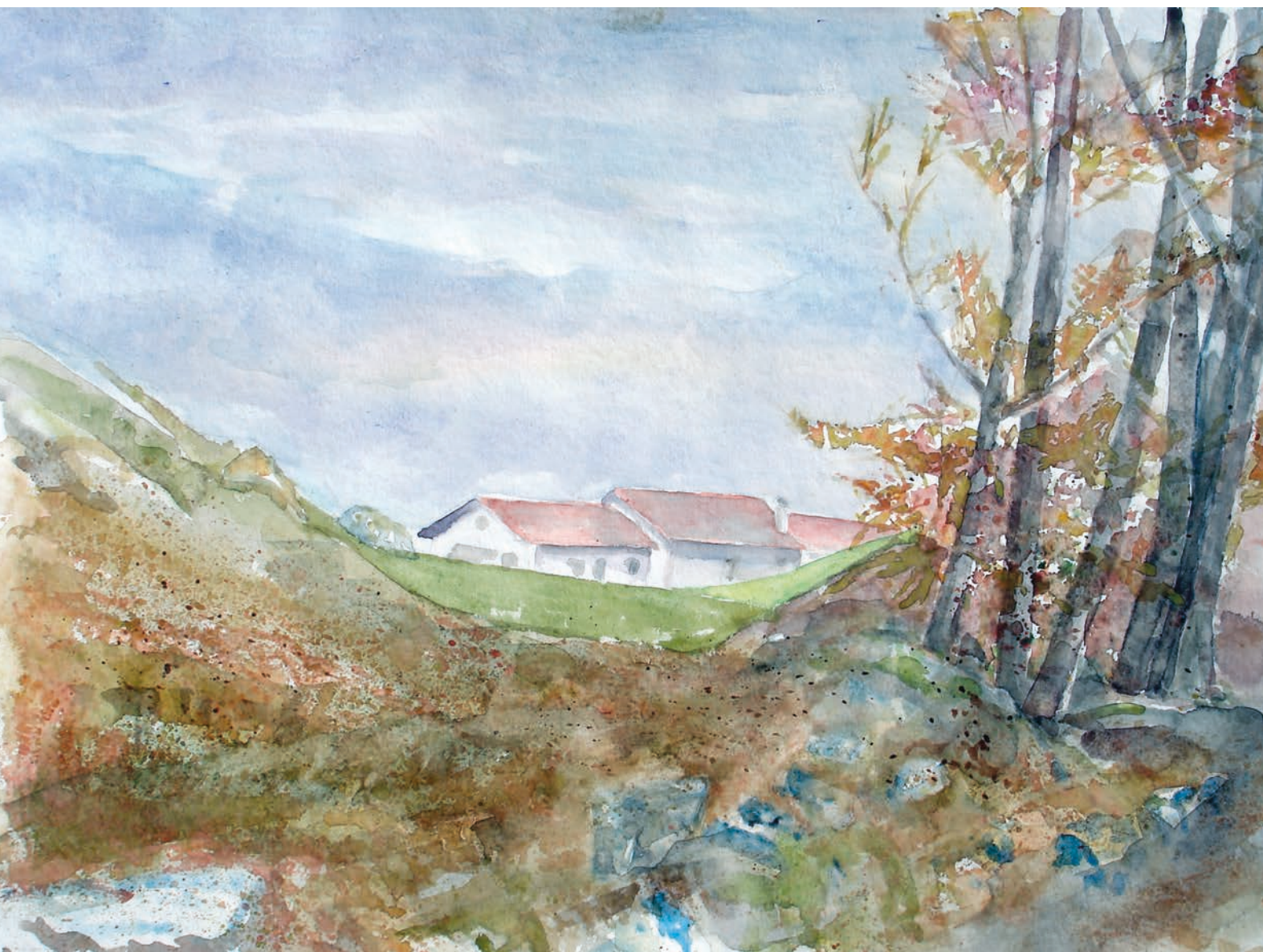
Spera, autunno ai Torgheli