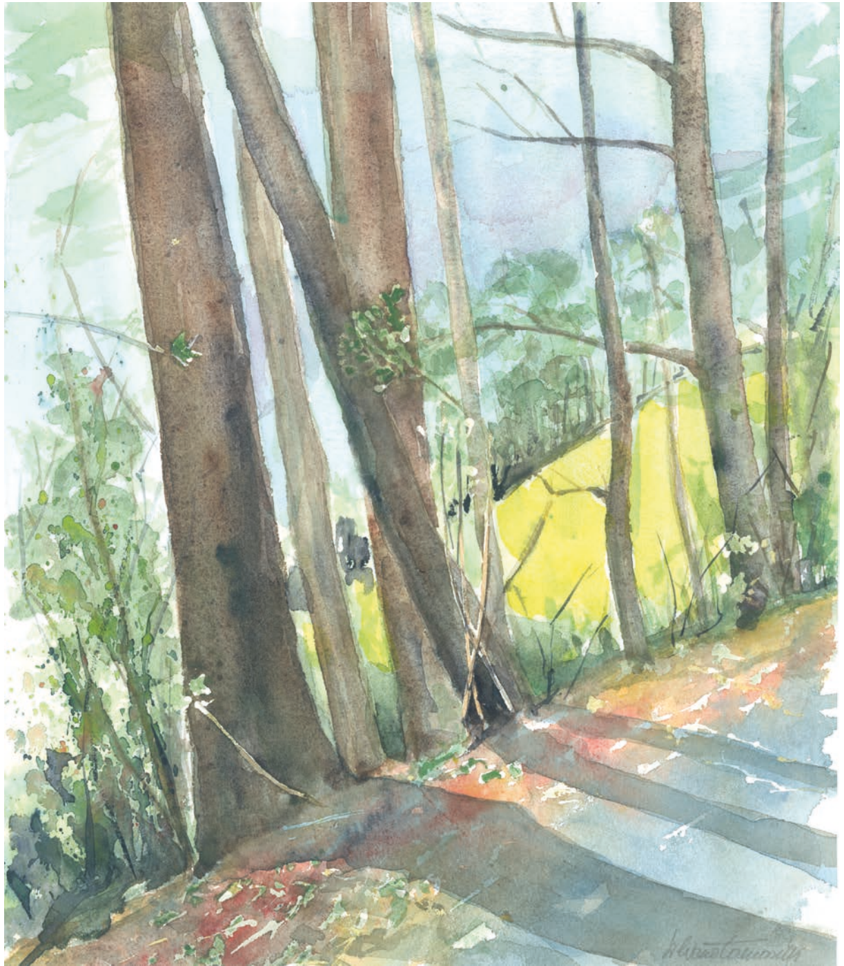
Strigno, Via Longa