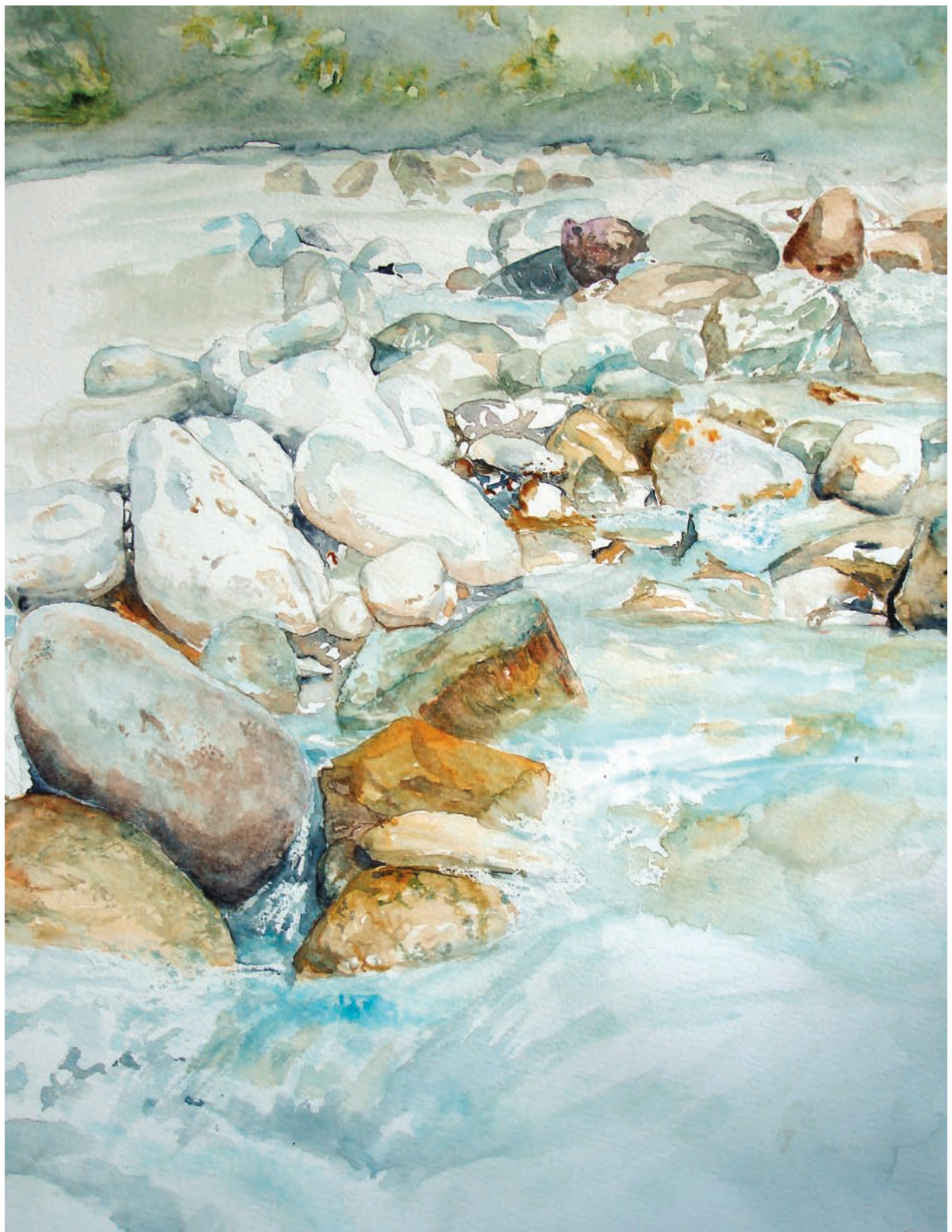
Villa Agnedo, il Chieppena