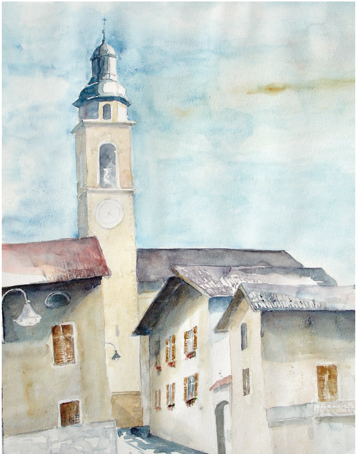
Ospedaletto, il campanile