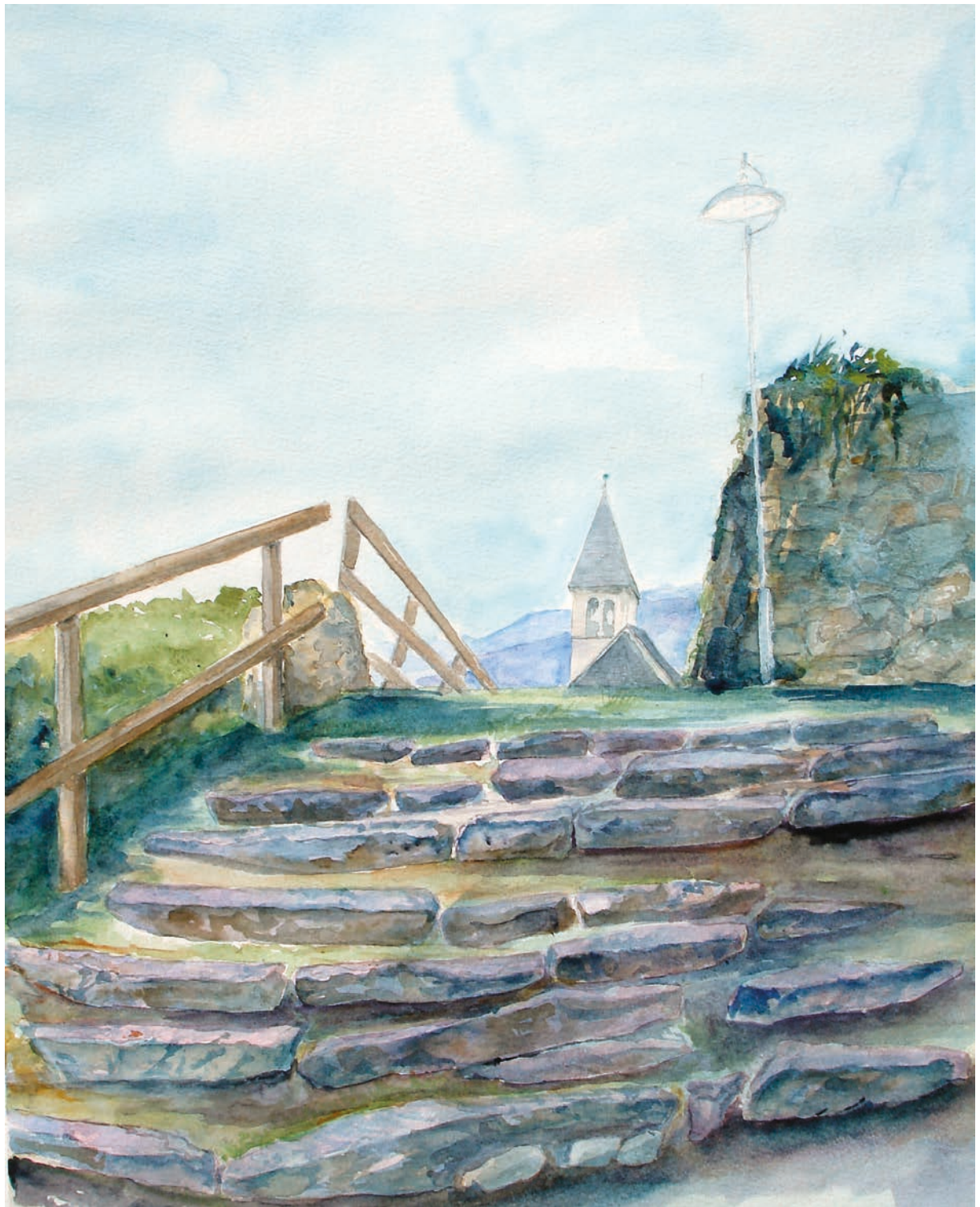
Scurelle, le scalette