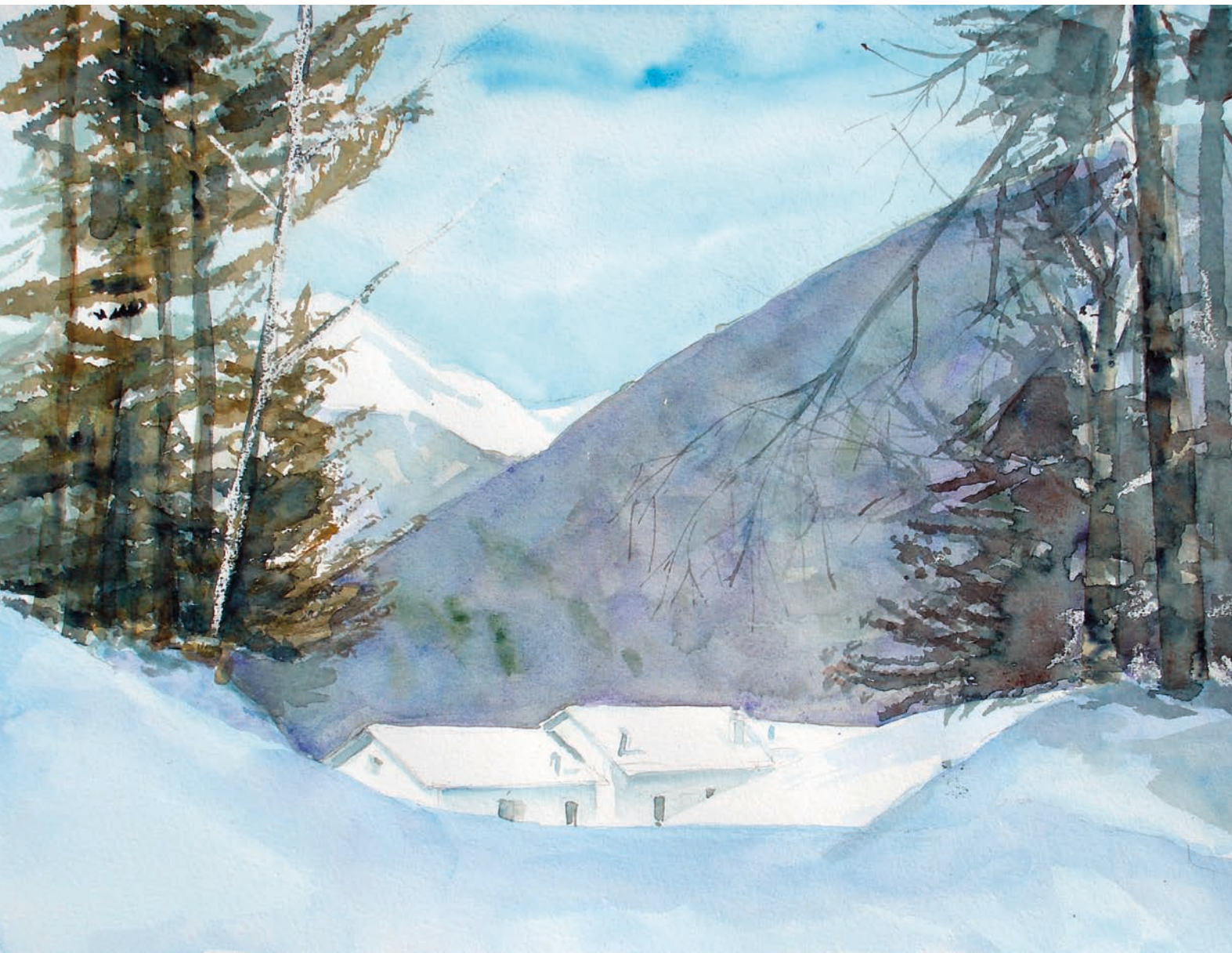
Spera, località Torgheli