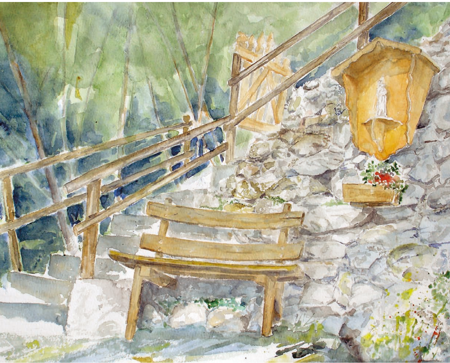
Scurelle, Sant'Antonio alle Castellare