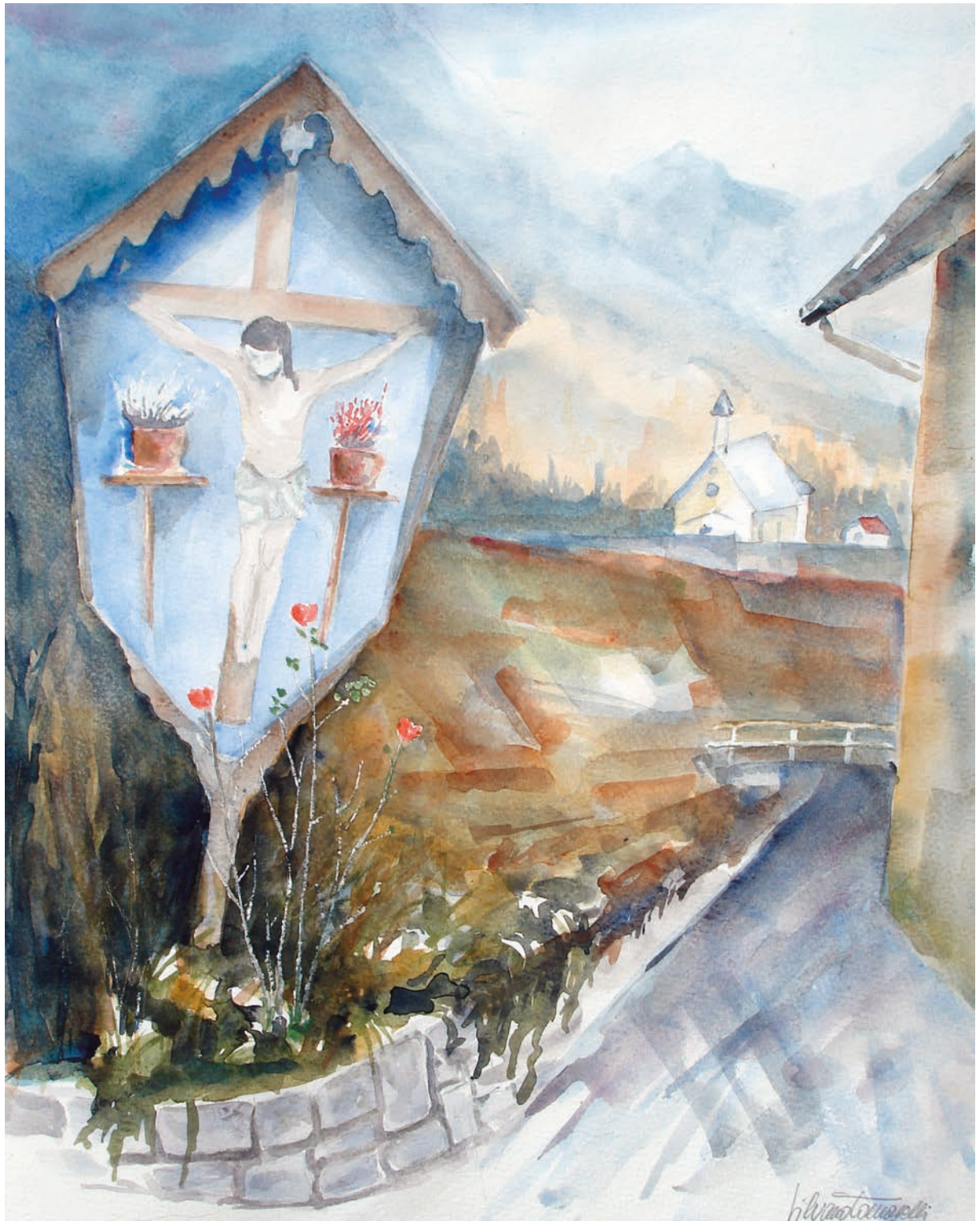
Spera, Il crocifisso