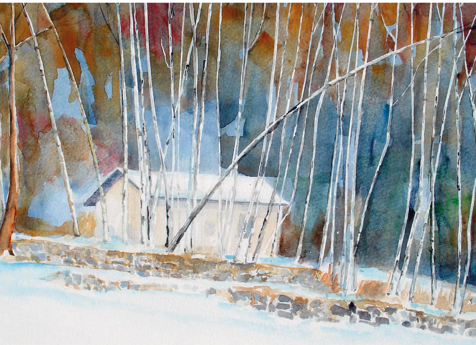
Strigno, località Relle