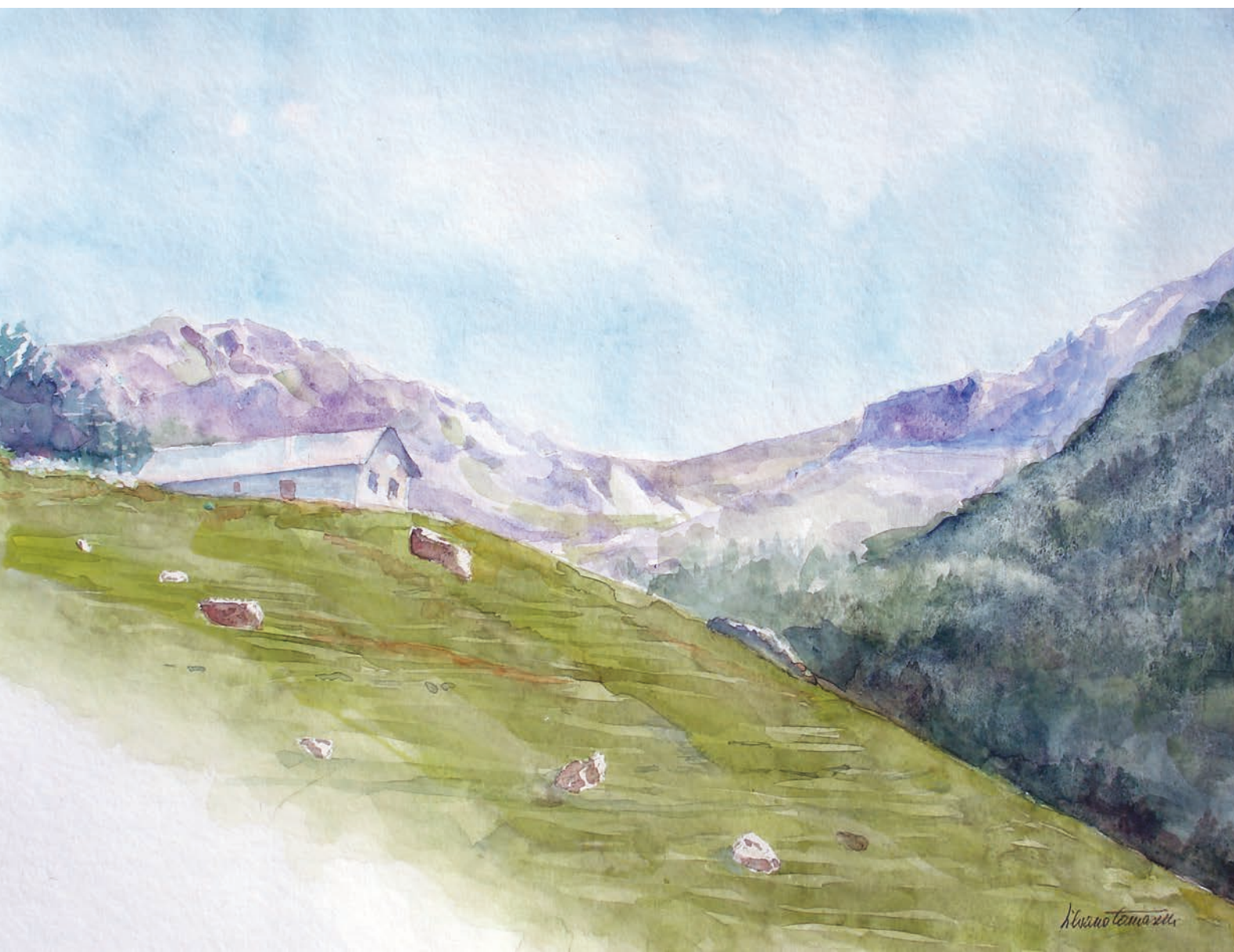
Spera, Malga Primaluna