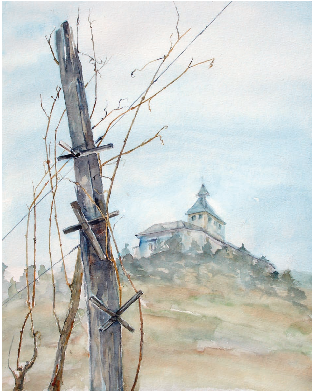
Ivano, vecchi filari