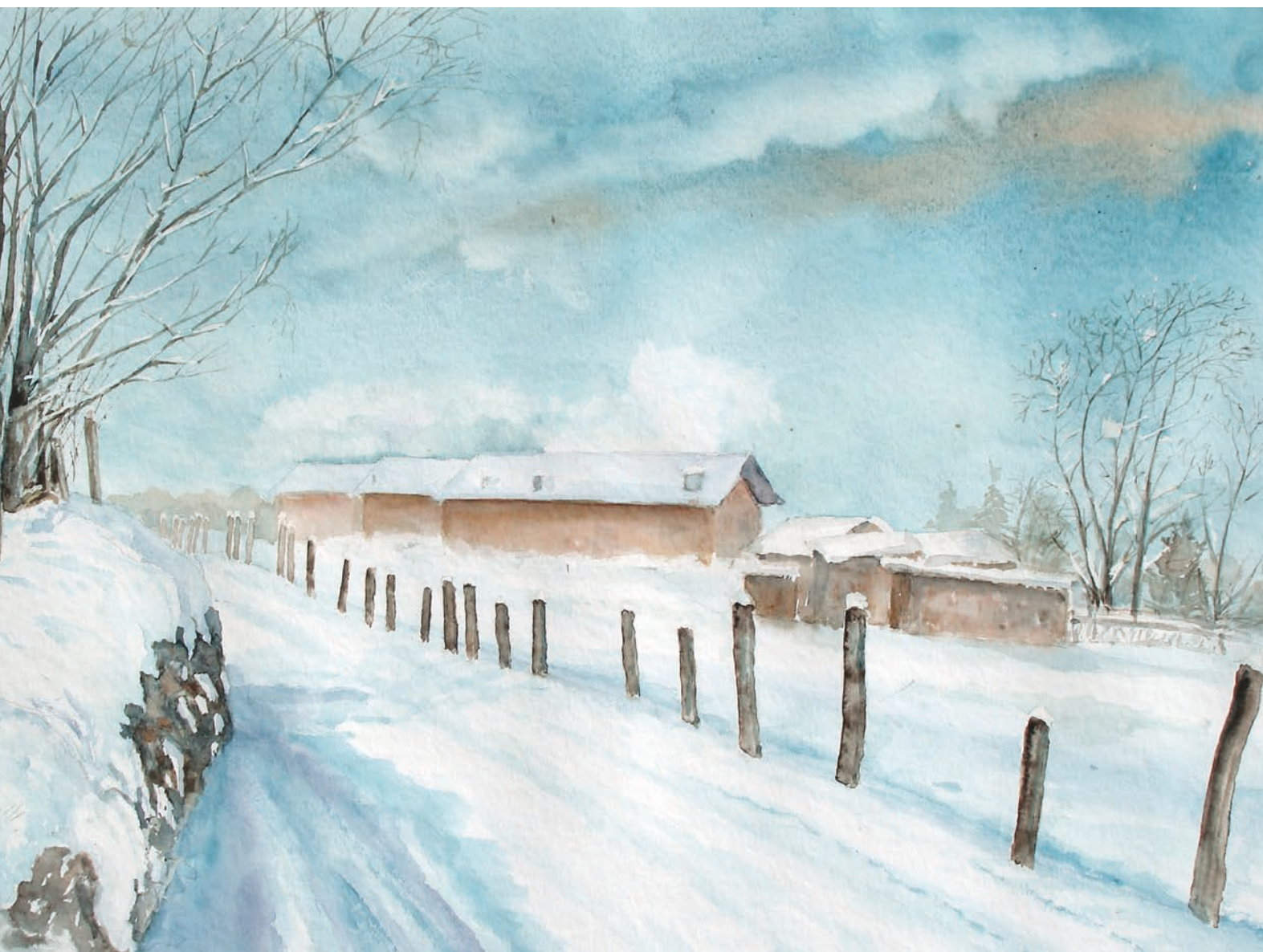
Spera, inverno ai Torgheli