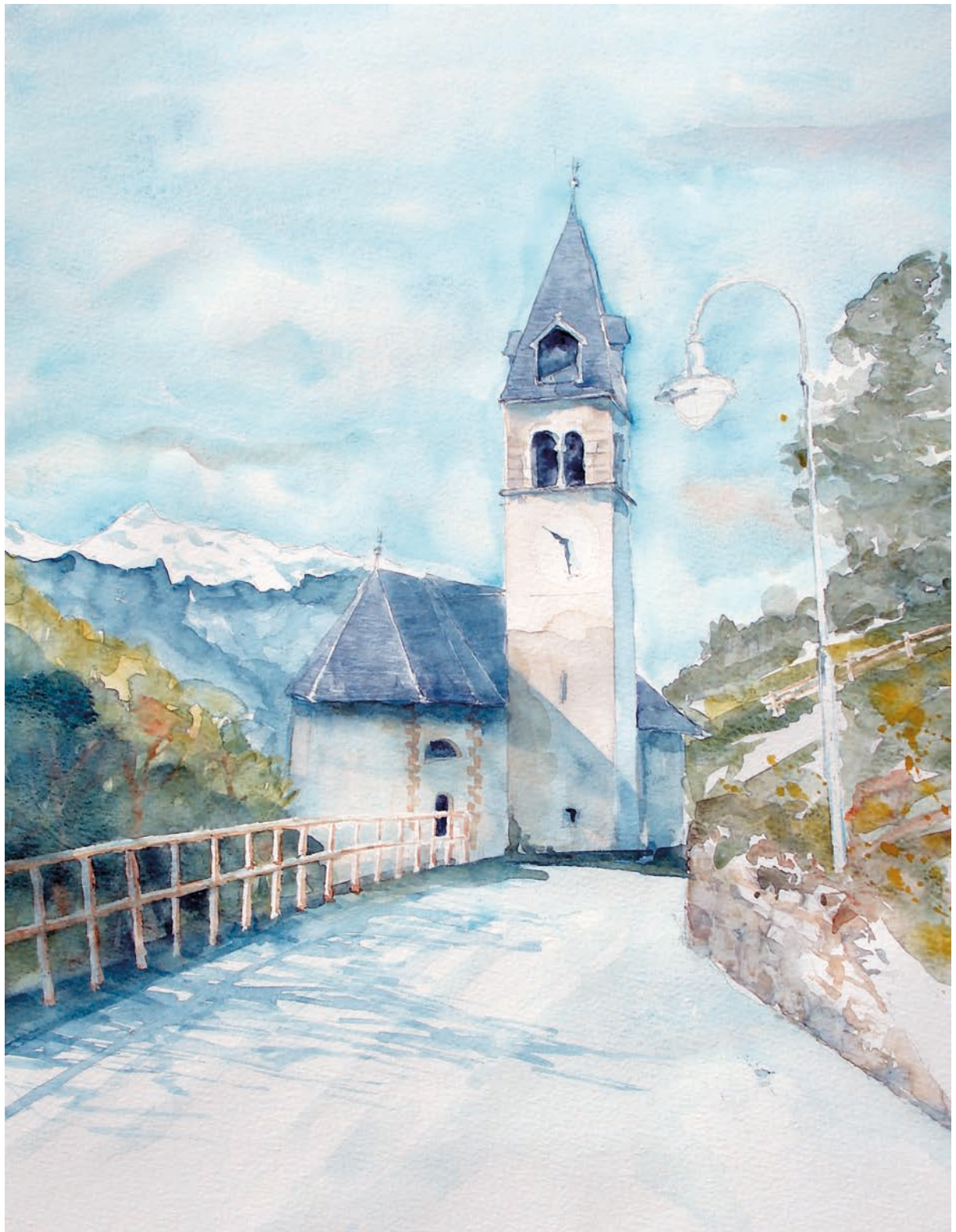
Samone, Chiesa di S. Donato