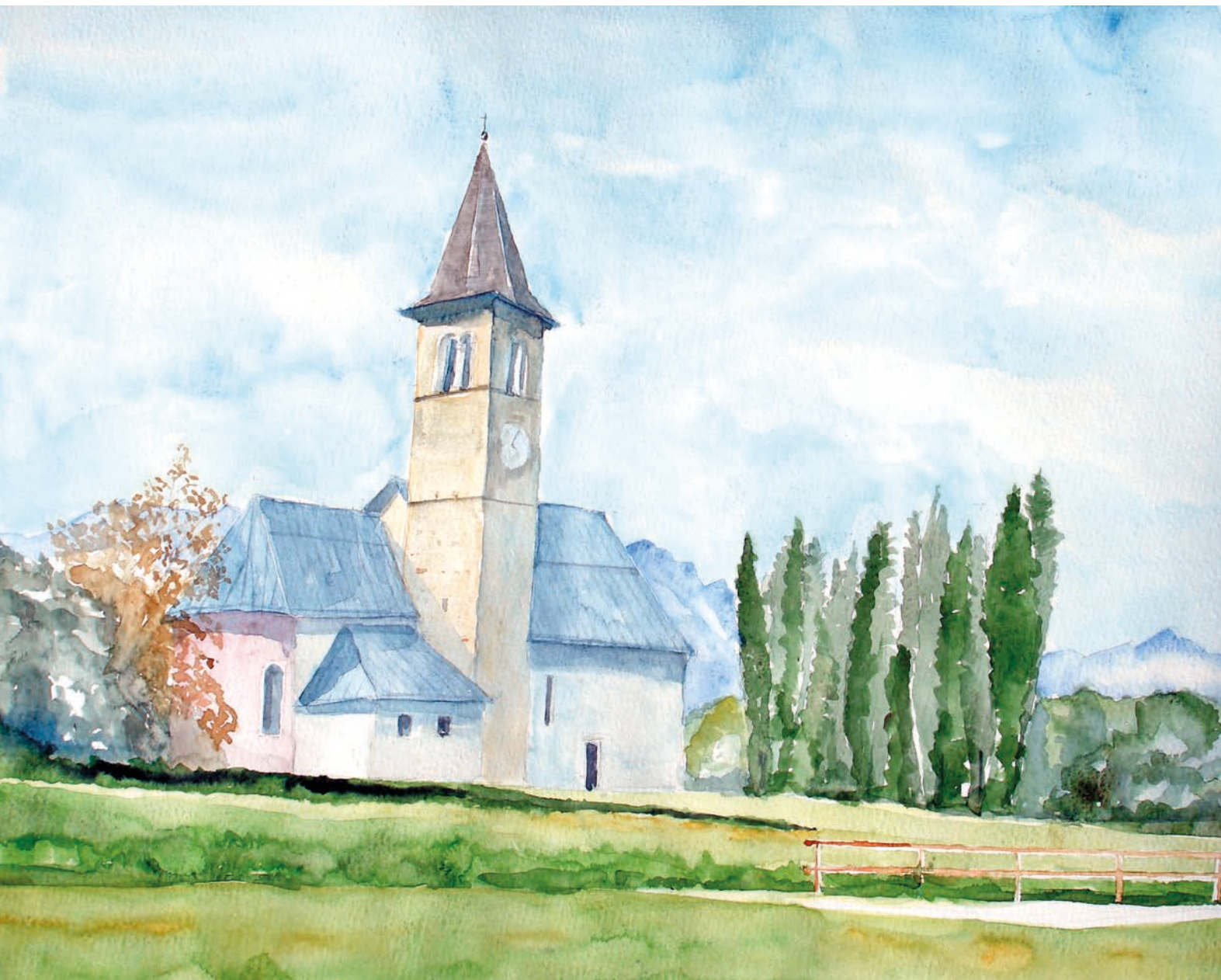
Bieno, Chiesa parrocchiale di S. Biagio