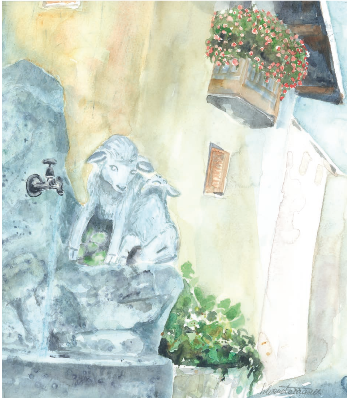
Agnedo, la fontana